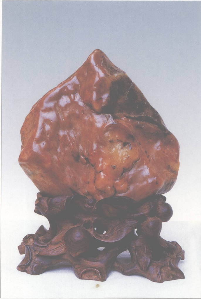
题名 佛坐参禅 石种 红黄蜡石 藏者 劳秉衡 产地 潮州 规格 (13 × 14) cm