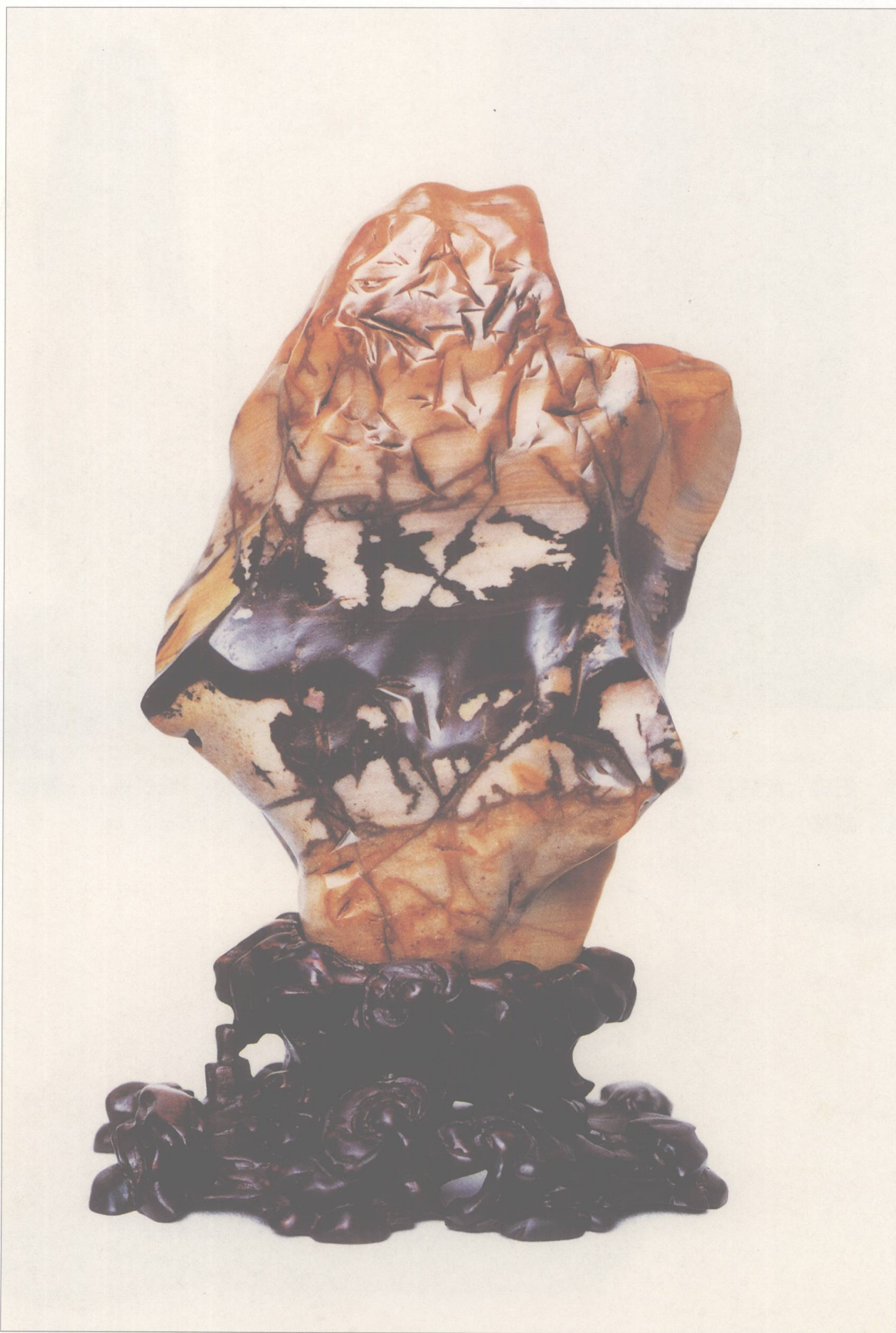
题名 热带风光 石种 五彩蜡石 藏者 劳秉衡 产地 潮州 规格 (13.5 × 21) cm