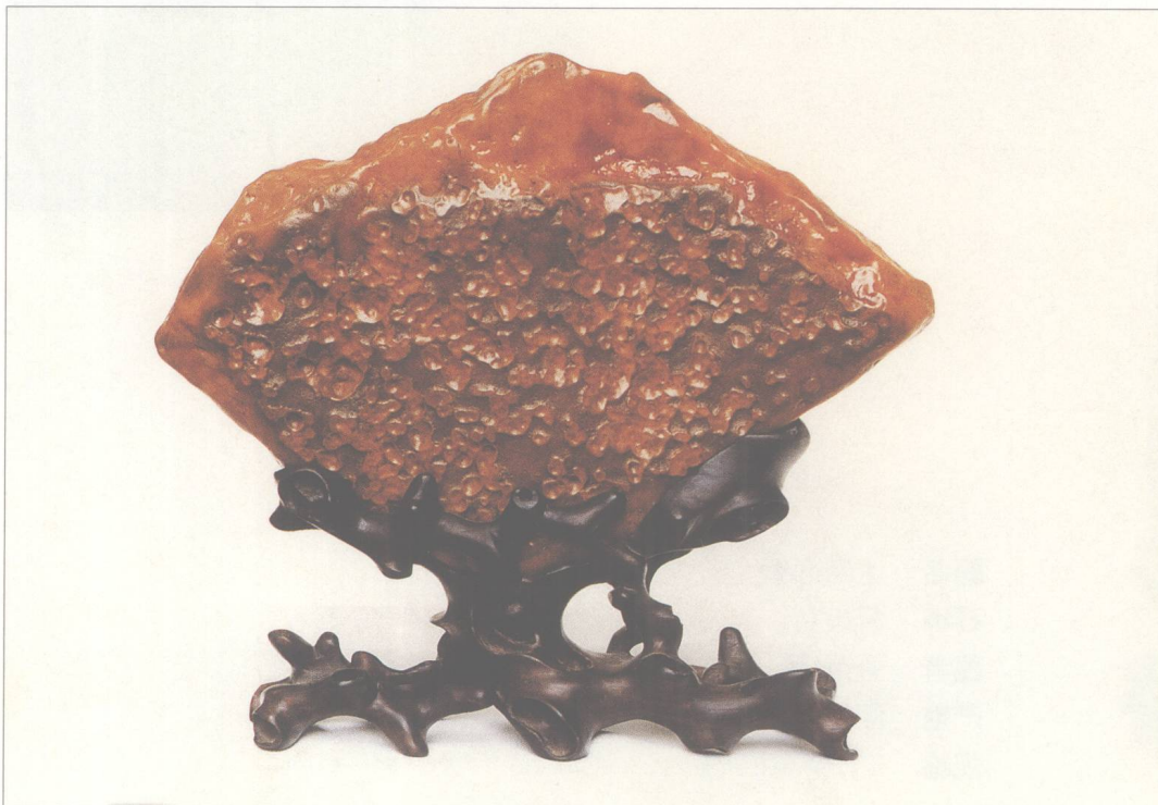
题名 金玉满堂 石种 红蜡石 藏者 麦盛逵 产地 潮州 规格 (20 × 17) cm