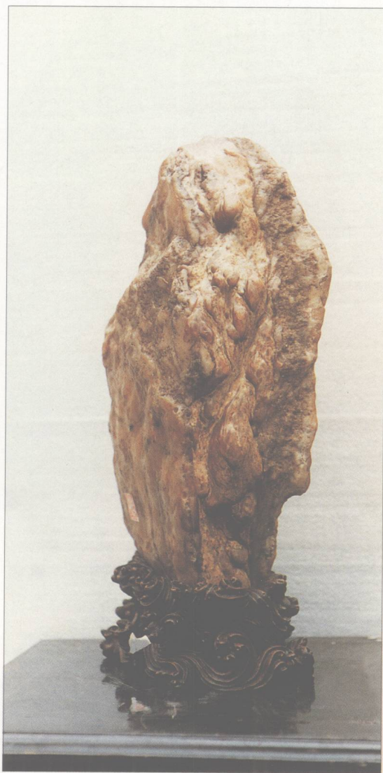
题名 高山流水 石种 花蜡石 藏者 谢荣耀 产地 潮州 规格 (23 × 38) cm