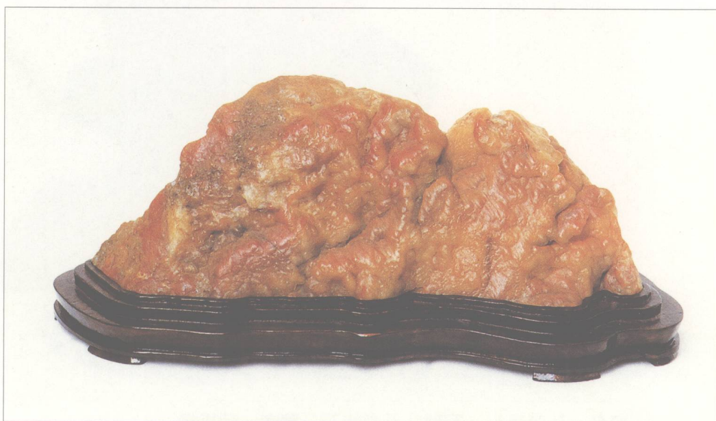
题名 黄山枫影点点红 石种 黄蜡石 藏者 李敬枝 产地 潮州 规格 (28 × 14) cm