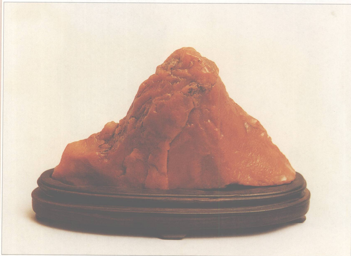
题名 独秀峰 石种 红黄蜡石 藏者 徐文正 产地 潮州 规格 (15 × 10) cm