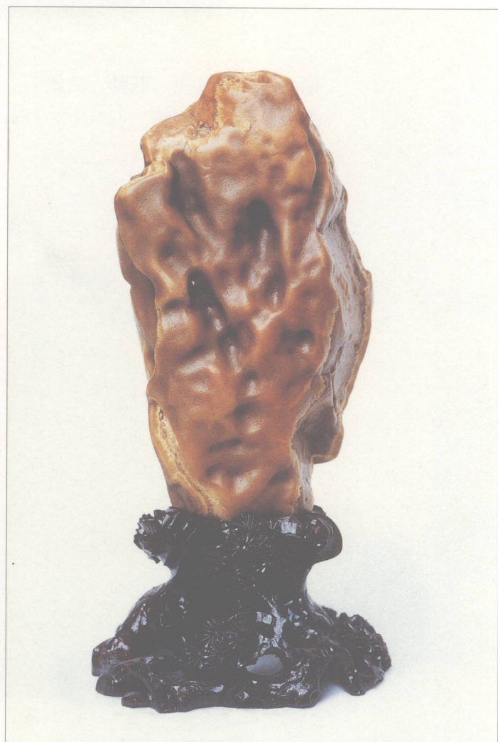
题名 巅峰挂瀑 石种 黄蜡石 藏者 劳秉衡 产地 潮州 规格 (13 × 22) cm