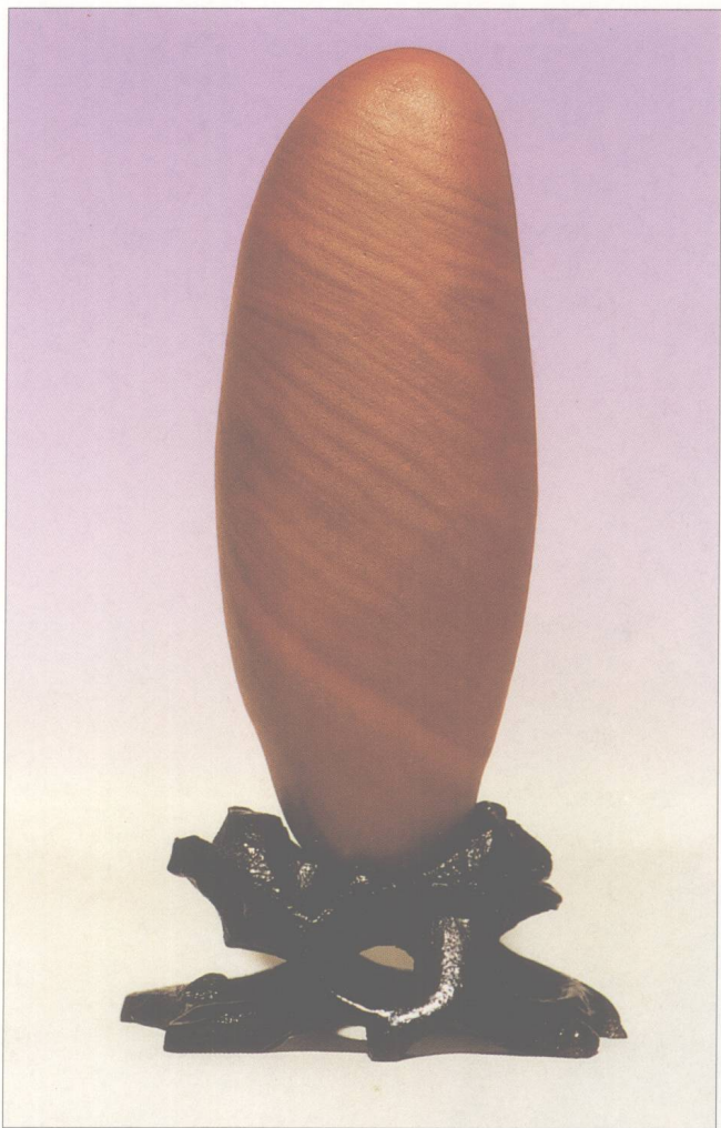
题名 梦痕 石种 黄蜡石 藏者 邓燕莹 产地 潮州 规格 (5 × 13) cm