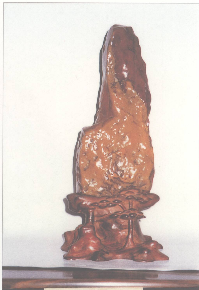
题名 鸿运当头 石种 红黄蜡石 藏者 谢荣耀 产地 潮州 规格 (9 × 20) cm