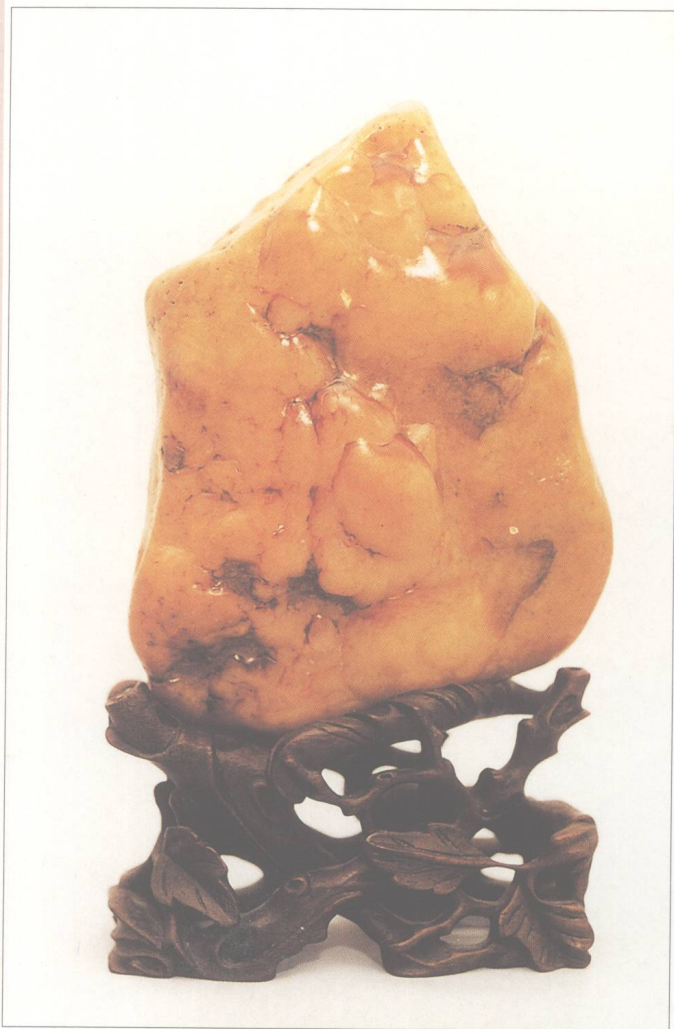
题名 蓓蕾待绽 石种 黄腊石 藏者 谢荣耀 产地 潮州 规格 (13 × 16) cm