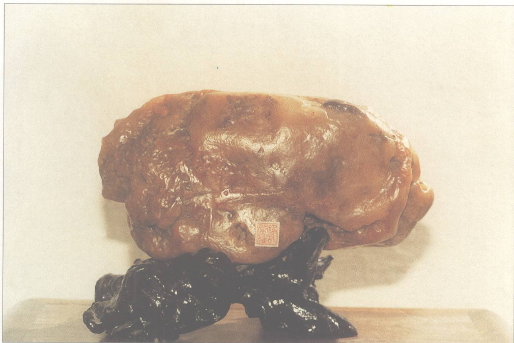
题名 金猪贺丰年 石种 花蜡石 藏者 谢荣耀 产地 潮州 规格 (22 × 12) cm