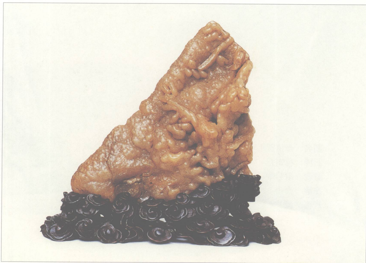
题名 喜鹊欢飞 石种 白蜡石 藏者 劳秉衡 产地 潮州 规格 (20 × 20) cm