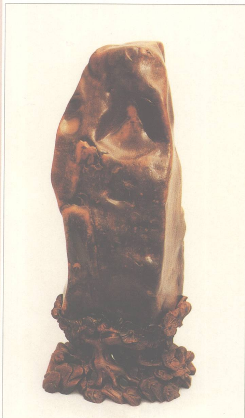
题名 达摩面壁 石种 酱蜡石 藏者 劳秉衡 产地 潮州 规格 (12 × 20) cm