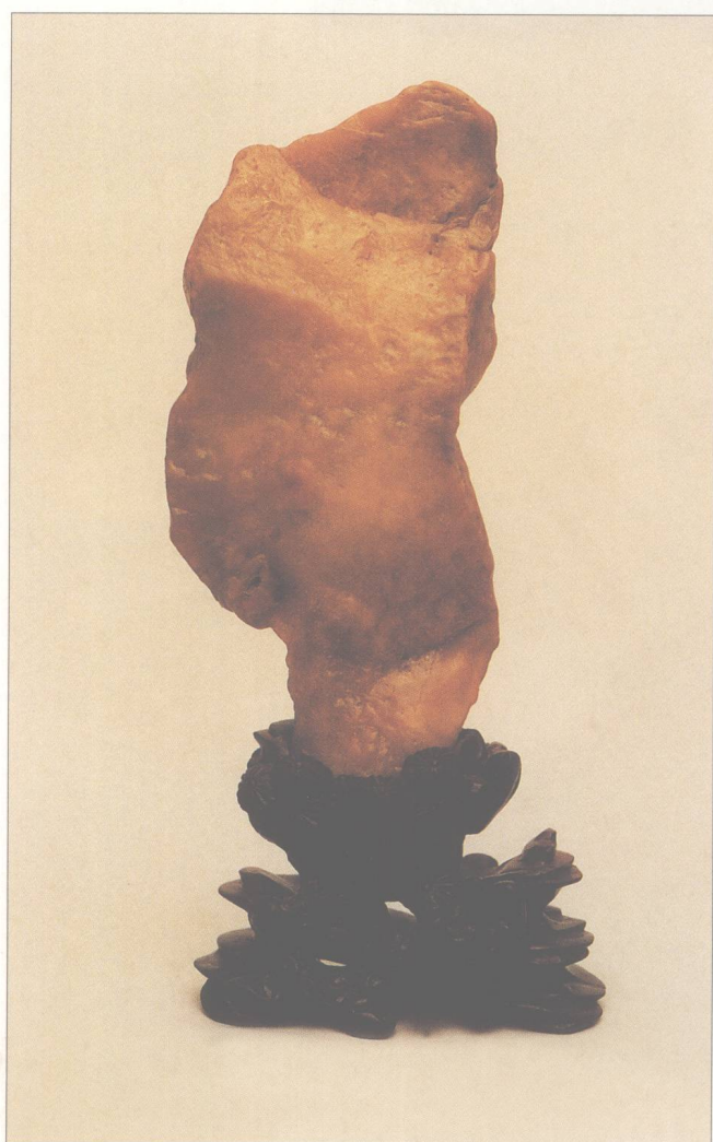
题名 达摩 石种 黄蜡石 藏者 容询荣 产地 潮州 规格 (10 × 20) cm