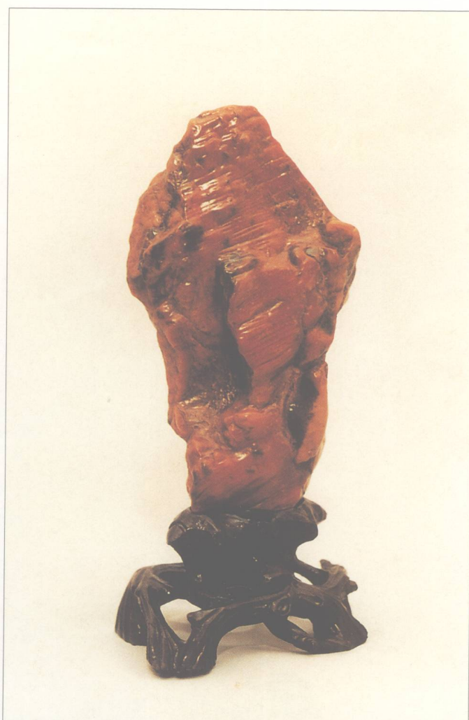
题名 赤壁英魂 石种 红蜡石 藏者 谢荣耀 产地 潮州 规格 (10 × 20) cm