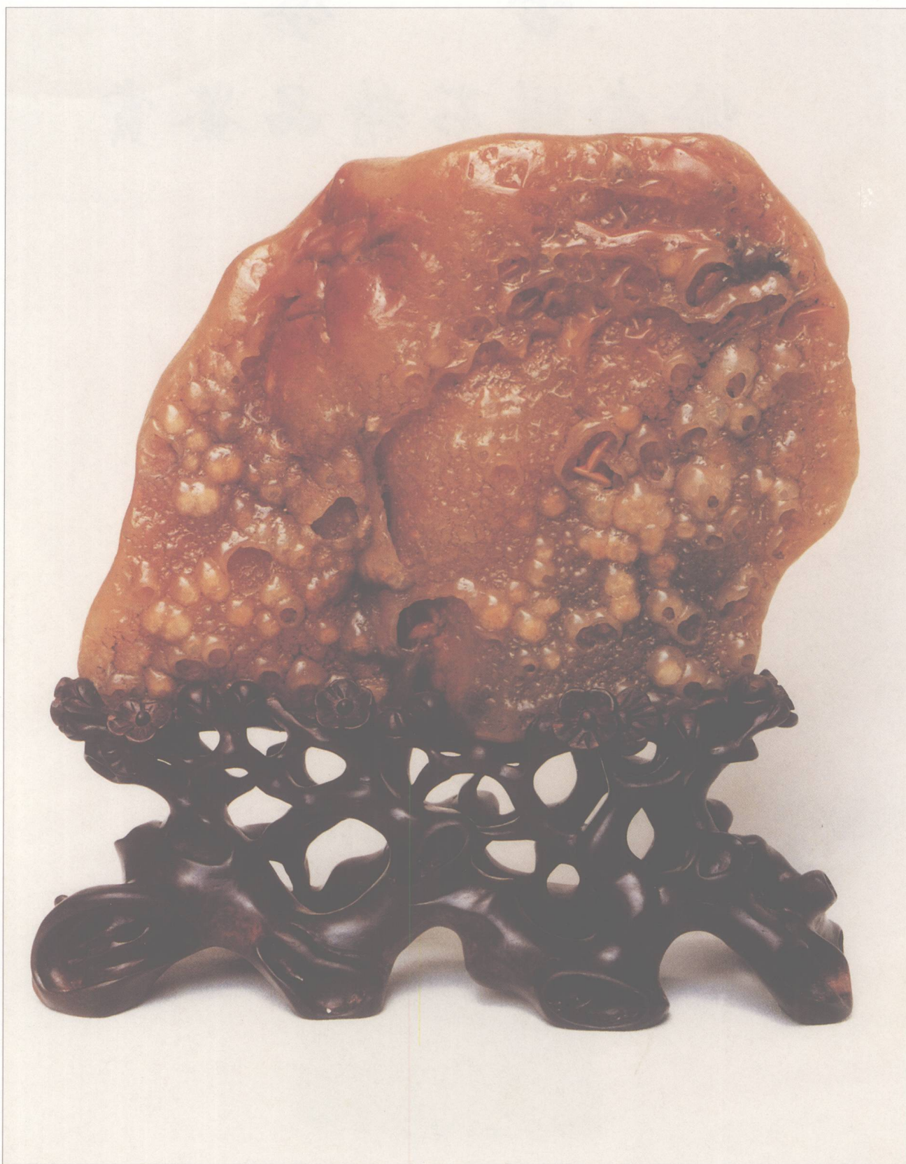
题名 傲雪寒梅 石种 黄白冻蜡石 藏者 劳秉衡 产地 潮州 规格 (18 × 16) cm