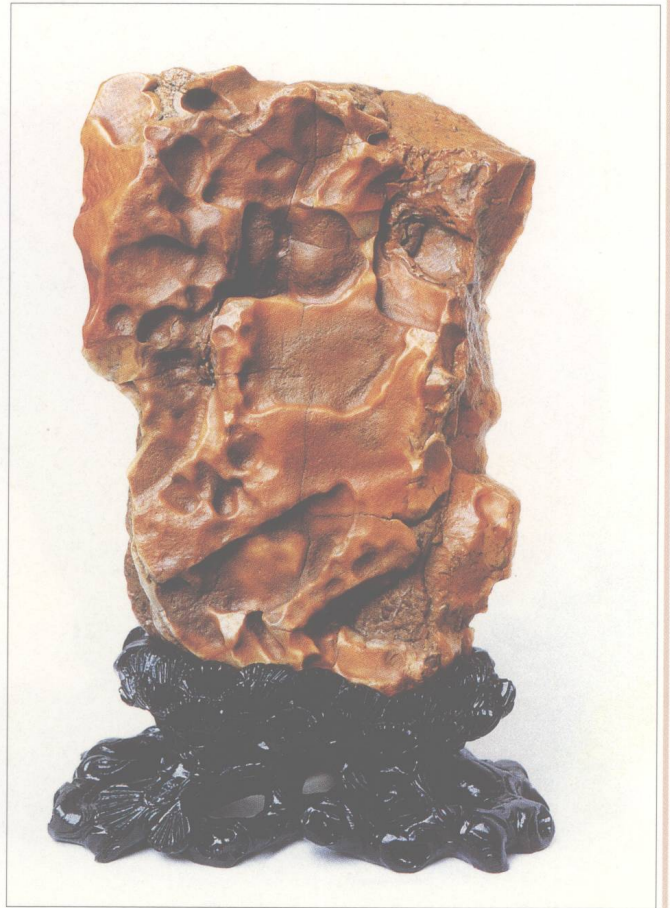
题名 嵌空穿眼，宛若相通 石种 黄蜡石 藏者 劳秉衡 产地 潮州 规格 (20 × 30) cm