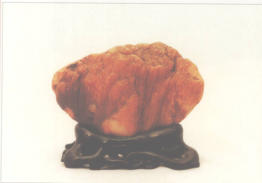
题名 万水千山总是情 石种 彩蜡石 藏者 谢荣耀 产地 潮州 规格 (15 × 10) cm