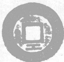
圖版二 永昌大順錢幣