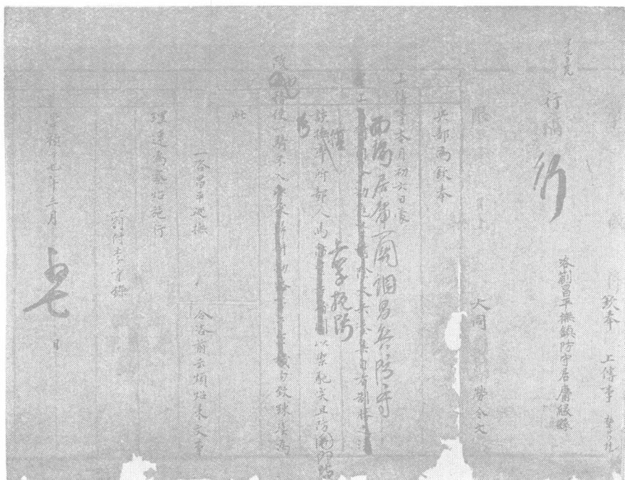
圖版五 明兵部行稿一