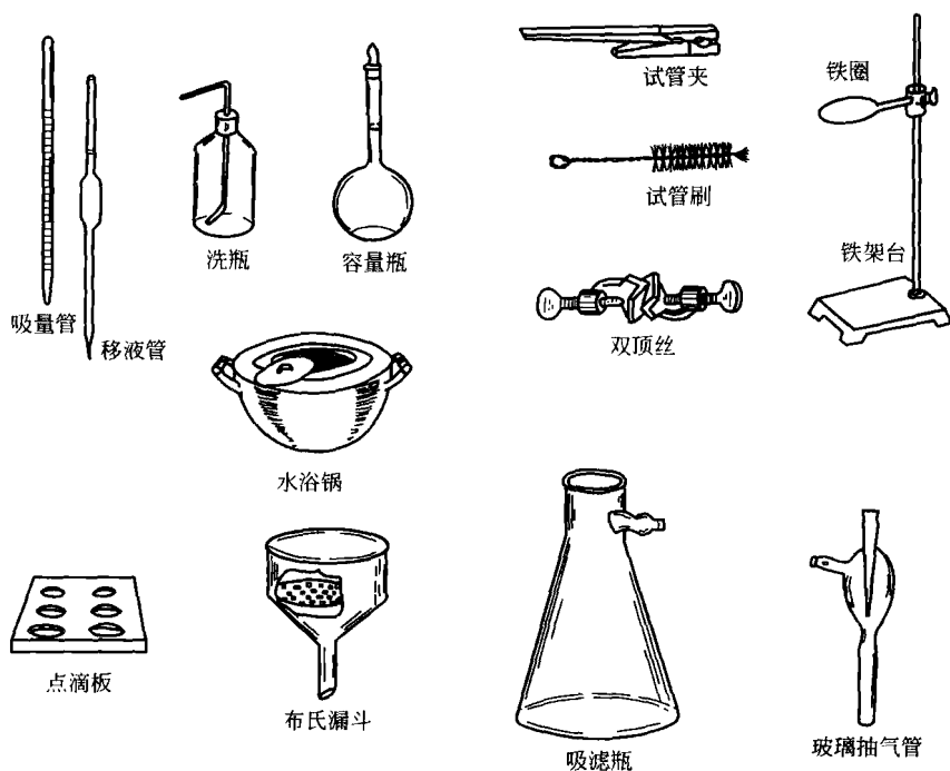
图 2-2 化学实验常用仪器 (二)