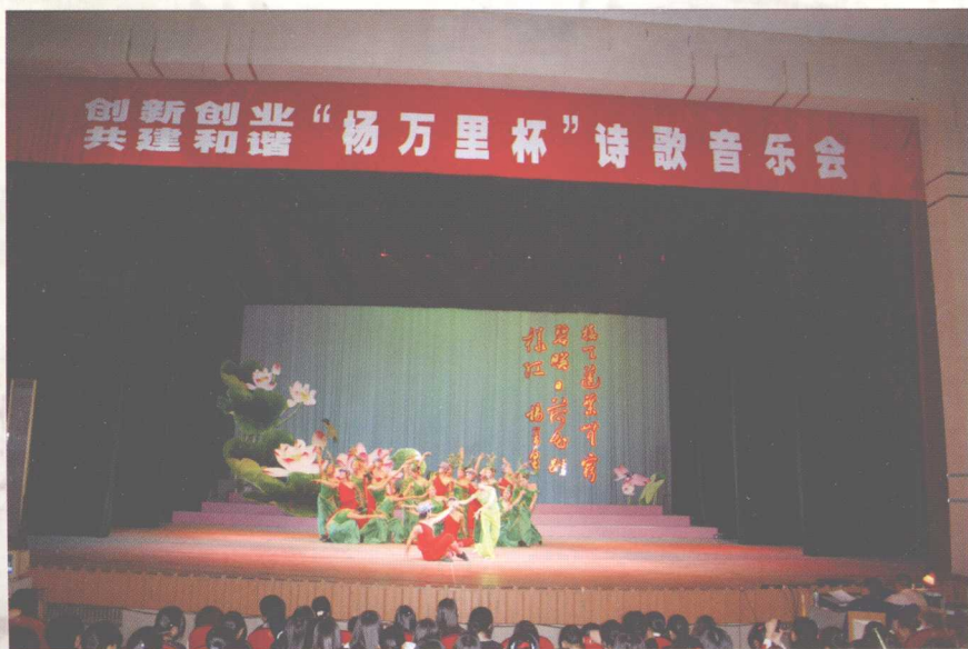
2007年4月26日，由中共吉安市委宣传部、中共吉水县委、吉水县人民政府联合主办的纪念杨万里诞辰880周年的诗歌音乐会在江西省吉安市举行。图为音乐会现场。