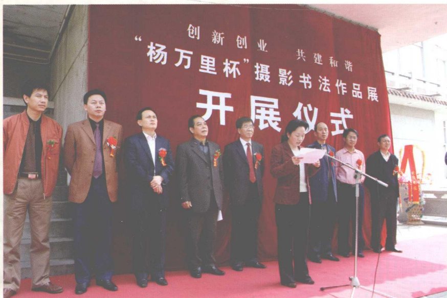
2007年4月26日，由中共吉安市委宣传部、吉安市文联、中共吉水县委、吉水县人民政府联合主办的纪念杨万里诞辰880周年摄影书法作品展在江西省吉安市举行。图为开展仪式。