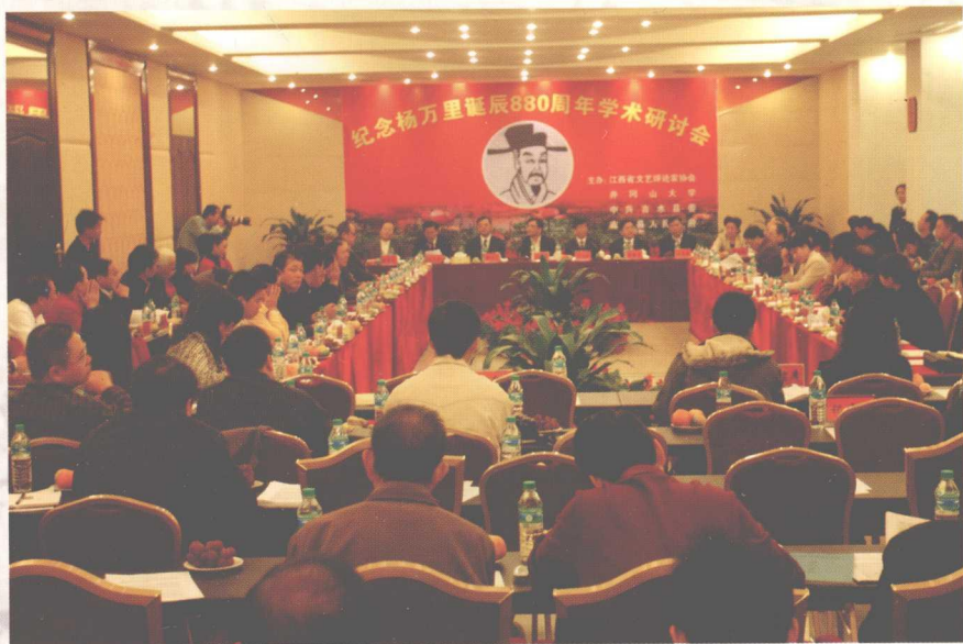
2007年10月30日，由中共吉水县委、吉水县人民政府、井冈山大学、江西文艺评论家协会联合主办的纪念杨万里诞辰880周年的学术研讨会在江西省吉水县城举行。图为研讨会会场。