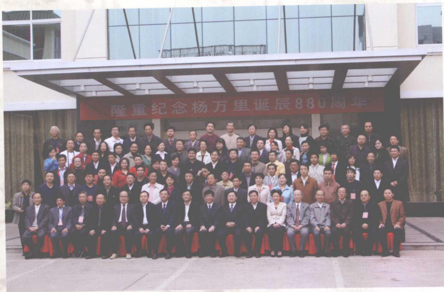
2007年10月30日，参加纪念杨万里诞辰880周年学术研讨会的专家学者和领导合影留念。