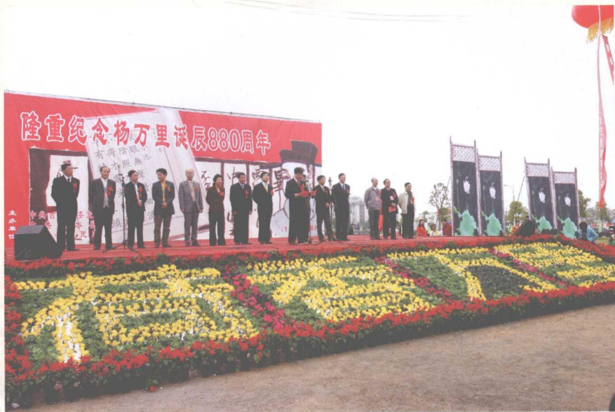
2007年10月31日，由中共吉水县委、吉水县人民政府、井冈山大学、江西文艺评论家协会联合主办的纪念杨万里诞辰880周年的纪念大会在江西省吉水县城举行。图为纪念大会主席台。