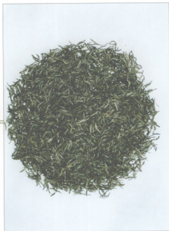
图 14 信阳毛尖