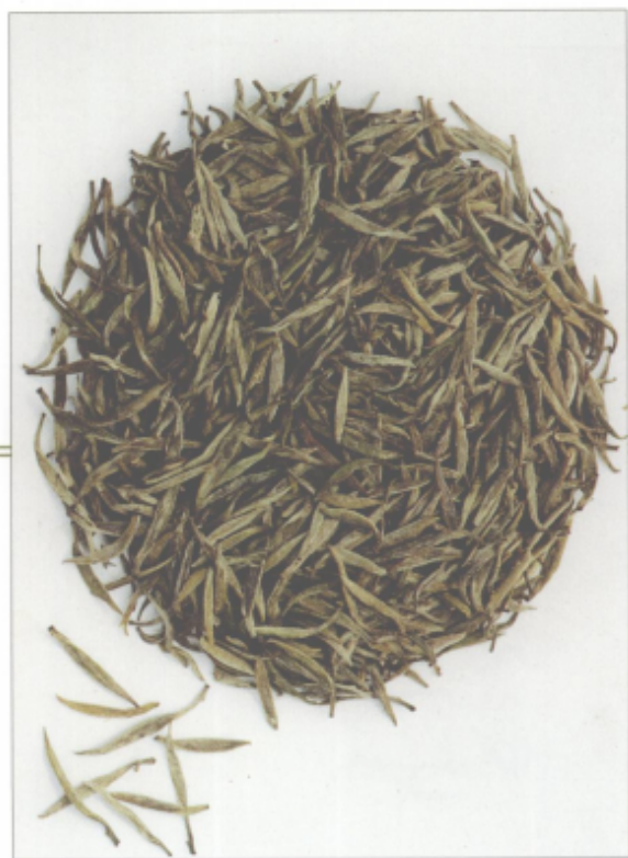
图 38 君山银针