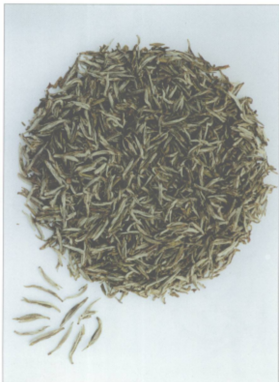
图 34 淳安毛尖