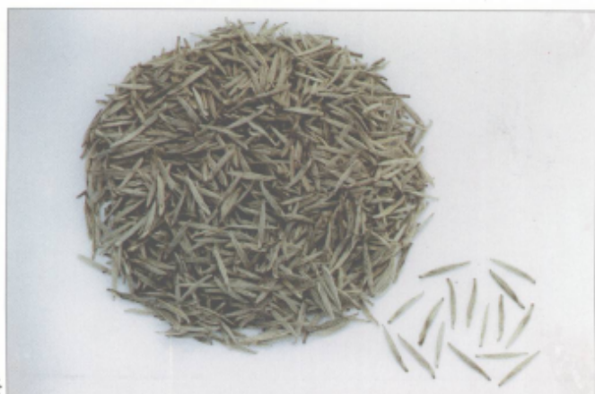
图 44 银针白毫