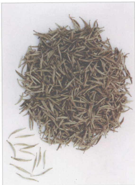
图 37 洞庭春