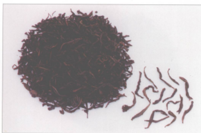
图 41 武夷水仙