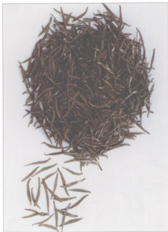
图 21 沙河桂茗