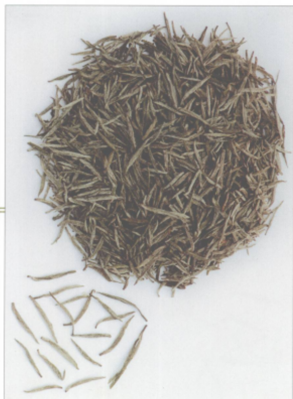
图 30 敬亭绿雪