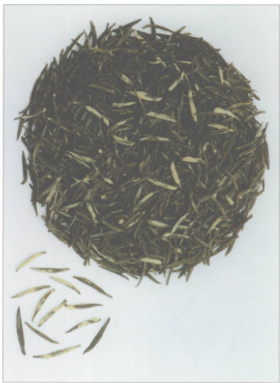
图 18 金坛雀舌