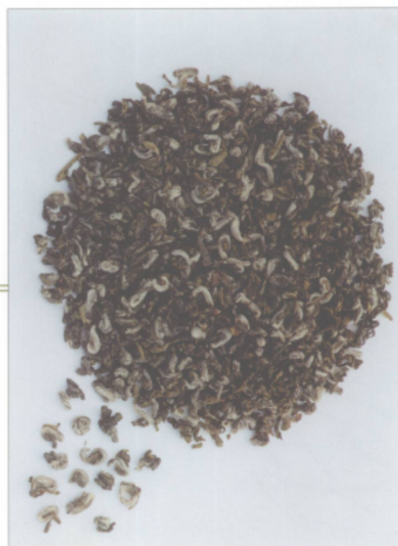
图 22 临海蟠毫