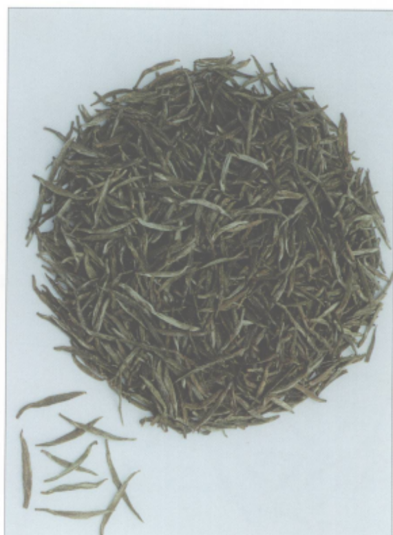
图 27 雪水云绿