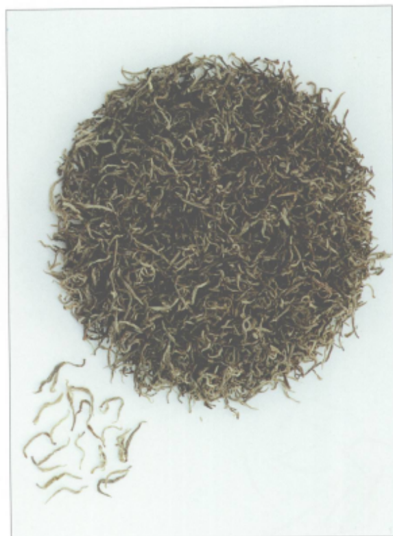
图 13 碣滩茶