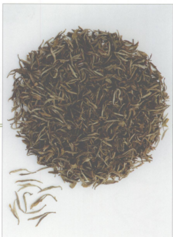
图 31 江山绿牡丹