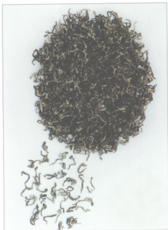
图 12 桂东玲珑茶