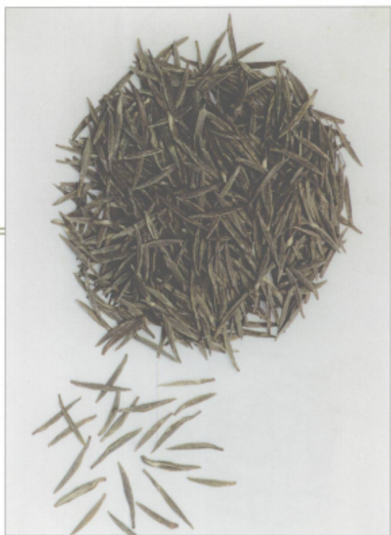
图 16 茅山青峰