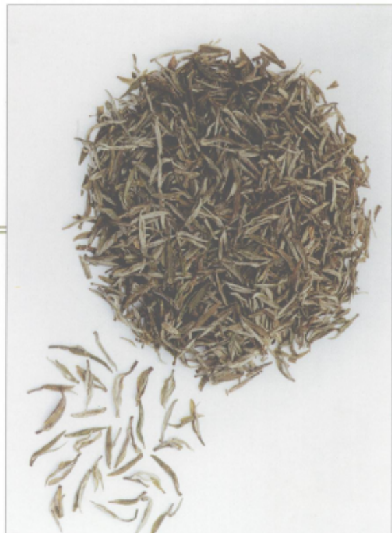
图 33 峡州碧峰