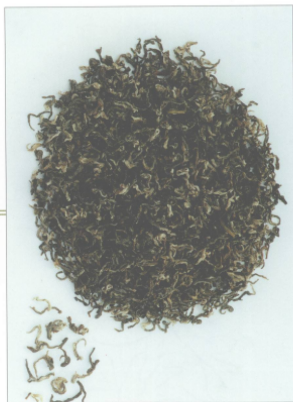
图 15 都匀毛尖