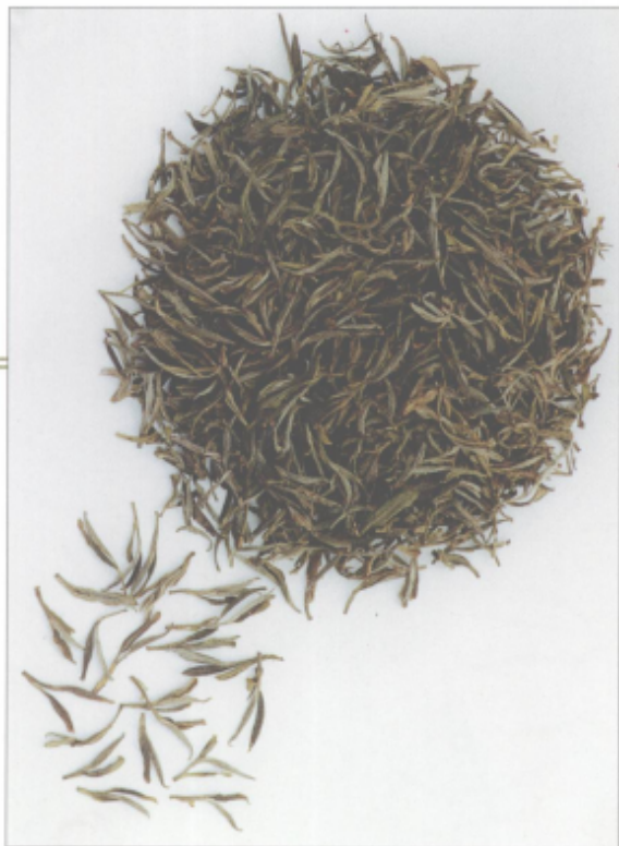
图 32 岳西翠兰