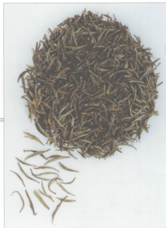
图 23 黄山毛峰