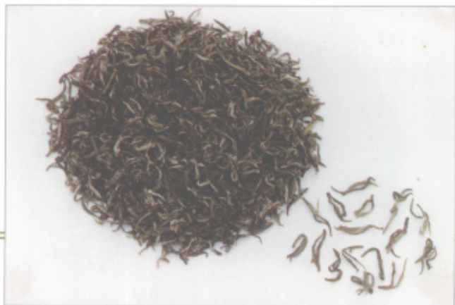
图 40 莫干黄芽