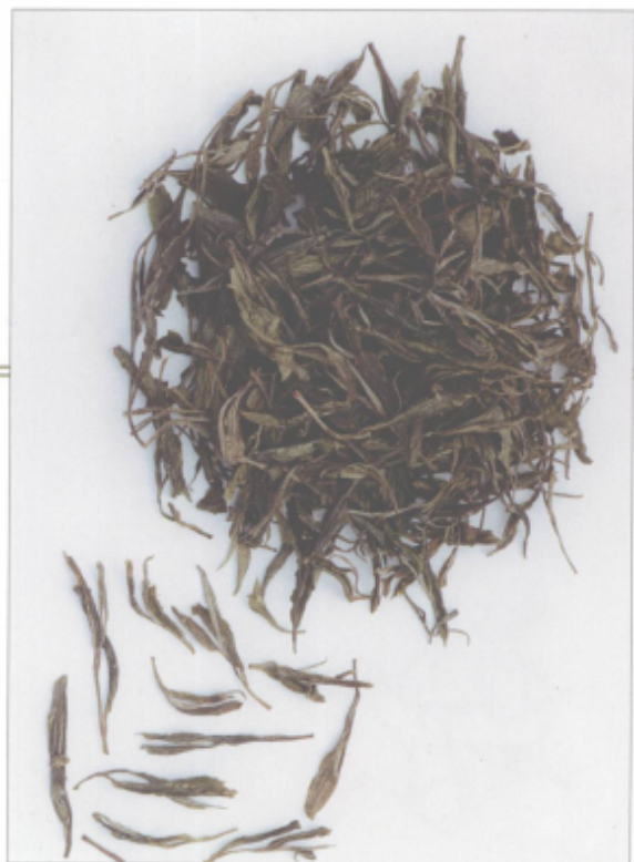
图 24 太平猴魁