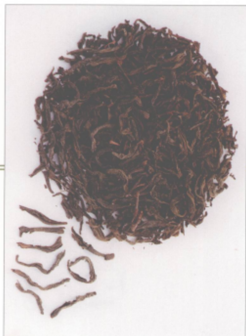
图 42 武夷奇种