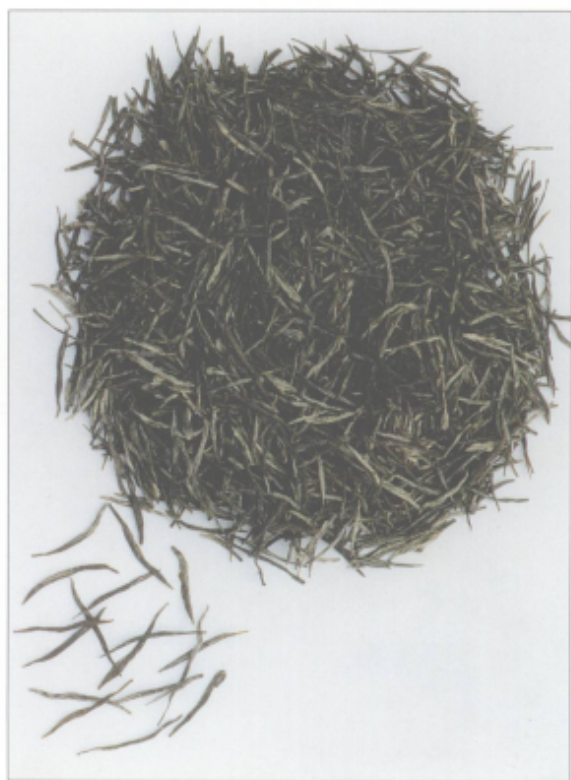
图 19 阳羡雪芽