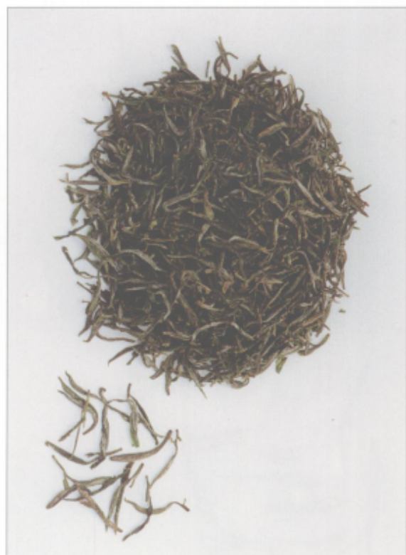
图 29 长兴紫笋