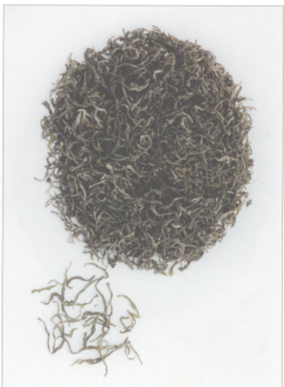
图 35 径山茶