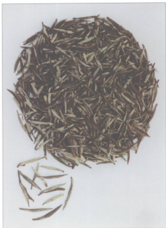
图 20 金山翠芽