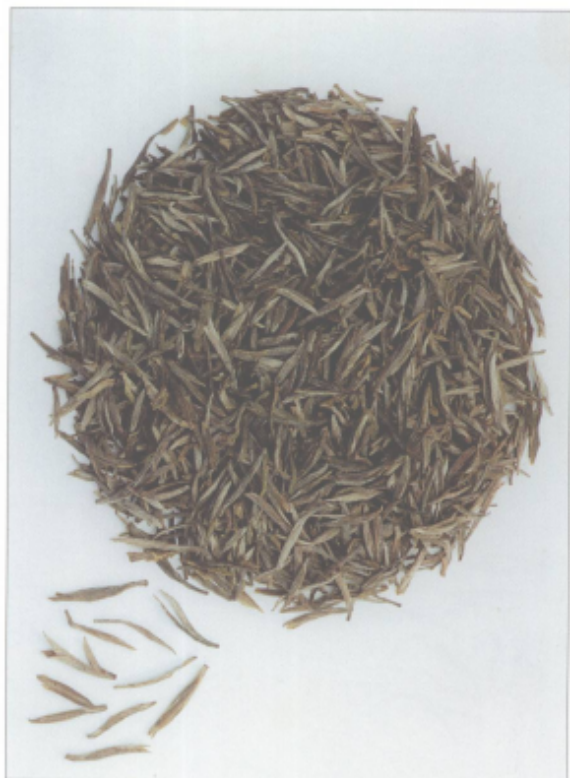
图 26 石览茶