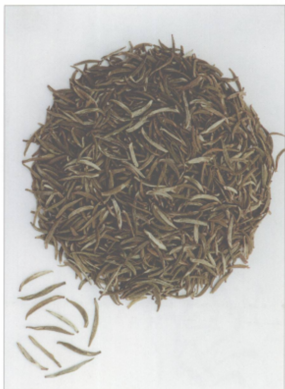
图 28 太湖翠竹