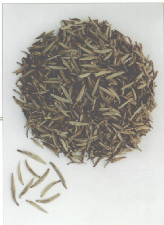
图 39 蒙顶黄芽