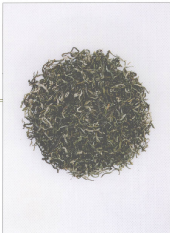
图 17 蒙顶甘露