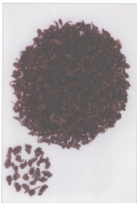
图 43 安溪铁观音