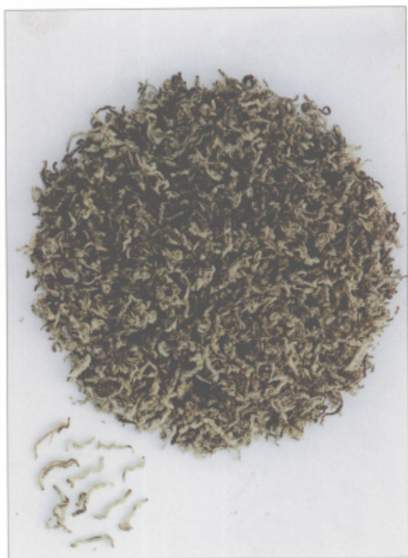
图 36 无锡毫茶