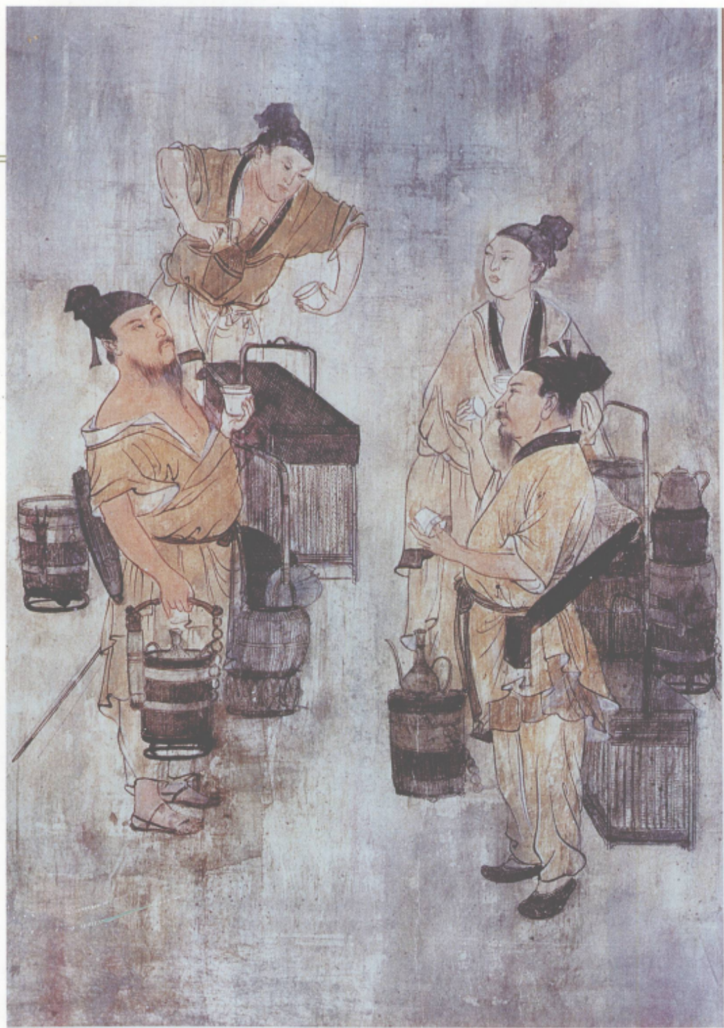
图3 《斗茶图》 (元·赵孟頫画)