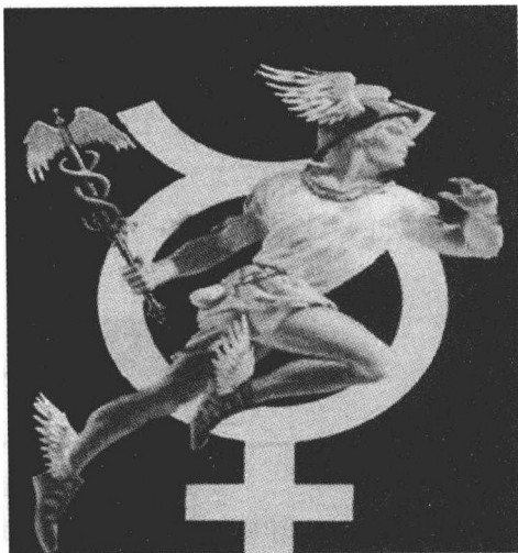
此时，罗马海盗乐意用墨丘利神 ① 的权杖来装饰自己的船帆 1-1

海上贸易一本万利，因此在各个时期都为海盗所注意。他们或者是单独行动，或者几条船配合行动，进攻运载大量珍贵物品的商船。当然，不论是希腊海盗、腓尼基海盗还是