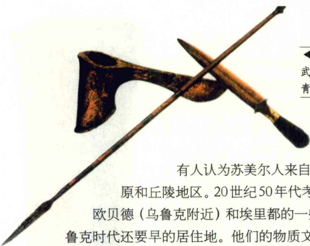
◀苏美尔人制造的武器，有黄金短剑、青铜戈和长矛。

有人认为苏美尔人来自两河流域北部的草原和丘陵地区。20世纪50年代考古学家在埃尔—欧贝德（乌鲁克附近）和埃里都的一些地方发现比乌鲁克时代还要早的居住地。他们的物质文化与乌鲁克所发现的苏美尔文化有不同之处。从政治与宗教方面看，欧贝德文化与乌鲁克的苏美尔文化似乎是一致的，但是在陶器方面却有显著的不同。欧贝德文化的陶器与两河流域北部草原地带所发现的古代文化遗物有很多相似的地方，并且它们显然是同出于一源的。