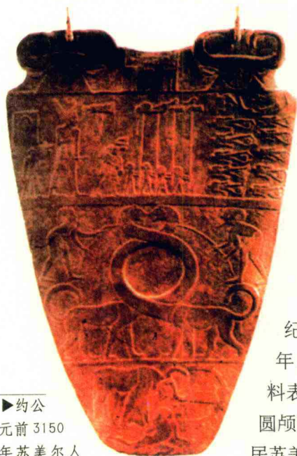
►约公元前3150年苏美尔人的雕刻作品，图案内容丰富多彩，造型奇特。