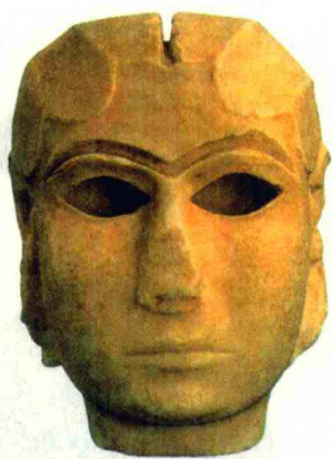
▲在乌鲁克出土的大理石女子头像，素有“美索不达米亚的维纳斯”之称。

特”的梯形塔。它看上去如同一层层叠放的砖面，每层都比底下的一层小，以此形成阶梯通向顶端的神殿。有的考古学家认为：这种梯形塔“就是一座山”，它暗示了苏美尔人一定是从多山地区移居过来的，因为造山的人不会生长在平原。到了平原之后，他们发现像家乡那样奉祀神明已不可能，所以在平原上用砖垒起人工的山，通往山顶的阶梯象征着他们曾经爬过的山路，而且苏美尔人的神与神庙的名称常与山岳有关联。