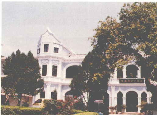
厦门集美镇陈嘉庚故居

作为南洋华侨众望所归的领袖，陈嘉庚领导南侨总会发动海外华人华侨同仇敌忾，募捐筹款，极大地支援了国内的抗战。仅从1937年至1943年通过银行途径的侨汇，就达55亿元，平均每年约8亿元，数额巨大。1940年3月，陈嘉庚组织南洋华侨回国慰劳视察团回国慰问，呼吁国共两党团结抗战。他顶着国民党的重重阻力和压力，来到延安与毛泽东会晤。他对抗日根据地干部廉洁奉公、军民团结抗战，热情称颂，断定“中国的希望在延安”。他回到南洋将归国见闻如实向华侨报告，鼓励他们继续出钱出力，多寄汇款支援祖国抗战。太平洋战争爆发后，他组织成立新加坡抗敌动员总会，动员华侨从各方面积极抗敌。他屡遭敌人迫害脱险后，各界人士在重庆举行“陈嘉庚安全庆祝大会”，毛泽东题赠“华侨旗帜，民族光辉”；周恩来及王若飞祝词称赞道：“为民族解放尽了最大努力，为团结抗战受尽无限苦辛，非言不能伤，威武不能屈，庆安全健在，再为民请命。”