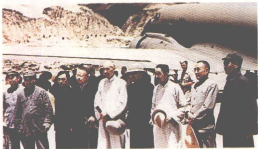
1945年，毛泽东、朱德、周恩来与黄炎培等6位国民参政会参政员在延安机场

事闲勿荒，事繁勿慌；有言必信，无欲则刚； 和若春风，肃若秋霜；取象于钱，外圆内方。 ——黄炎培