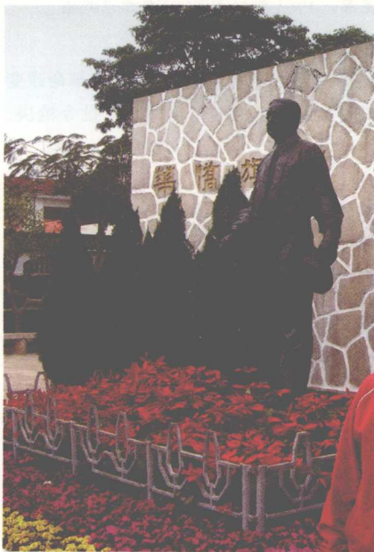
厦门陈嘉庚故居内的塑像

1910年，陈嘉庚在新加坡参加同盟会，募集巨款赞助孙中山革命活动。1924年在新加坡创办《南洋商报》，高举反日斗争旗帜。1928年济南惨案发生后，他任新加坡山东惨祸筹赈会会长，募捐救济受难家属，并号召华侨反对日寇侵略暴行。抗战全