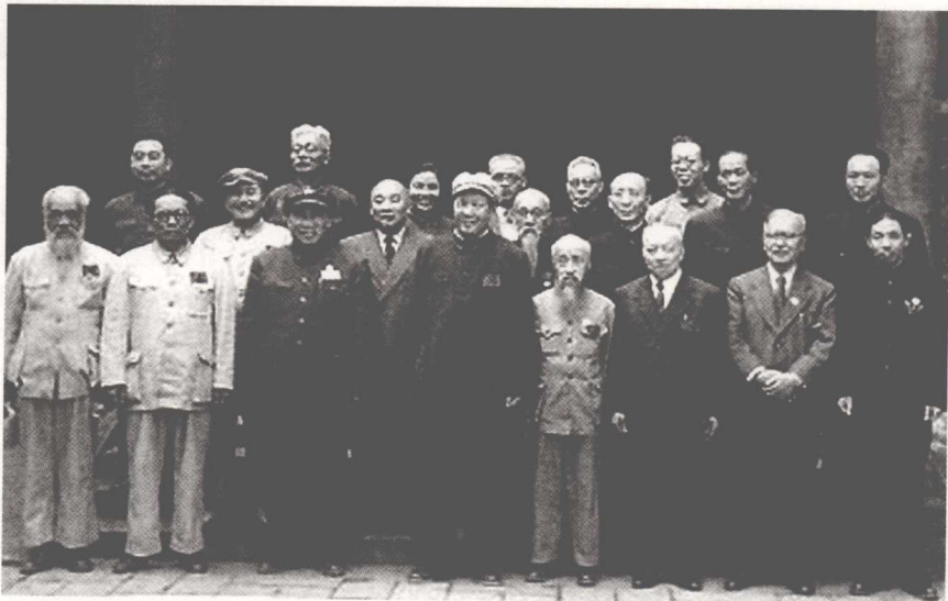
1949年7月5日，毛泽东和新政治协商会议筹备会常务委员合影，右起第四人为沈钧儒

1938年7月，沈钧儒代表救国会在武汉受聘为国民参政会参政员。1939年11月，他与黄炎培、章伯钧等人发起组织统一建国同志会，宣传和推进民主宪政运动。1941年3月，中国民主政团同盟成立，左舜生、张君勱等人认为沈钧儒与共产党关系密切，没有让他参加。直到1942年他才参加中国民主政团同盟。1944年9月，中国民主政团同盟改称中国民主同盟，沈钧儒被选为中央执行委员、常务委员。1945年冬，全国各界救国会改名中国人民救国会，他仍任主席，积极参加争取和平民主的斗争。有人骂民盟是“共产党的尾巴”，他当即反驳道：“尾巴有何不好！”1948年1月，他与章伯钧在香港召开民盟一届三中全会，提出了反蒋、反美的政治主张，声明与中国共产党密切合作。周恩来赞誉沈钧儒是“民主人士左派的旗帜”；董必武称他是“一切爱国知识分子的光辉榜样”。