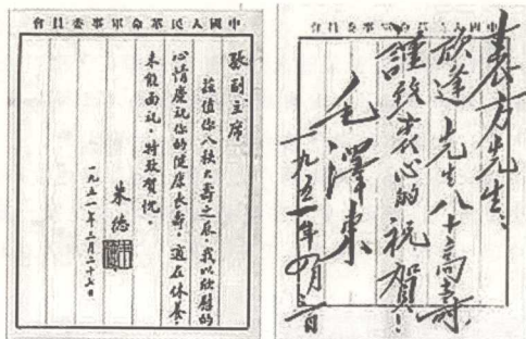
1951年3月、4月，毛泽东和朱德祝贺张澜八十大寿的贺信