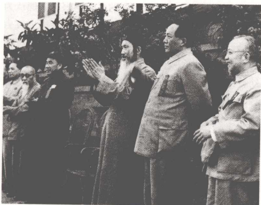
1951年7月1日，庆祝中国共产党成立30周年大会召开，各民主党派与会祝贺。右起第三人为张澜

1946年8月18日，张澜在民盟召开的李公朴、闻一多追悼会上愤怒斥责国民党特务的法西斯暴行，声泪俱下，遭到特务凶殴，头部被打伤。会后记者访问他时，他说：“为了反对发动内战，反对独裁专政，为争取国内和平民主团结而奋斗，个人流血算不了什么，我早已把个人生死置之度外。”11月中旬，国民党不顾全国人民的反对，悍然召开一手包办的伪国民大会，导致国共和谈的最后破裂。张澜明确表示：“我们民盟必须在政协决议全部实现后，才能参加国大，否则就失去了民盟的政治立场。希望大家万分慎重。”民盟拒绝参加伪国民大会。12月，张澜由重庆抵上海，再次阐明了民盟不参加伪国民大会的理由，强调和平、团结，反对内战、独裁，并号召扩大和平民主运动。