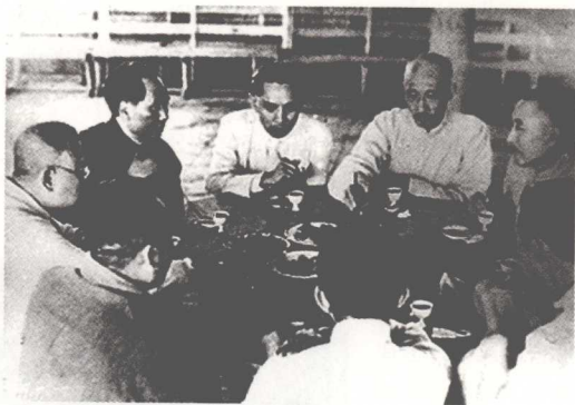
毛泽东在延安宴请黄炎培等友人

1932年，淞沪抗战期间，黄炎培与上海工商金融界上层人士一起组织了上海地方协会，他担任秘书长兼总务主任，负责支援十九路军抗战和维持地