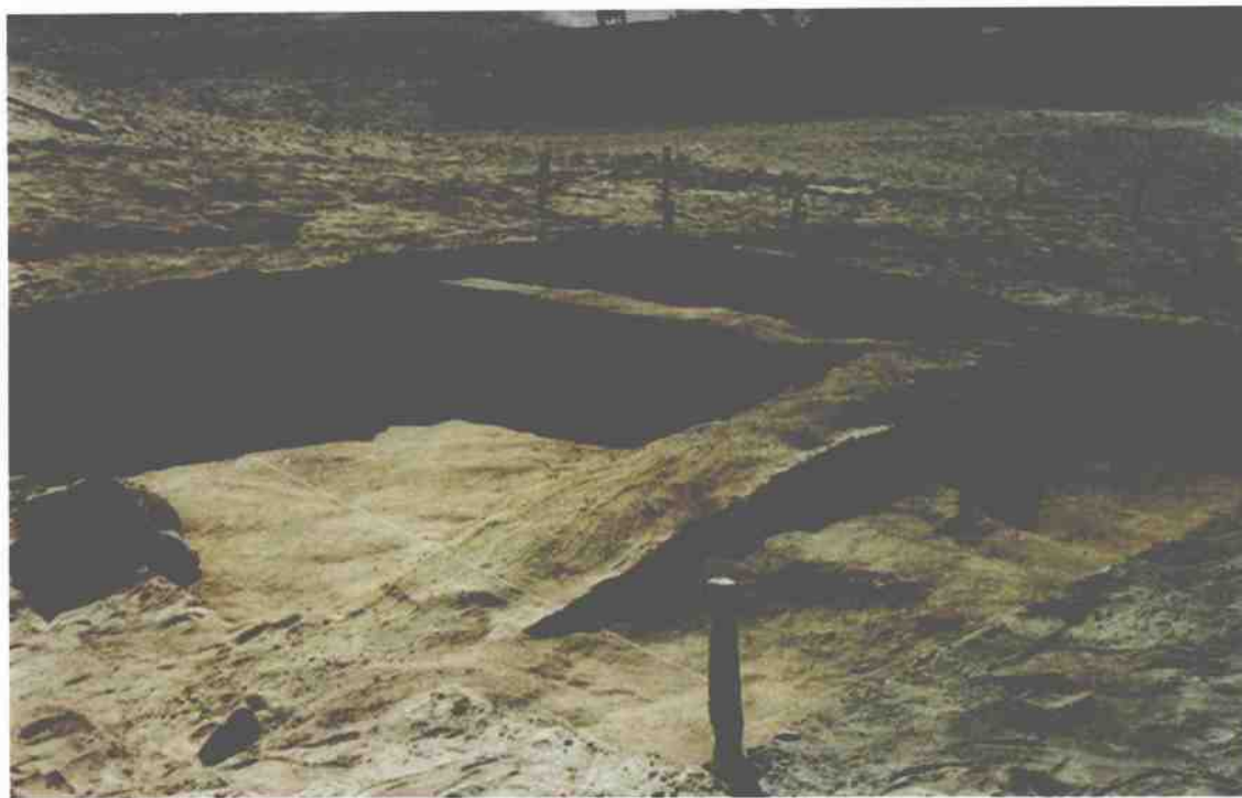
上圖：懸泉置遺址考古發掘現場