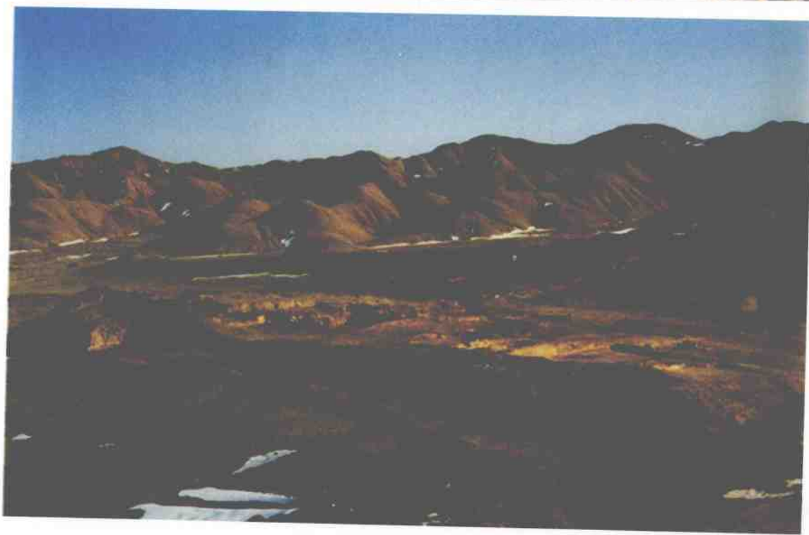
上圖：懸泉置遺址遠景