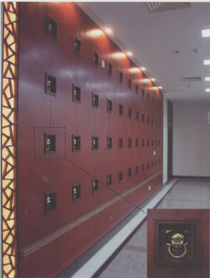
图 1.1.5 苏州昆剧院的走廊壁饰

综上所述,室内陈设设计是在室内设计整体创意下,进一步深入具体的设计工作,它是对室内设计创意的完善和深化。室内陈设设计的宗旨就是创造一种更加合理、舒适、美观的室内环境。