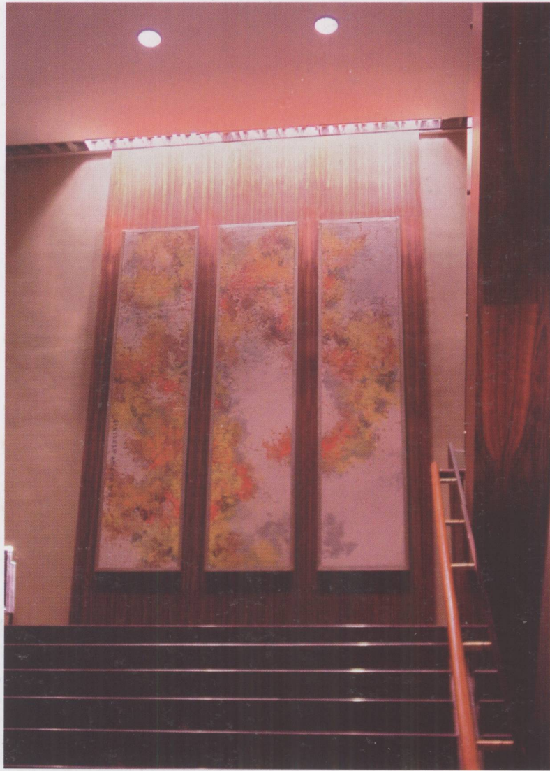
图 1.1.1 南京湖滨金陵饭店楼梯平台处的中式屏条