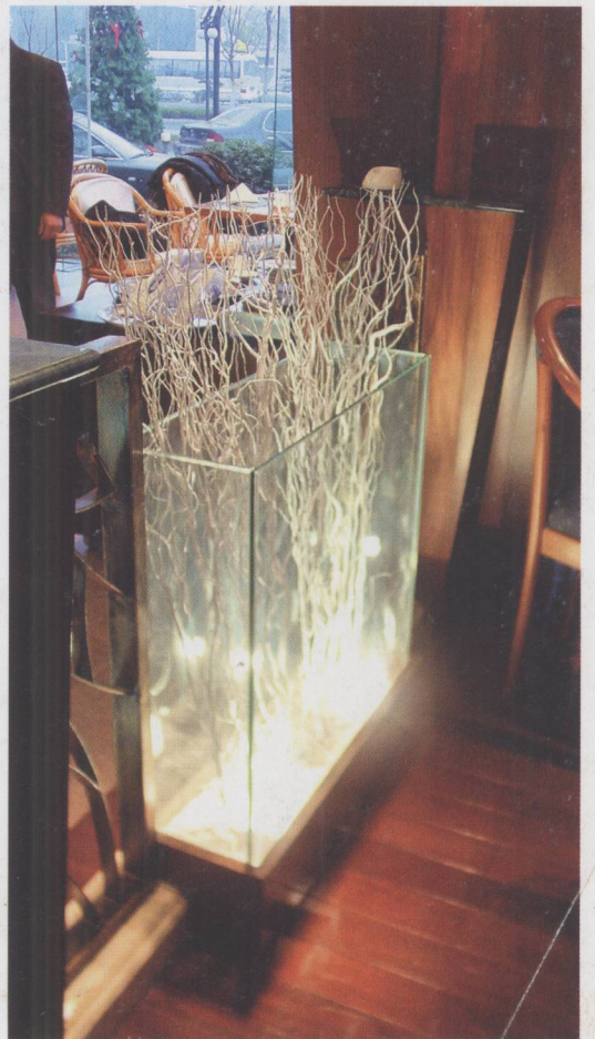
图 1.1.6 西餐厅中以干枝作陈设