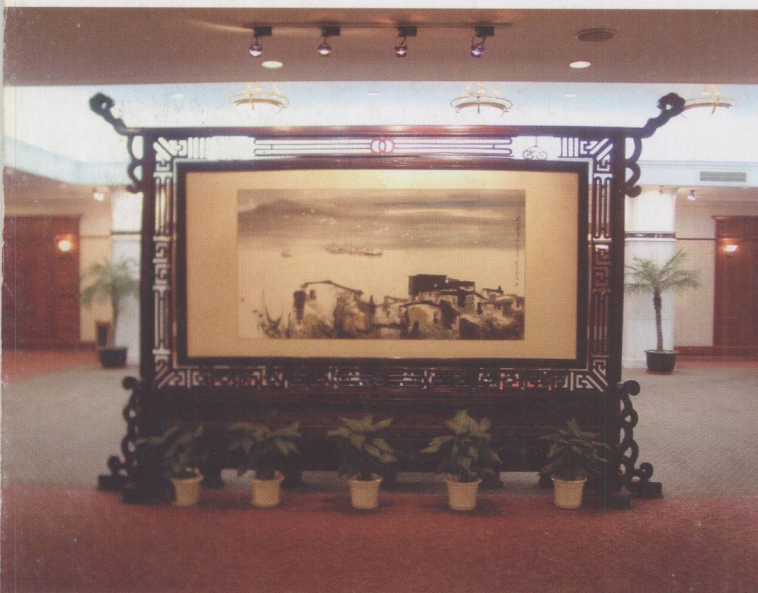
图 1.1.2 苏州会议中心宴会厅中的隔断