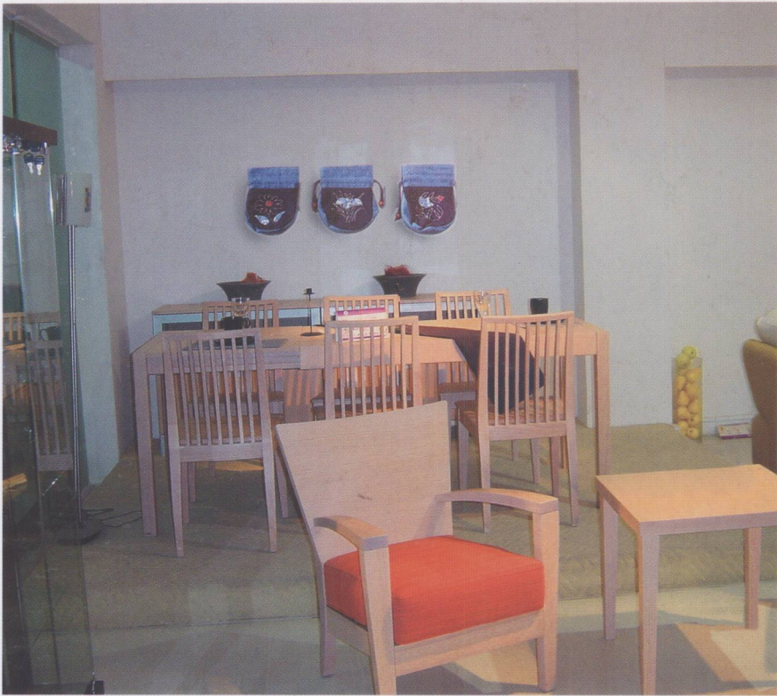
图 1.1.4 餐厅中的陈设