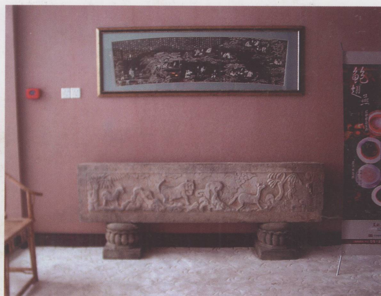
图 1.1.3 苏州锦绣天堂酒店过厅中用中国古代建筑构件作陈设