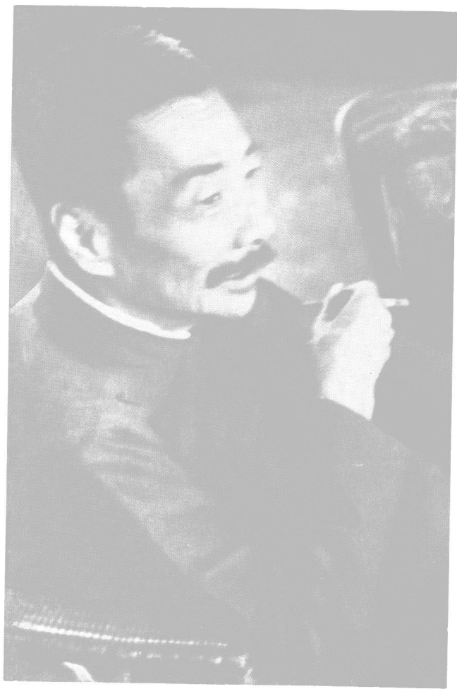
1936年攝于上海（最后遺照）