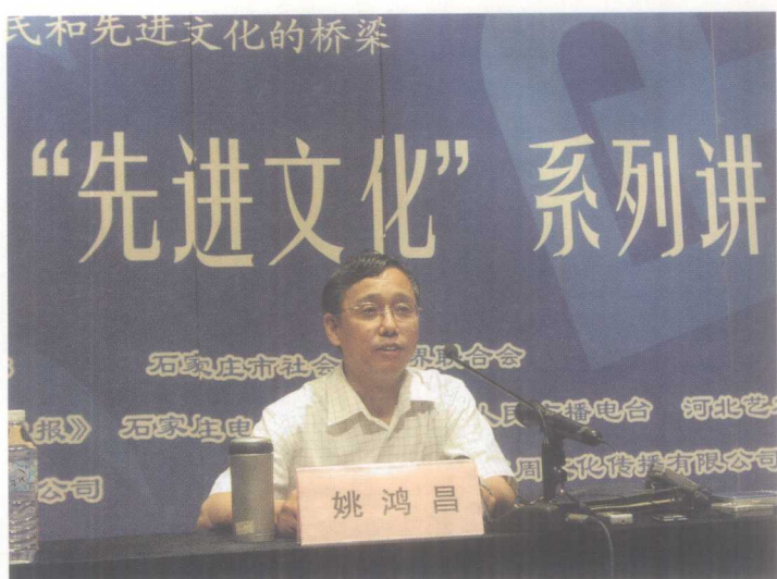
作者在石家庄市先进文化讲座中演讲