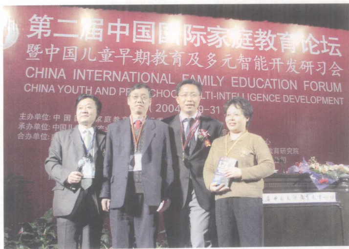
作者（左二）与疯狂英语创始人李阳（左三）合影