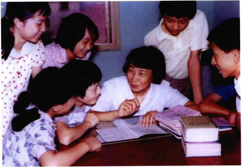
面批作文，师生交流