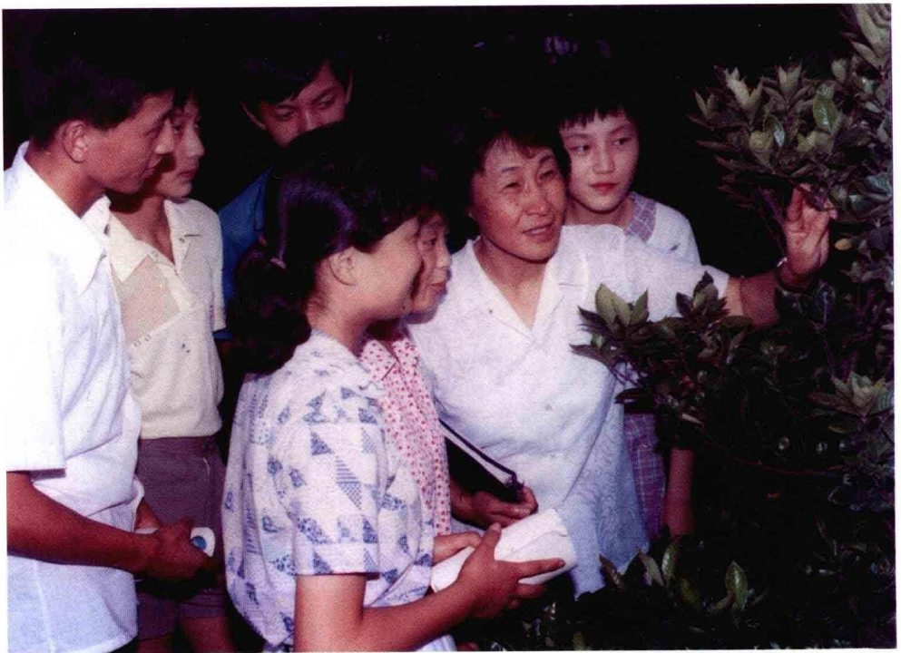
练就观察事物的敏锐目光