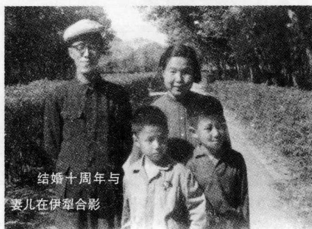
结婚十周年与 妻儿在伊犁合影