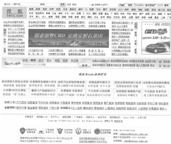
图 1.1 门户网站

在浏览器的地址栏上输入： http://www.sohu.com ，进入图 1.1 所示的搜狐网首页。