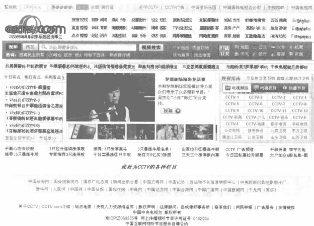
图 1.2 媒体信息服务类网站

在浏览器的地址栏上输入： http://www.cctv.com/ ，进入图 1.2 所示的央视网首页。