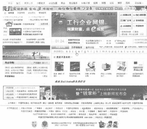
图 1.3 电子商务网站