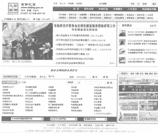
图 1.4 办公事务管理网站

在浏览器的地址栏上输入: http://www.beijing.gov.cn , 进入图 1.4 所示的网页。