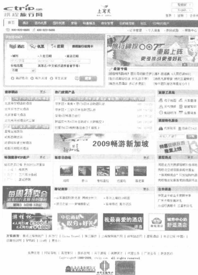
图 1.5 商务事务管理网站

携程旅行网属于商务事务管理网站。作为中国领先的在线旅行服务公司，携程旅行网成功整合了高科技产业与传统旅行业，向超过 2000 万会员提供集酒店预订、机票预订、度假预订、商旅管理、特约商户及旅游资讯在内的全方位旅行服务，被誉为互联网和传统旅游无缝结合的典范。它凭借稳定的业务发展和优异的盈利能力，于 2003 年 12 月在美国纳斯达克成功上市。