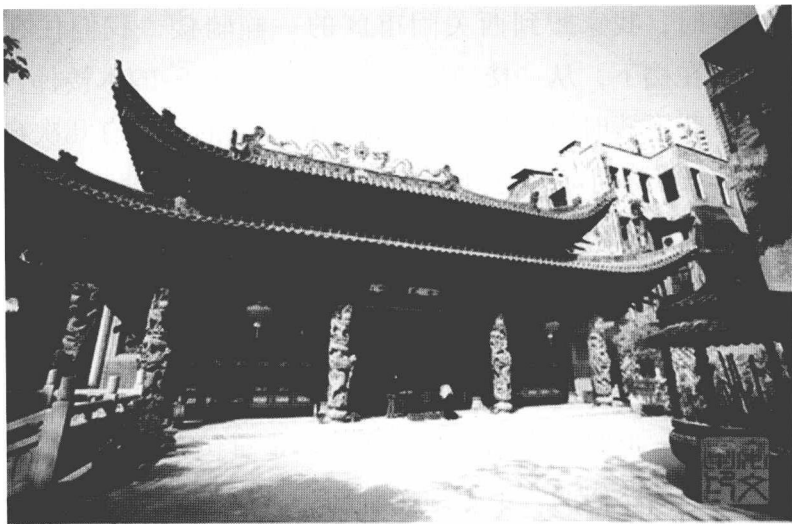
香火鼎盛的广州华林寺

与我们的楼相隔100米左右，就是广州闻名的华林寺。从我们家二楼就可以望到华林寺的后座，视线越过高高的围墙，可以看到郁郁苍苍的古树。