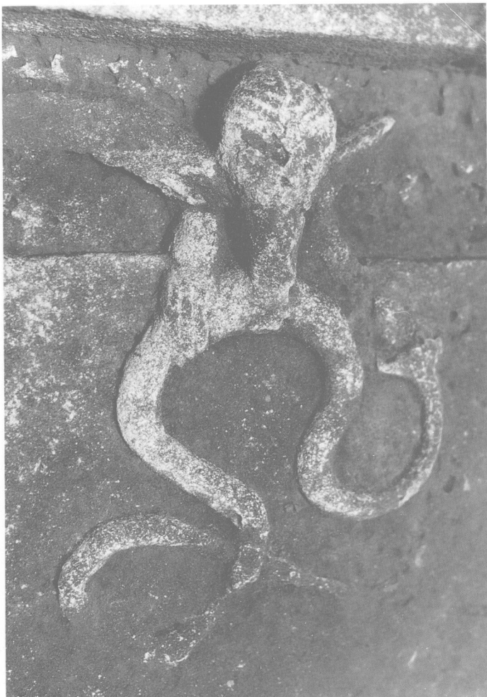
樂山麻濠東漢崖墓「尹武孫」墓門楣浮雕《金翅鳥含蛇圖》