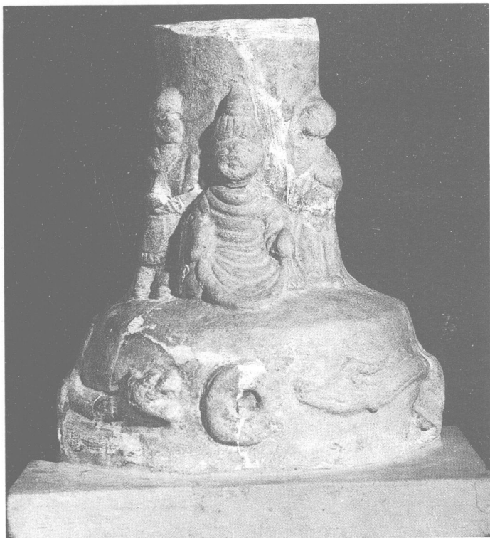
彭山東漢崖墓出土搖錢樹座

四川早在漢張騫出使西域之前已與印度相通，當時佛教文化有可能沿滇緬道輸入。相傳大邑霧中山開化寺為永平十六年（公元七三年）印度高僧葉摩騰與竺法蘭興建；西漢僧吳理真修活民之行，種茶蒙頂，歿化後刻石為像，其徒奉之為「甘露大師」；郫縣法定寺建於永平期間（公元五八——七五年），成都萬佛寺延熹（公元一五八——一六六年）時建，資中寧國寺建安五年（公元二〇〇年）建，嘉平四年（公元二五二年）建三台香林寺等；蜀《首楞嚴》二卷、蜀《普曜經》二卷譯於三國時，樂山東漢「尹武孫」崖墓門楣上雕刻有大鵬金翅鳥含蛇圖，具有佛像特徵的青銅像早在蘆山縣漢墓中出土，石刻造像三尊分別雕刻在樂山麻濠和柿子灣東漢崖墓明堂的門楣上，在彭山東漢崖墓中出土的搖錢樹座上還浮雕有一佛二菩薩的形象。以上有關佛教建寺、譯經以及造像實例，可以證明佛教在東漢時已在四川民間流行。