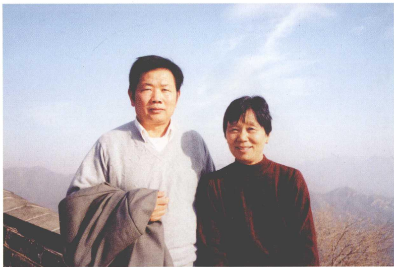
2003 年与老伴在长城上