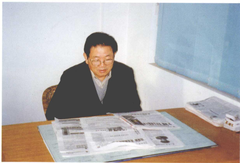
1994年于教研室办公室为论文查找资料