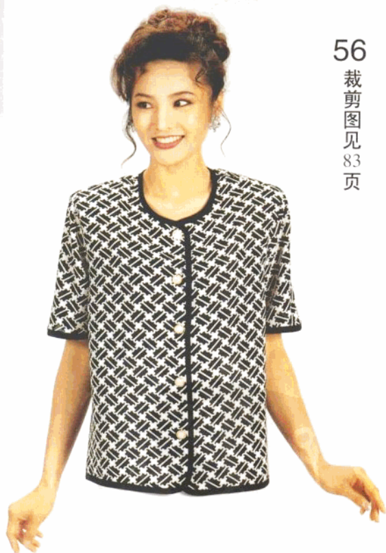
56 裁剪图见 83 页