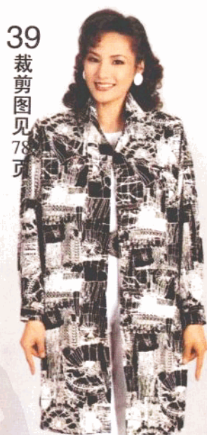
39 裁剪图见 78页