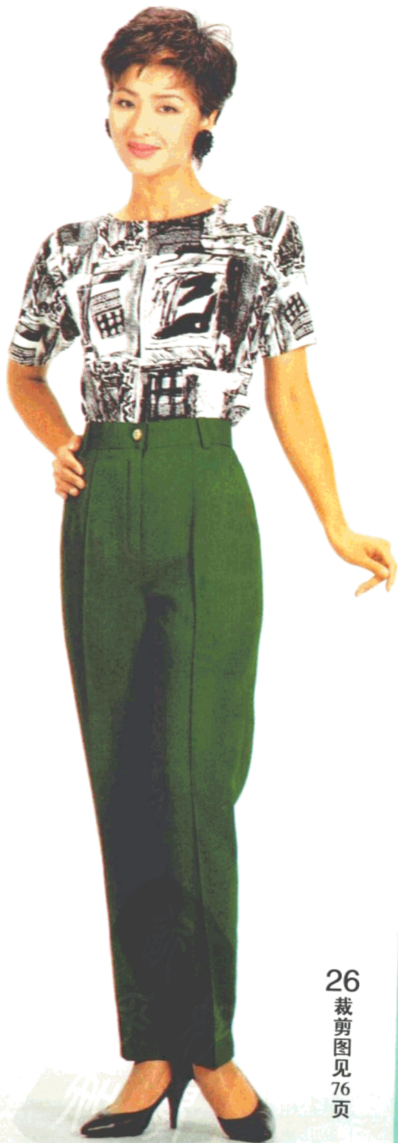
26 裁剪图见 76页