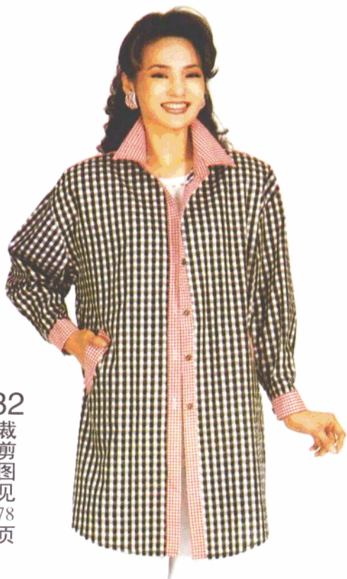
32 裁剪图见 78 页