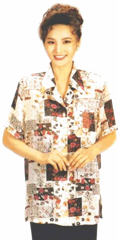
54 裁剪图见 83 页