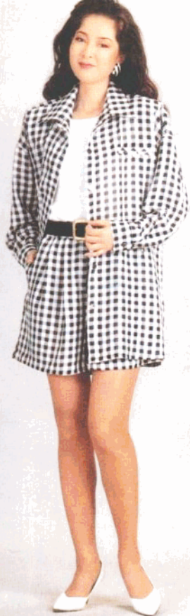
36 裁剪图见 78页