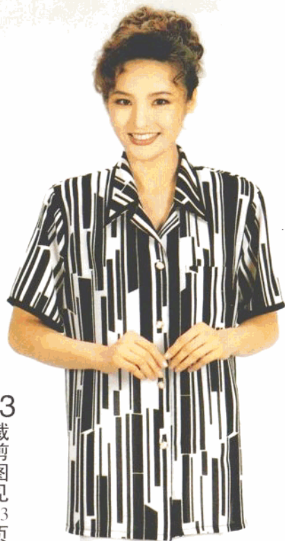
53 裁剪图见 83 页