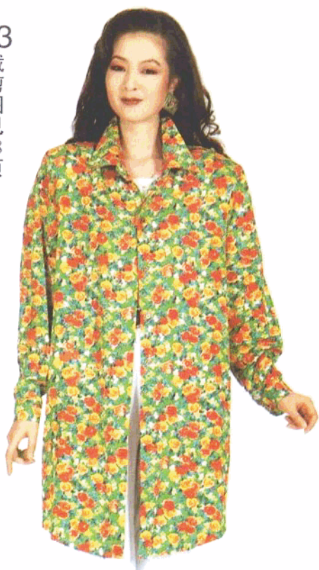
33 裁剪图见 78 页