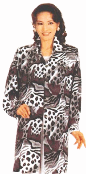
38 裁剪图见 78页