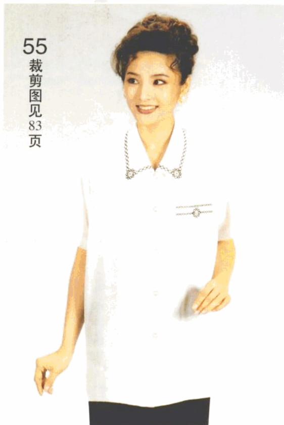
55 裁剪图见 83 页