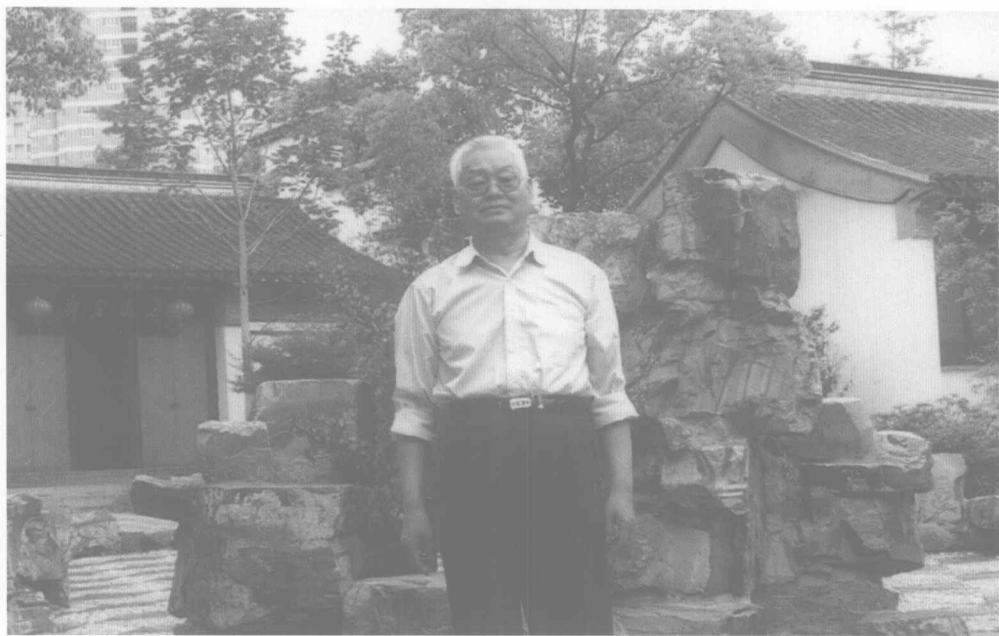
2005年作者在无锡东林书院