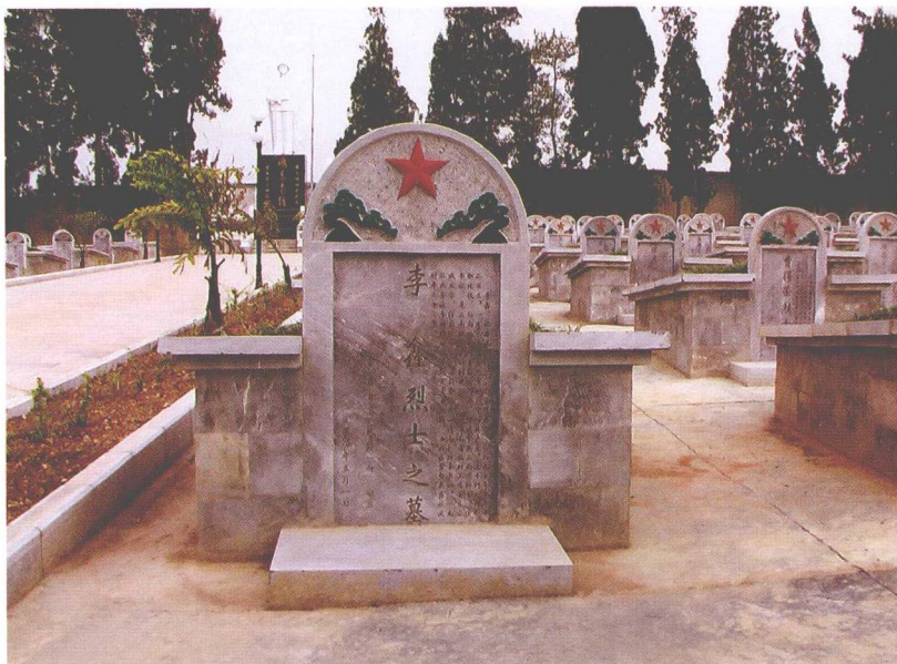
1979年迁葬于蒙自烈士陵园内的李鑫墓

李鑫牺牲后，遗体由张国才收葬。1957年4月22日，有关部门在张国才帮助下，寻找到了李鑫的坟墓。