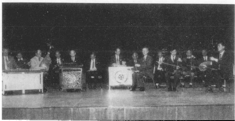
1980年成立的泰京叶韵儒乐社

风乐社、惠来县潮乐学社等；潮州市的老干局潮乐队、潮州市音协潮乐队、庵埠民间音乐团、彩塘仙乐陶情乐社、彩塘潮乐联谊会、凤塘大锣鼓队、金石潮乐社、江东潮乐社等。潮汕大地大小乐社、乐点有几百个，其他国内外的乐社、乐点也有百余个。例如，广东省有深圳市潮乐社、龙岗区布吉民间音乐协会、横岗潮乐社、公民潮乐社，广州市广东海外潮人联谊会潮乐社，珠海市海外潮人联谊会潮乐社，肇庆市潮乐社等。海南省有南岛潮乐社等。上海市有潮州国乐社等十多个社团。香港有官塘潮乐社等十多个社团、乐点。台湾有潮声国乐社等十多个社团。泰国有潮州会馆国乐股、德教会紫太阁潮乐团等十多个社团。美国、法国、澳大利亚、新加坡、马来西亚、越南、老挝、柬埔寨