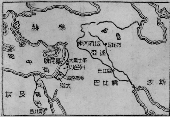
古代亞非國家位置圖

古埃及人稱他們的王做法老，許多貴族官員幫助法老統治全國，壓迫着農民和奴隸。在尼羅河的下游，至今還聳立着七十多個尖塔，這是古埃及的法老們替自己建築的陵墓。因為形狀尖方好像一個金字，我們把它叫做金字塔。其中最大的一座，高一百四十六公尺，底邊每面長二百三十公尺，周圍約一公里，全用巨大石塊砌成。它是前二八〇〇年的建築物。據說當時的法老齊阿普司驅使全國人民去輪流做工，編成十萬人一隊，每期做工三月，歷時三十年才完成。藏在塔裏面的法老尸體，塗抹着貴重的香料，叫做「木乃伊」，可以經久不壞。在塔的四壁上畫着奴隸和牛羊的圖畫，並寫着象形文字。這種文字在五千年前的埃及人已知道使用，常寫在一種狀似蘆葦的植物——叫做紙草的莖片上面，法老的棺木裏也常常發現這