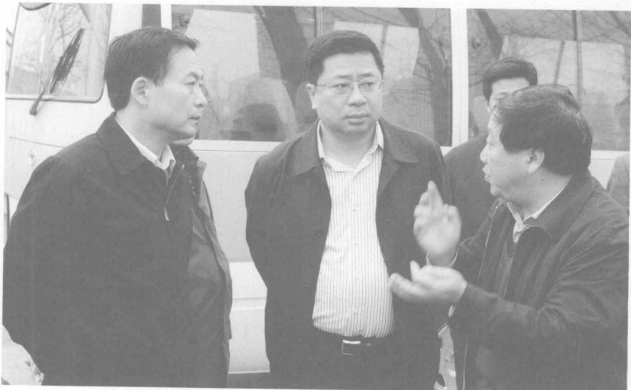
◎长治市人民政府市长张保（中）在基层调研