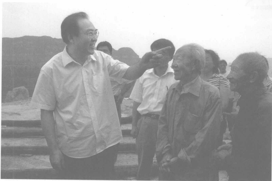
◎中共长治市委书记杜善学（左一）在农村调研