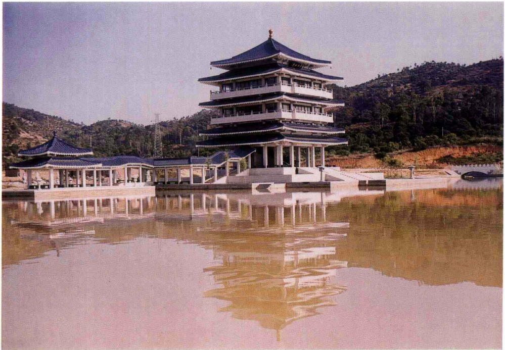
将军山公园归德楼全景