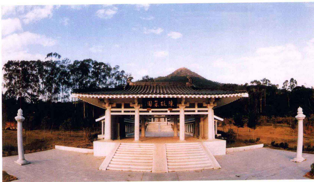
原中共中央政治局委员、中央军委副主席、国务委员兼国防部长迟浩田上将为将军山公园历史文化区陈政墓园题匾