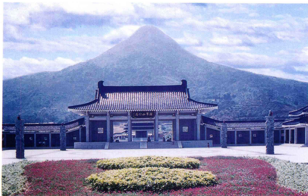
原中共中央政治局常委、中央军委副主席刘华清上将为将军山公园题匾