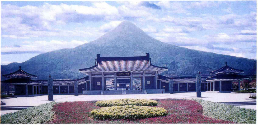
将军山公园东大门全景