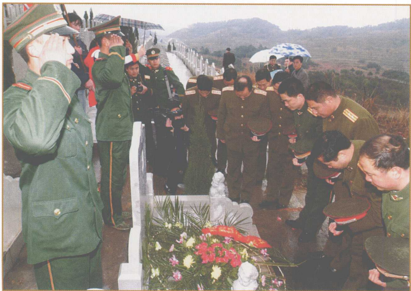
驻黄勇家乡部队和武警的官兵们为黄勇烈士扫墓