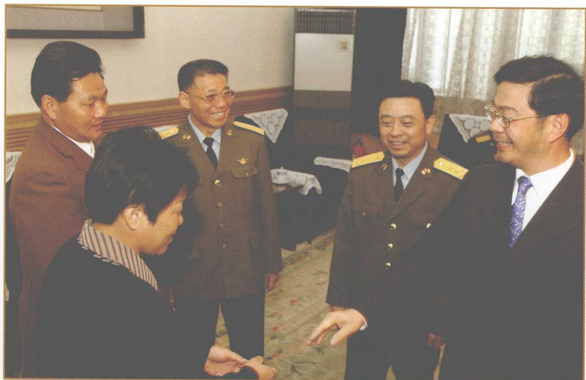
空军乔司令员、邓政委和共青团中央第一书记周强接见黄勇烈士父母