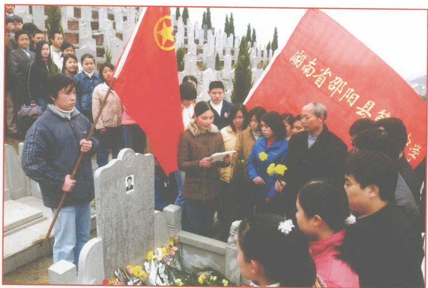
2004年新学年开学的第一天，黄勇生前所在学校——湖南省邵阳县第三中学师生来到黄勇烈士墓前敬献鲜花祭奠英灵