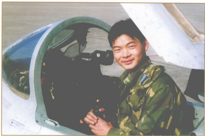
黄勇烈士与生前维护的战鹰