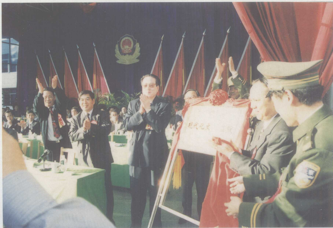
广东省第一个部级现代化文明监狱——广东省东莞监狱。图为现代化文明监狱授牌仪式。