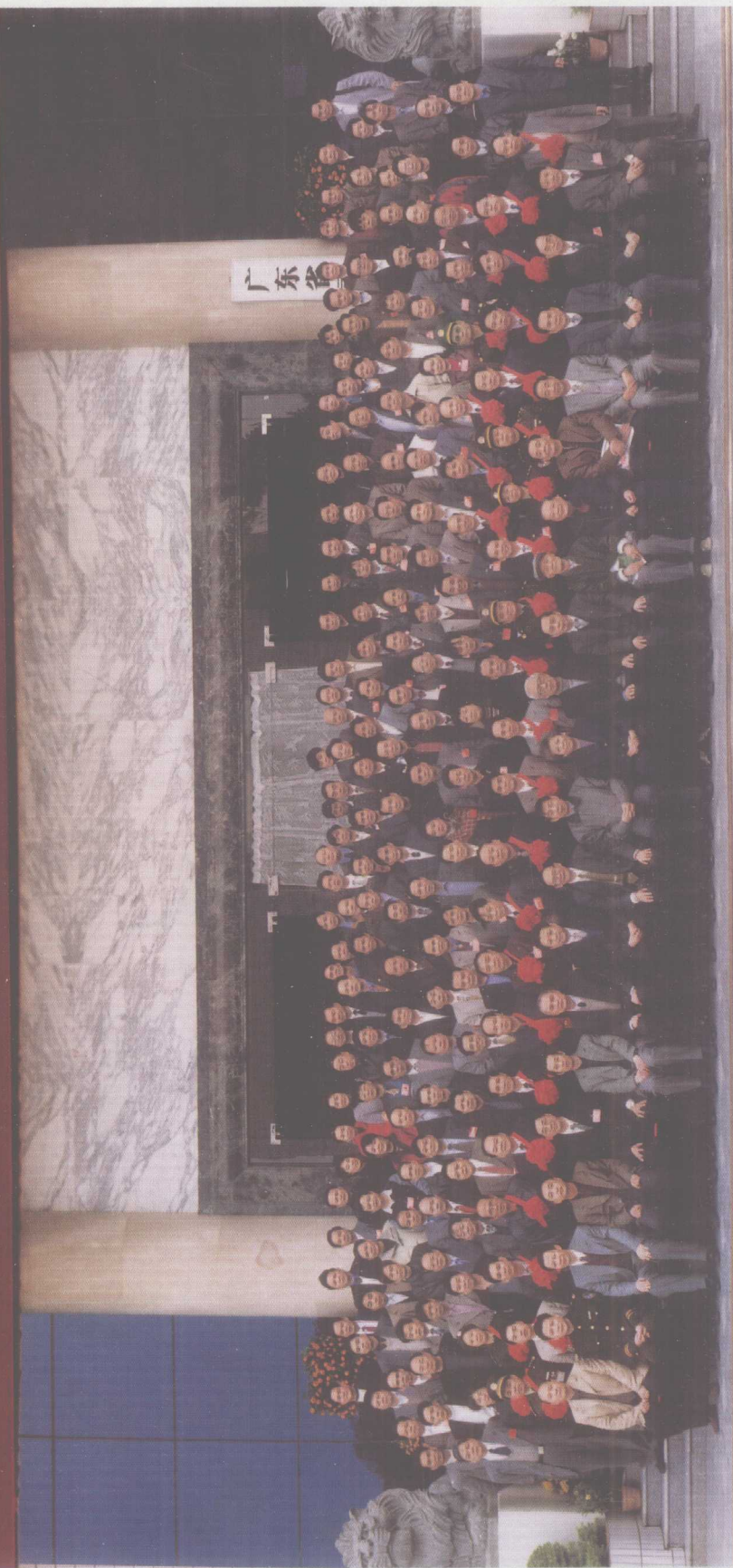
2002年2月24—25日，广东司法行政重建二十周年暨全省司法局长会议在广州召开。