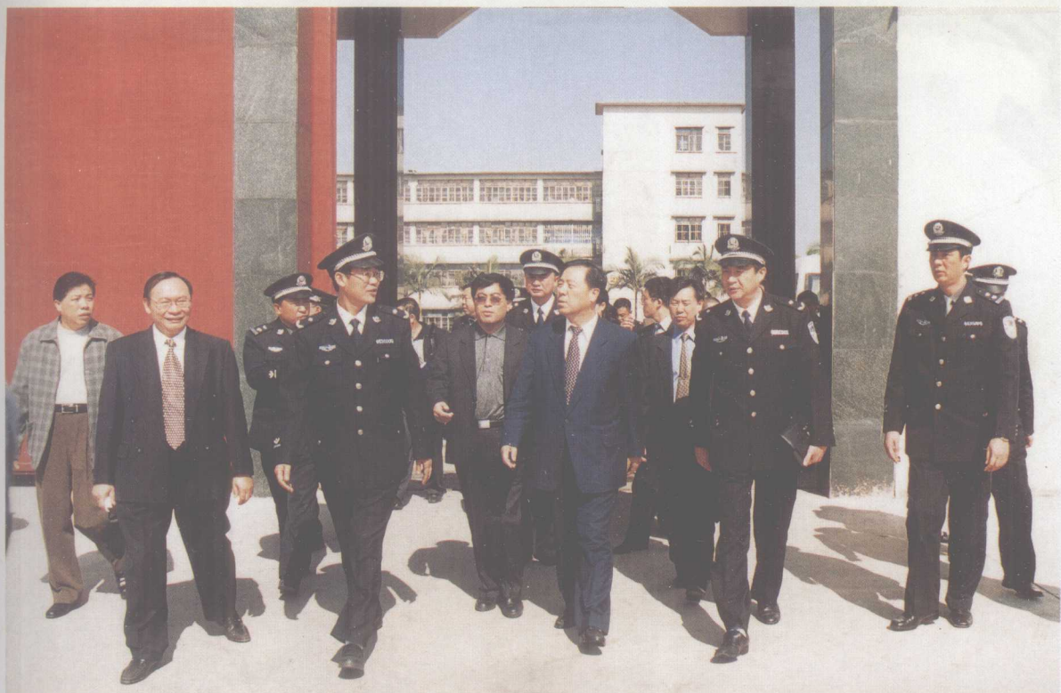
2001年8月,司法部长张福森到广东视察。图为张福森部长(前中)视察广东省四会监狱。