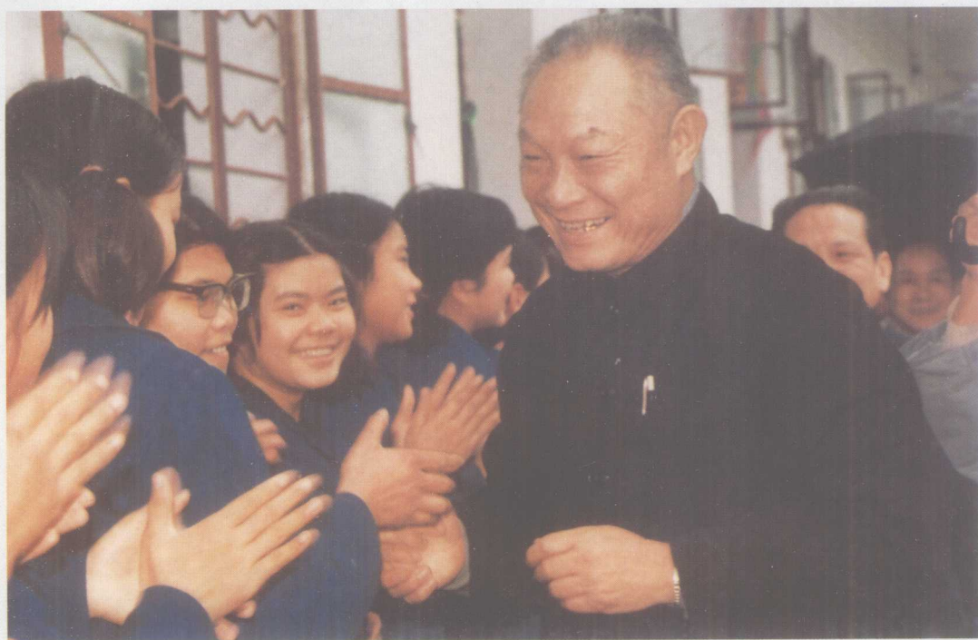
1985年春节期间,广东省人大常委会主任罗天(前右一)在省司法厅厅长曾洪陪同下到少管所慰问警察和看望少年犯。