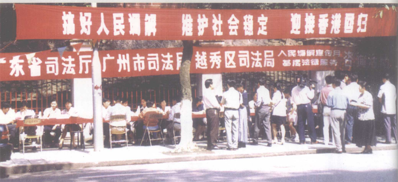
广东省司法厅和广州市司法局联合举办 人民调解宣传月、基层法律服务咨询活动。