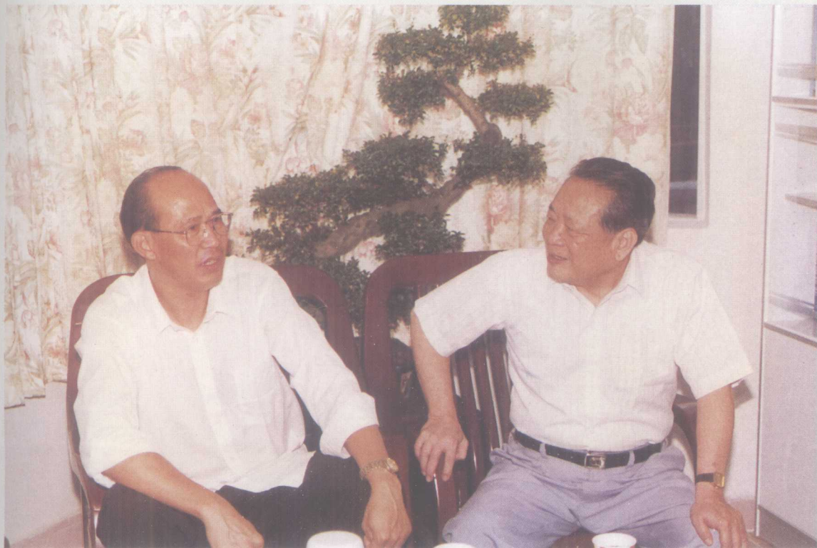
曾洪,1983年8月至1992年11月任广东省司法厅厅长。 图为曾洪厅长(右)到基层开展调研工作。