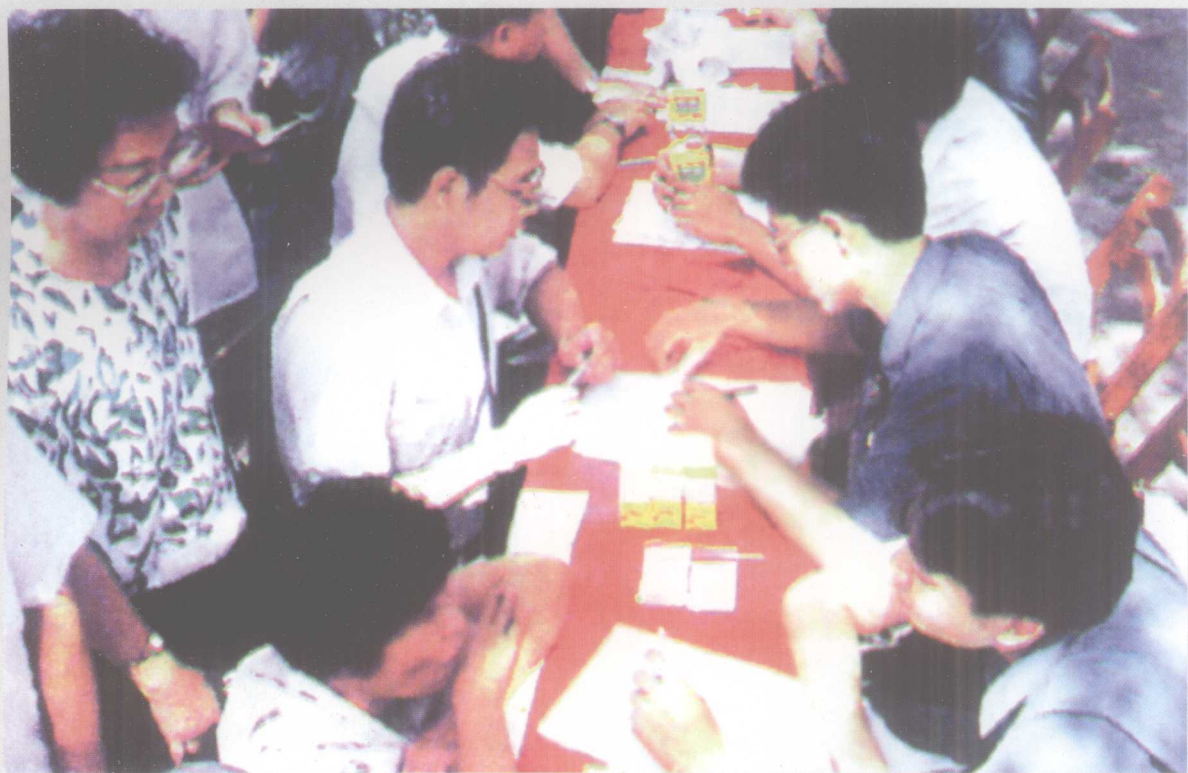
广东各地司法行政机关的干部和人民调解 组织的成员纷纷走上街头,向人民群众宣传。