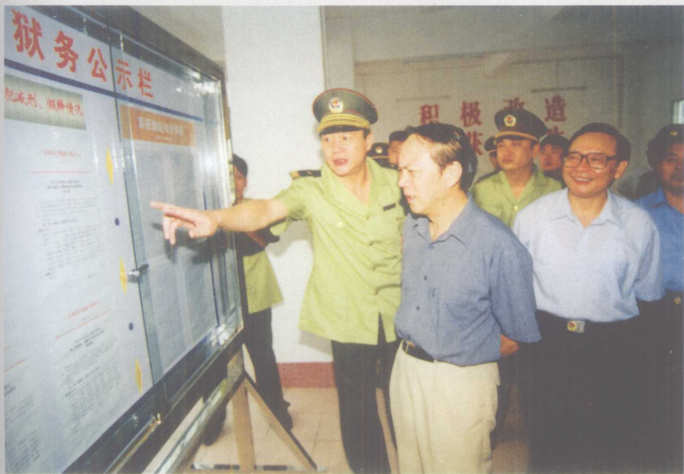
2000年8月18日,广东省委副书记、政法委书记陈绍基(中)视察广东省北江监狱和广东省武江监狱,要求全省监狱系统积极开展狱务公开工作。