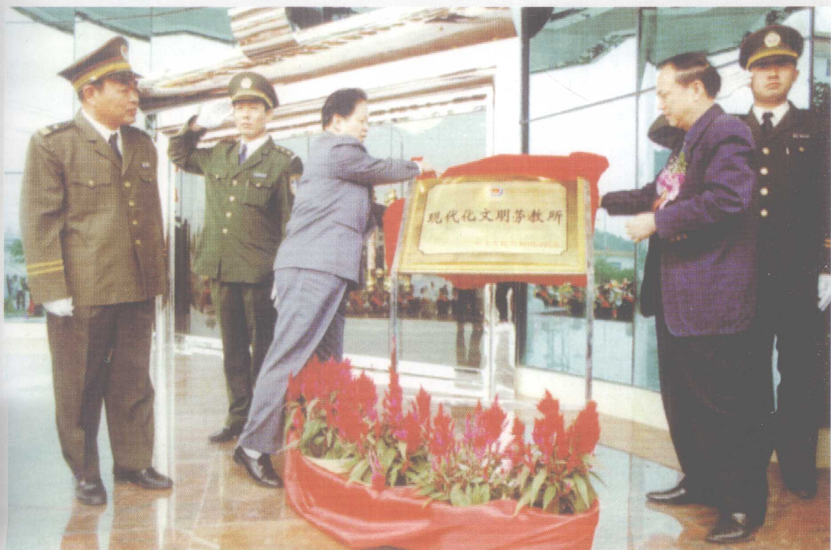
1996年11月20日,司法部长肖扬(左三)、广东省委副书记、政法委书记陈绍基(右二)为被司法部授予“部级现代化文明劳教所”称号的深圳市第一劳教所揭牌。