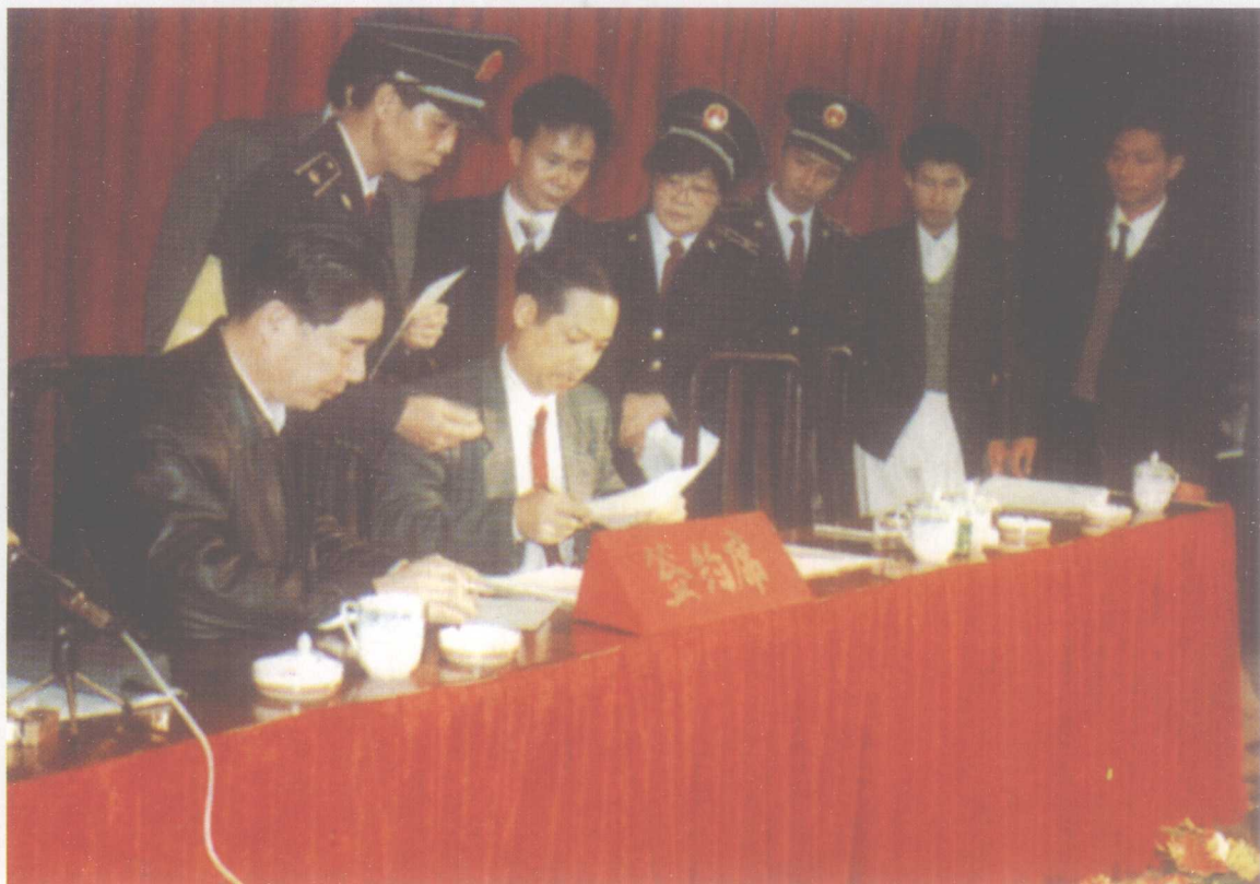
中山市国土局与香港永胜置业有限公司签署土地出让合同书,公证人员现场公证。