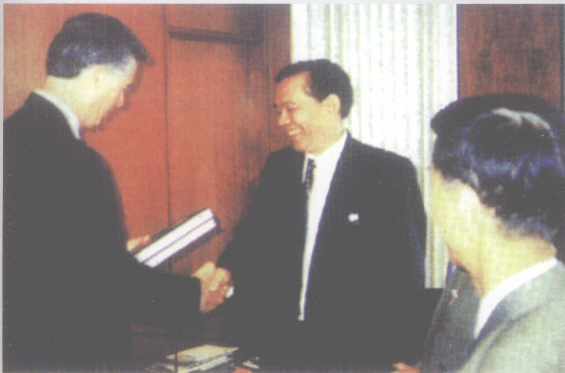
曾兵,1992年11月至1996年6月任广东省司法厅厅长。 图为1993年9月曾兵厅长(中)率广东律师代表团出访美国时与美国友人会面。