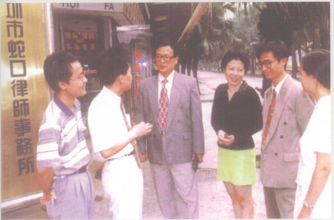
1983年7月，全国第一家由法律顾问处改为律师事务所的“深圳市蛇口工业区律师事务所”。