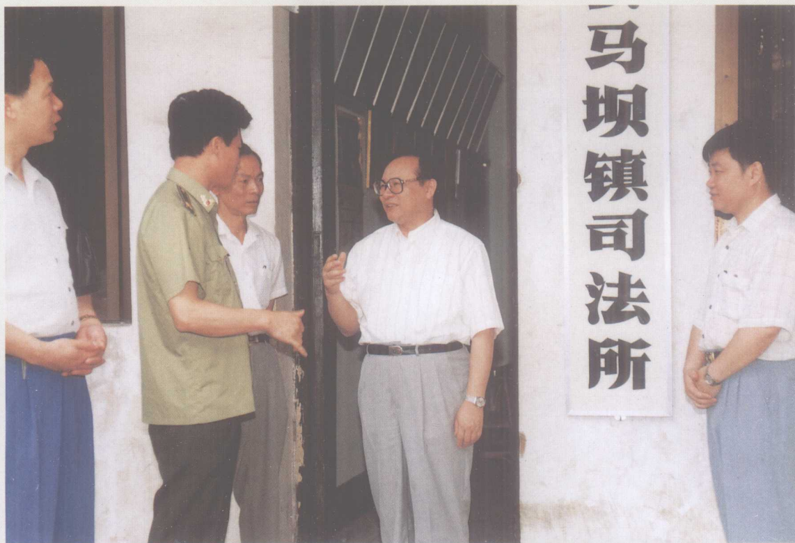
1997年王旭东厅长(右二)到韶关市曲江县马坝镇司法所检查指导工作。