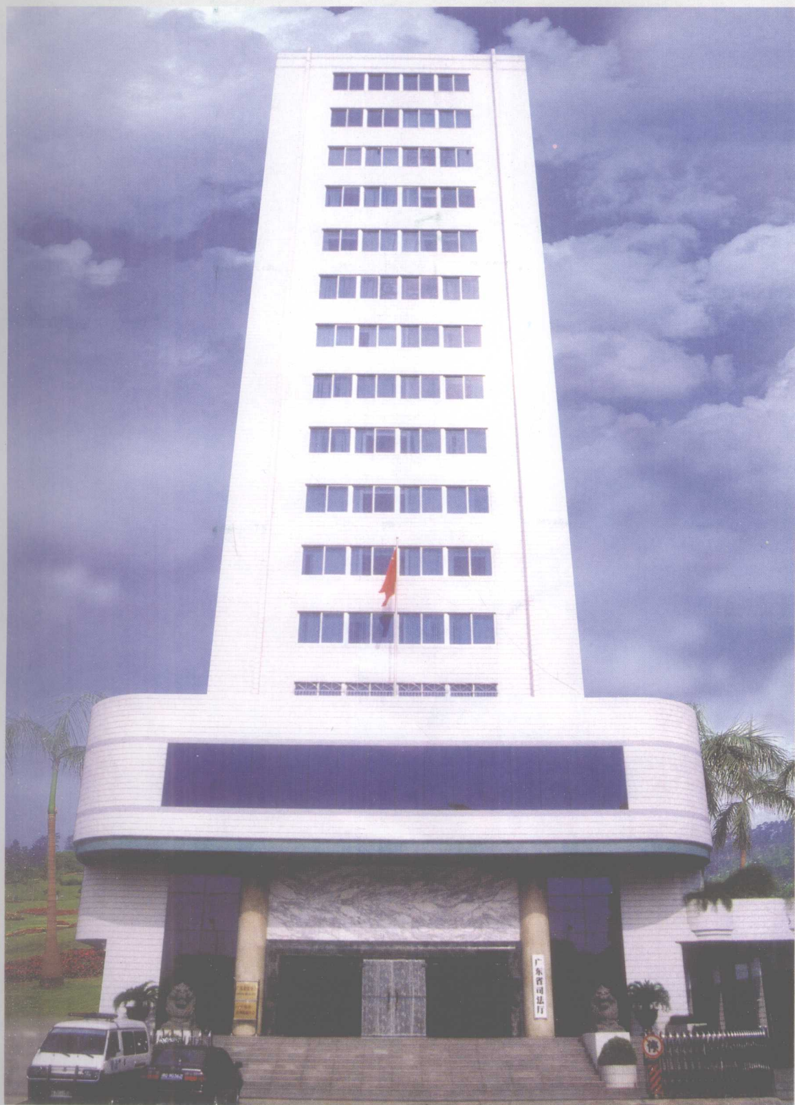
1998年6月广东省司法厅在广州市政民路51号建成的办公大楼。