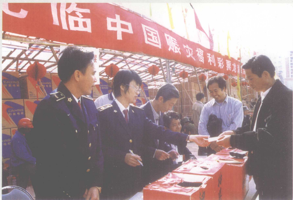
公证员为中国福利彩票的开奖活动现场公证。