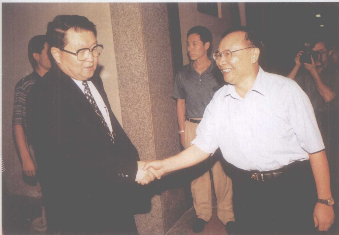
2001年7月26日下午,广东省“三五”普法表彰暨“四五”动员电视会议在广州举行。图为中共政治局委员、广东省省委书记李长春(左一)与省司法厅厅长王旭东(左二)亲切握手。