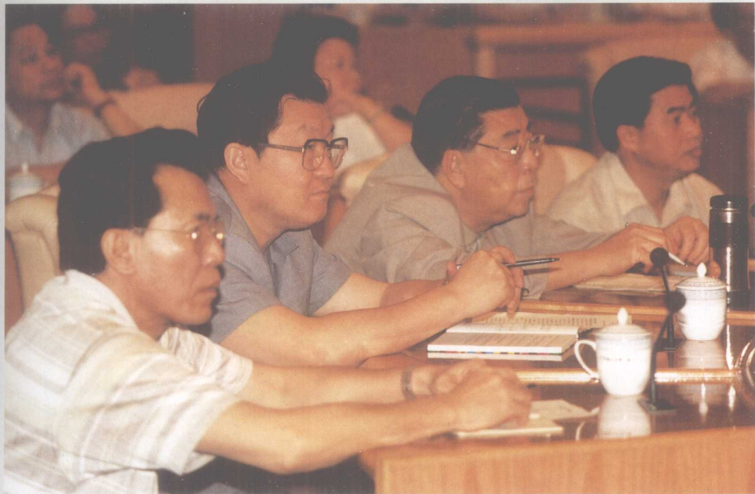
1988年4月28日,广东省普法办和省人大、省委宣传部、省司法厅在广东省人大会议室举办省五套班子领导干部法制讲座,共有副厅级以上领导272人参加了这次讲座。