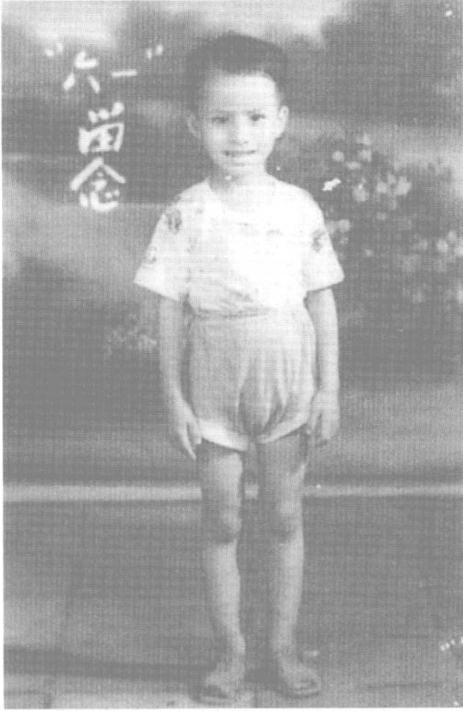
摄于1964年6月1日（保育院小班）