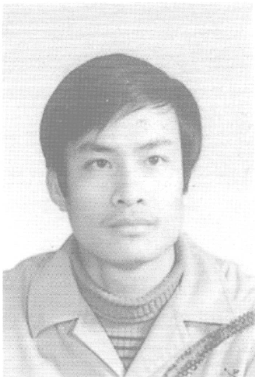
摄于1982年春（大学毕业照）