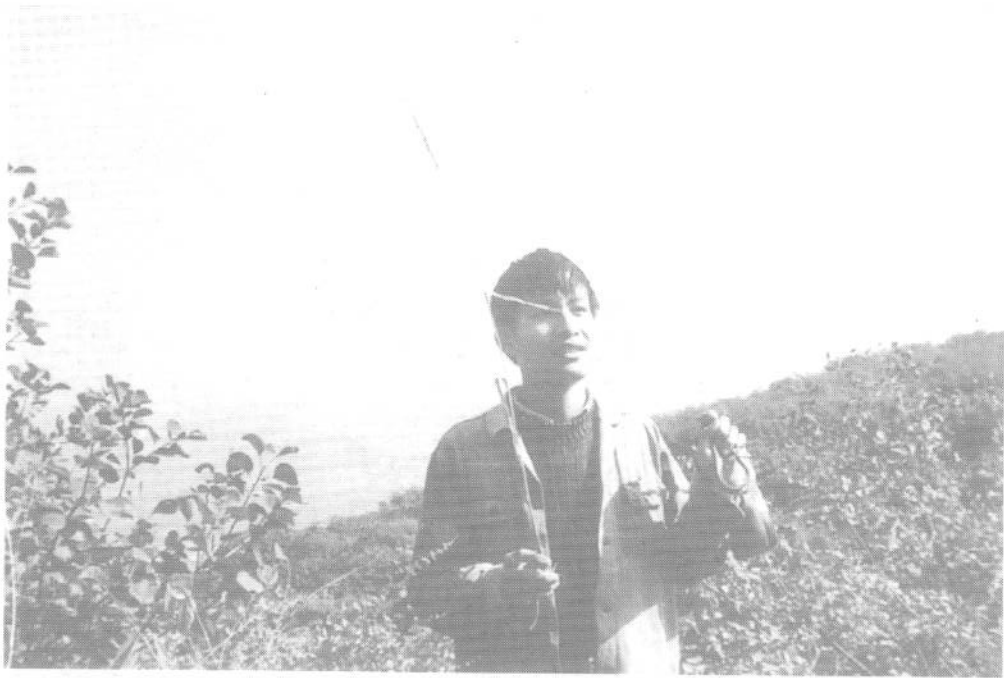
摄于大学时期（郊游）