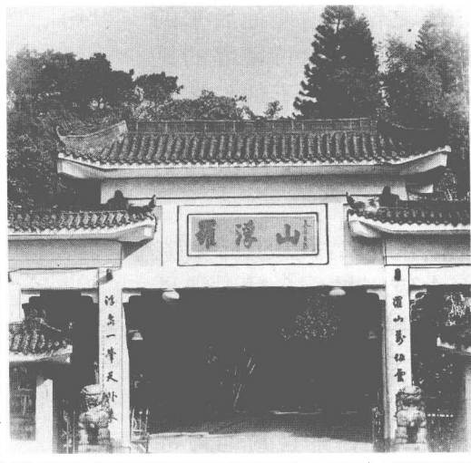
今天的罗浮山山门

朴子·外篇·自述》所说的，时当太安年间（302—303）石冰作乱以后的一两年。他虽然曾带兵参加平乱，并曾立功，但由于社会动乱，加上故友嵇含遇害，使他受到很大刺激，一时间看淡了荣华与名利，感到应当用