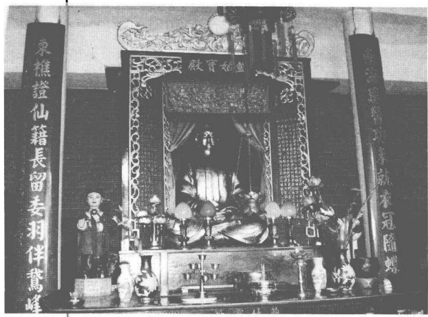
广州三元宫内的鲍姑宝殿