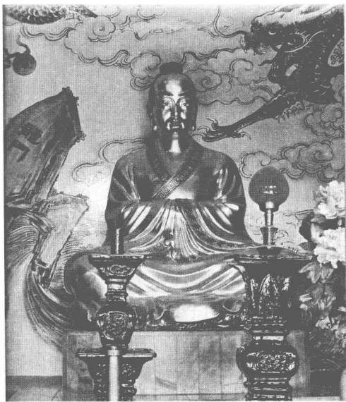
冲虚古观葛仙宝殿之葛洪像

(今属江苏)人。葛玄遍读五经，三国时候的吴国初年，跟从左慈学习《太清丹经》《九鼎丹经》《金液丹经》以及其他秘术。后来他到江西阁皂山修道，善于服饵、辟谷、符咒等道术，常常给人治病。他的医术很高明，吴国皇帝曾经召见过他。据传，有人乘舟在大海上漂流，