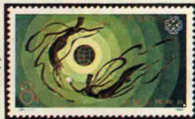
J. 90 马克思逝世一百周年