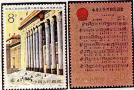
J. 94 中华人民共和国第六届全 国人民代表大会