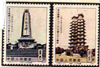
J. 89 京汉铁路工人“二七”