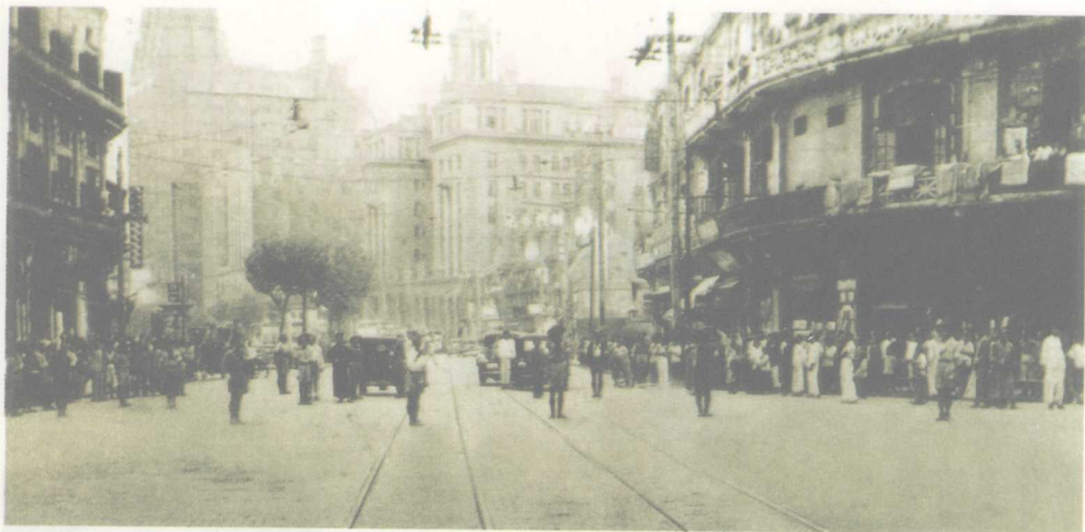
↑ 20世纪30年代上海租界街头

乱世中，各国在中国的租界成了许多人躲避战乱的好去处。一些人也真“躲进小楼成一统，管它春夏与秋冬”，过起乱世中平静的日子。他们正是作者笔下那些“只要自己过得衣食饱暖，什么国家社会、什么公共福利，皆一概不管”的人。