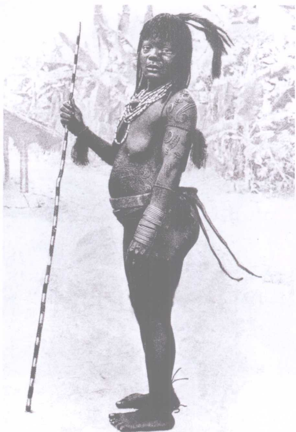
刚果边远地区的妇女，腰带和双辫是图腾装饰。

随后，在分析群体婚和外婚制的同时，他发现了一个极具有研究价值和有趣的现象——它们都具有严厉防止乱伦的作用存在。虽然原始民族并没有像我们一样的道德观念，但是他们对乱伦的畏惧及其处理方式却让人咋舌不已。例如，“在美拉尼西亚，一个男孩和他母亲、姐妹间的交往，有着种种限制。在里皮斯岛的新海布里地族，男孩到达某一年龄后便不可再居住于家中，而必须迁入‘营舍’内生活。在野外兄妹不期而遇时，他必须跑开或躲起来。男孩若在路上认出其姐妹的足印，他便不再顺着那条路走。女孩亦然。这种回避始自成年仪式后，而持续终生。儿子与母亲间的疏远也随年岁的增长而增加。在英属东