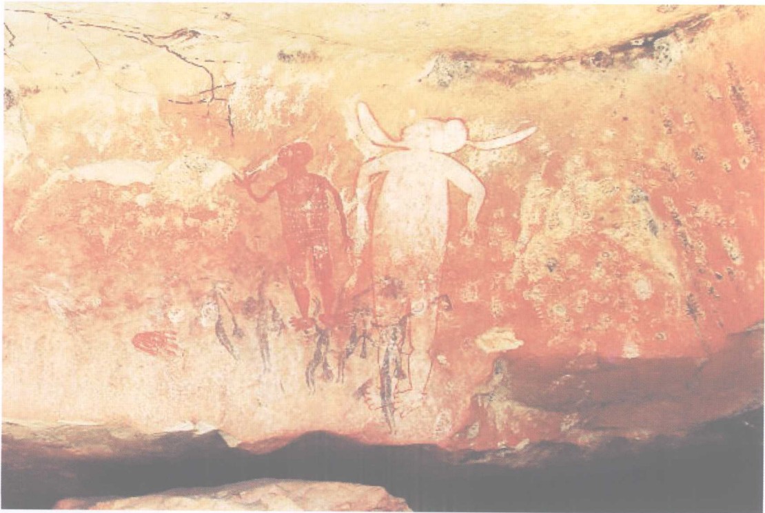
土著人的岩石图腾画