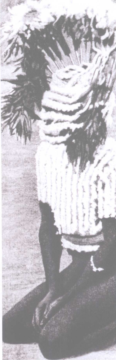
用巫术获取食用球茎的土著。这位土著的羽绒帽像一个球茎，上面像一朵花。这一图腾巫术是想使所有的可食球茎都为本部落开花结果。

弗洛伊德接着将精神分析学的理论正式运用到心理科学的领域。人类在长久的岁月里产生了三种主要的思想体系，即三种对自然的解释：泛灵论、宗教和科学的宇宙观。泛灵论，从狭义上讲，是对有关灵魂问题的讨论；从广义上讲，则它通常是指对精神生命的研究。大多数专家们都认为灵魂的观念是整个泛灵论体系的中心，它们包括相信动物、植物和物质也具有和人类灵魂相类似的特性等想法。伴随着泛灵论的产生还出现了两种控制人类、野兽和物质及其灵魂的理论：巫术和魔法。巫术，在本质上是一种以对待人的方式来影响灵魂的做法（使它们息怒、服从命令等），即利用在活人身上被证明为有效的一切手段。魔法，则采取一种与日常生活心理方式不同的特殊方法来影响灵魂，它并不考虑灵魂的