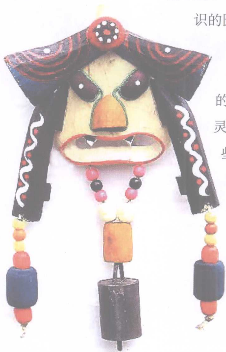
纳西族东巴图腾风铃