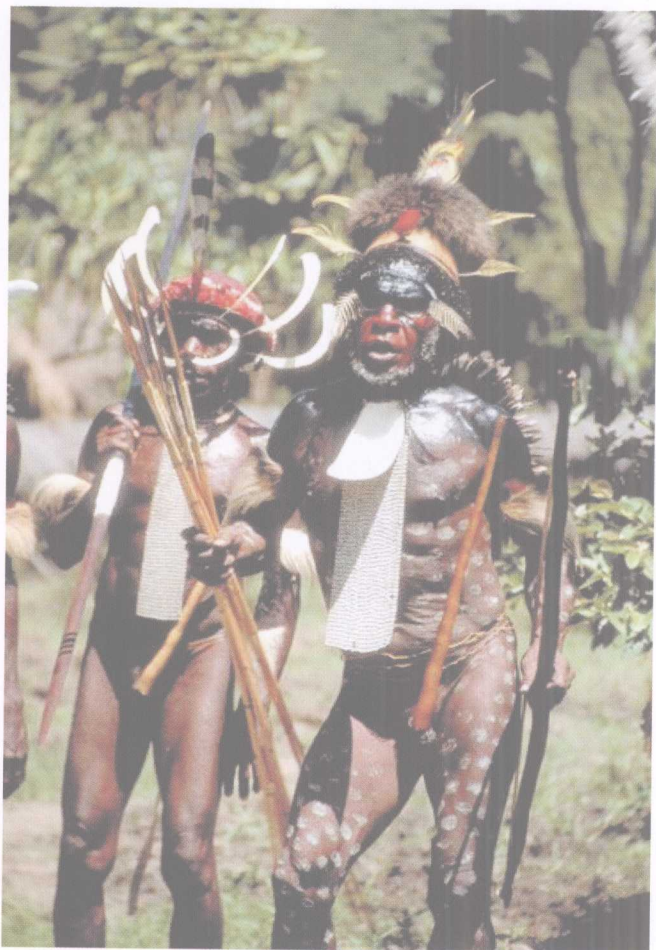
裸体的食人族部落

在澳洲的土著人中，系统的图腾崇拜取代了一切宗教和社会制度。澳洲的部落有的再分为更小的分支或氏族，各自拥有一个图腾去崇拜。然则图腾是什么？它很可能是一种动物，也许是可食或无害的，也可能是危险且恐怖的。较少见图腾是一种植物，或一种自然力量（如雨或水），它与整个宗族有着某种奇异的联系。大致说来，图腾总是宗族的祖先，同时也是其守护者。它发布神谕，虽然令人敬畏，但图腾能识得且眷顾它的子民。同一图腾的人有着不得杀害（或毁坏）其图腾的神圣义务，不可以吃它的肉或用任何方法来以之取乐。任何对于这些禁令的违背者，都会自取祸端。图腾的特征并非仅限于某只