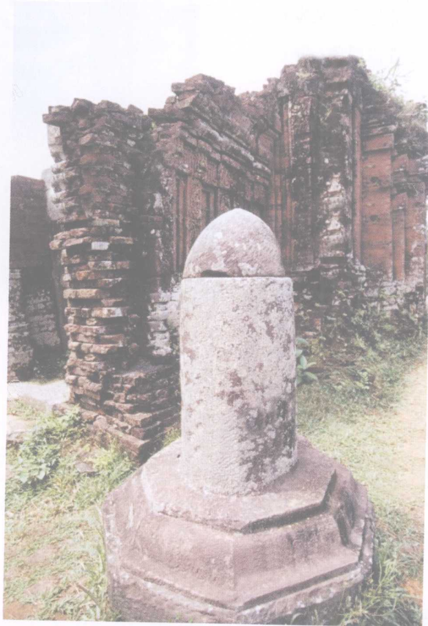
越南美山圣地——占塔残迹中遗留的阳具图腾石柱

存在或其性质。巫术与魔法的特点，我们可以举一个简单的例子来说明：用喧哗和喊叫来驱除灵魂，这种行为我们可称之为巫术。若先知道它的名字，然后以强迫方式来驱除它则魔法已被用上了。在对泛灵论的施术方式（巫术与魔法）作彻底的研究分析后，弗洛伊德发现原始民族在施术的操作过程中，极明显地暴露出了一个企图：尝试利用控制心理作用的规律来操纵真实事物。说得明白一些，即原始民族将心里想得到而实际无法得到的事物利用心理机制来加以实现。例如，常见的求雨仪式，日本的暇夷人（居住北海道等地）常将筛子装上帆和桨使它看起来像条船，其他的人则拿着碗盛水，然后将它推至田园并加以洒水。在爪哇的某些地方，当稻米即将开花时，农夫们带着妻子在夜间到他们的田里，通过发生性关系以引起稻米的仿效从而增加生产。所以，弗洛伊德相信人类对自然的第一种解释（泛灵论）是由心理作用所造成的。最后，他在对孩童心理和强迫性神经症的研究比较后，得到了一个较为具体的结论：泛灵论时期在次序和内涵上与自恋时期相似；宗教时期就像小孩子崇敬他们的父母一样，相似于目标选择阶段；至于科学时期，它正如同一个人达到了成熟的阶段，人们已放弃了纯粹的快乐主义而能就事实对自己作适当的调