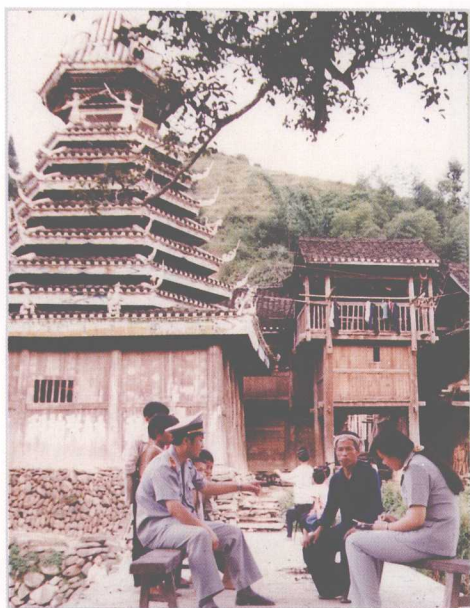
人民法庭发扬人民司法的优良传统，深入乡村巡回就地办案，把大量纠纷解决在当地。