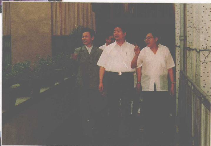
1993年,中共贵州省委书记刘方仁(中)到省高院视察工作。左为省高院院长谢锦汉,右为省高院副院长张林春。