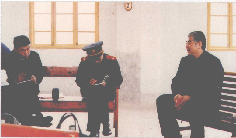
省高院院长石文礼深入基层法院调查研究。图为石文礼(右一)在龙里县法院听取工作汇报。