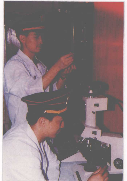
法医进行物证鉴定。