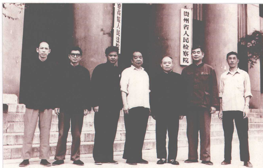
1980年,最高法院副院长何兰阶(右三)视察贵州法院工作时与省高院院长石文礼(右二),副院长吴开荣(左三)、方运棋(右一)合影。