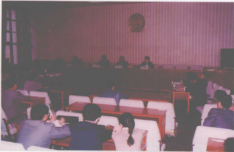
省高院行政审判庭开庭审判案件。