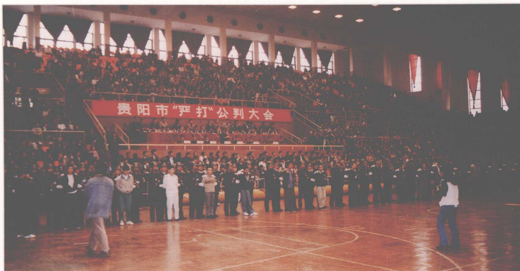
1990年4月28日,省高院和贵阳市中级法院联合召开“严打”公判大会,宣判处理一批严重刑事犯罪分子。

1995年“6·26”国际禁毒日,省高院组织贵阳、遵义、安顺、六盘水、毕节、黔西南6个中级法院开展集中打击毒品犯罪专项斗争,公开宣判71名毒品罪犯,5万余名群众参加了宣判大会。