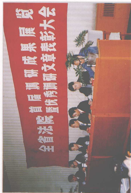
1995年10月，省高院举行全省法院首届调研成果展览暨优秀调研文章表彰大会。