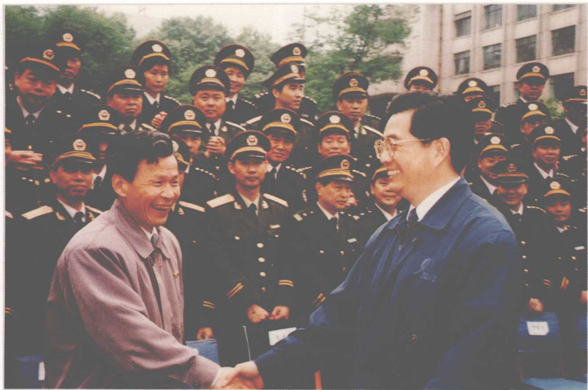
1996年5月,中共中央政治局常委、书记处书记胡锦涛(右)到贵州视察工作时,亲切接见政法部门领导同志,图为胡锦涛与中共贵州省委政法委副书记、省高院院长谢锦汉(左)亲切握手。