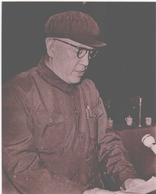
1978年7月12日至26日,省高院召开第19次全省司法工作会议,传达贯彻第八次全国司法会议精神。图为叶谷霖院长在会议上讲话。