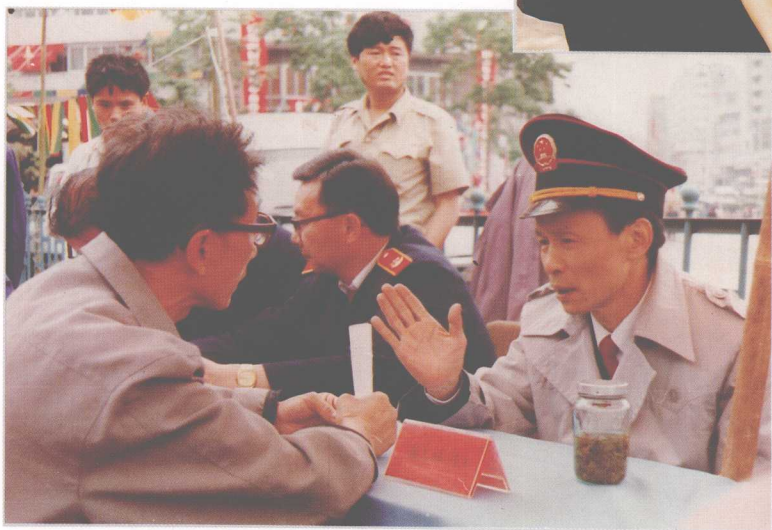
各级法院组织干警利用星期日、赶场天,在城镇繁华地段和深入村寨,开展社会治安综合治理宣传活动。图为省高院长谢锦汉(右一)、副院长李太荣(右二)在接待群众。