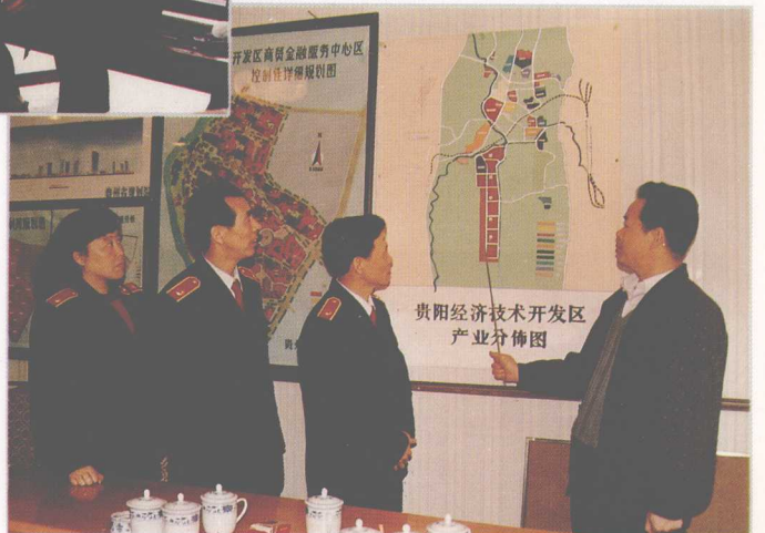
为筹建贵阳经济技术开发区法院,省高院院长谢锦汉(左三)深入开发区调查研究。