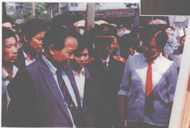
1993年5月9日,省高院与贵阳市中级法院160名干警走上街头,参加社会治安综合治理宣传月活动。图为中共贵州省委副书记王朝文,省委常委、政法委书记胡克惠在法院宣传点观看法制宣传版。