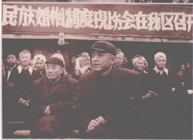
1959年12月5日至9日,省高院在凯里县洛榜区召开改革少数民族婚姻制度改革现场会。省高院长叶谷霖到会讲话并与少数民族群众座谈。