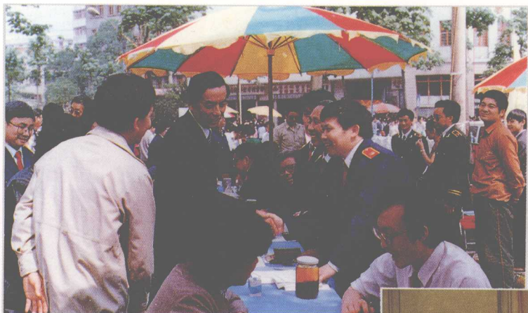
1990年4月,中央政法委员会秘书长束怀德到贵州检查社会治安综合治理工作情况。图为束怀德(中)看望省高院法制宣传点的法官。