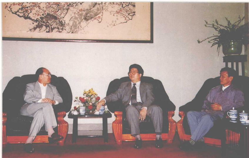
1997年,最高法院副院长谢安山(左)视察贵州法院工作时,与中共贵州省委书记刘方仁(中)、省高院院长谢锦汉(右)座谈。