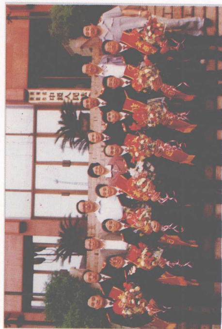
省高院组织全省法院系统英模和树法官形象报告团，深入9个地、州、市法院开展演讲活动。