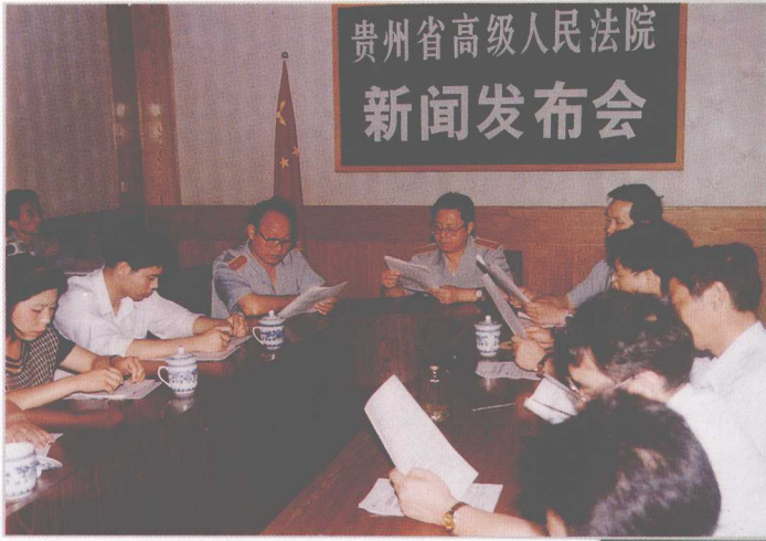
省高院通过新闻发布会,及时向社会各界通报审判工作进展,特别是重大案件处理情况。