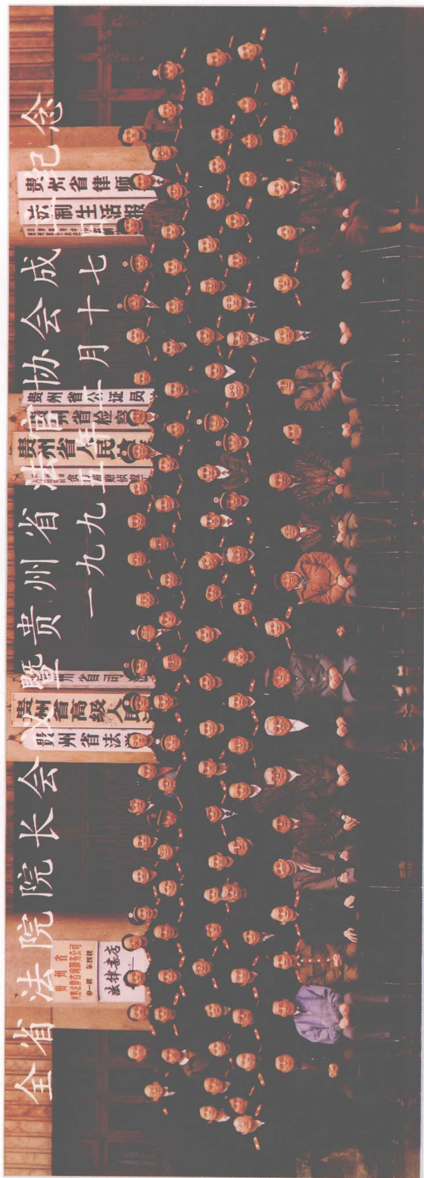
1995年2月15日至17日，省高院召开全省法院院长会议暨贵州省法官协会成立大会。中共贵州省委常委、政法委书记胡克惠，省人大常委会副主任禄文斌、李玲，省政府副省长张玉芹，老同志吴买、叶谷霖、石文礼以及政法部门有关负责同志出席会议并与会代表合影。