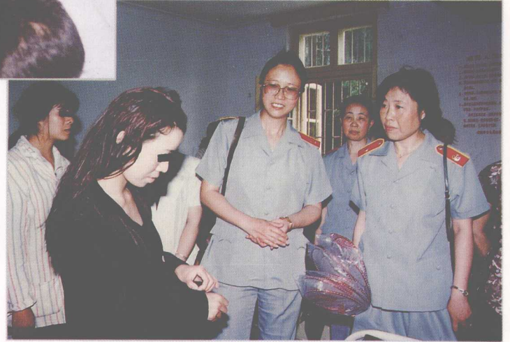
女法官以“热爱生命,远离毒品”为主题对吸毒女青年进行法制教育。