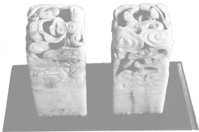
左宗棠使用的印章