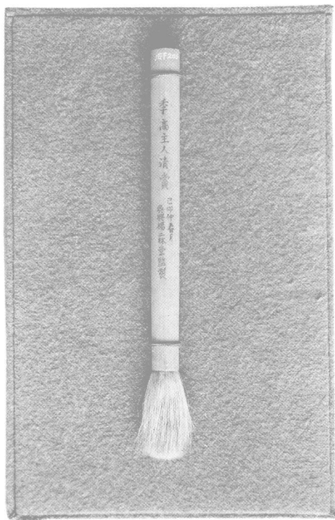
左宗棠使用的毛笔