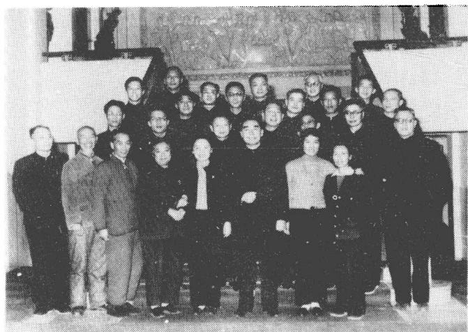
1961年作者(二排左起第四人) 与周恩来及文艺界人士在新侨饭店 合影