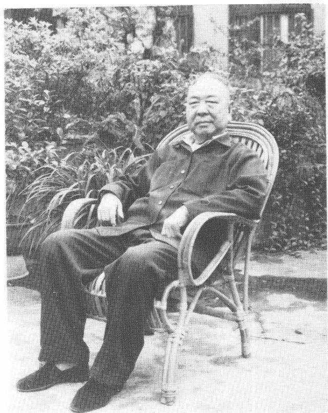
下：作者在花园中小憩（1986年）