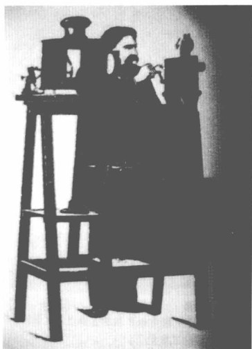
卢米埃兄弟发明的活动放映机