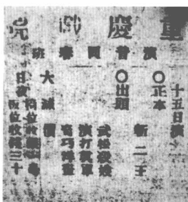
1900年香港重庆戏院演出海报