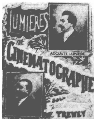
卢米埃电影在伦敦首映海报