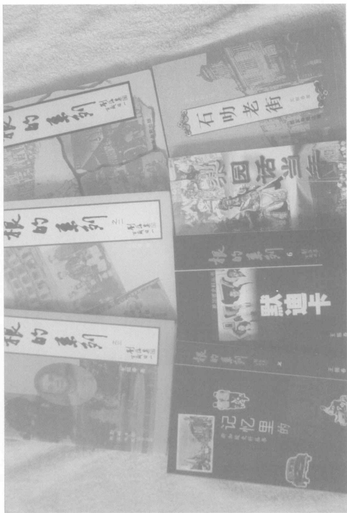
作者已出版的《根》系列》