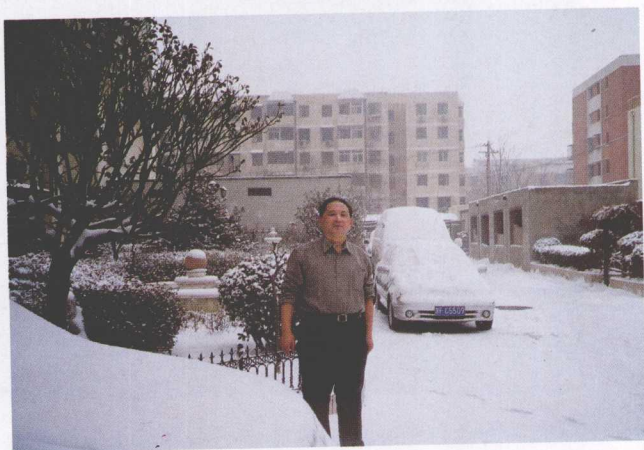
2005年冬季雪天在 北京宿舍前留影，有诗 云：“访道求法廿六 年，单衣犹可御冬寒。 若得我命皆由我，再向 火里学栽莲。”