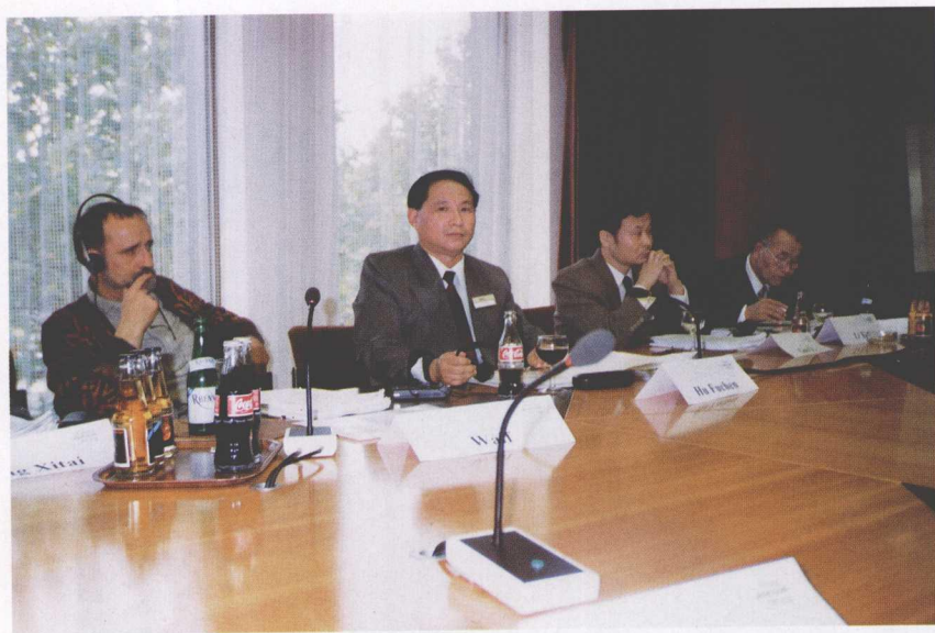
1997年10月在德国圣·奥格斯汀参加 “道家传统与现代化”国际学术研讨会