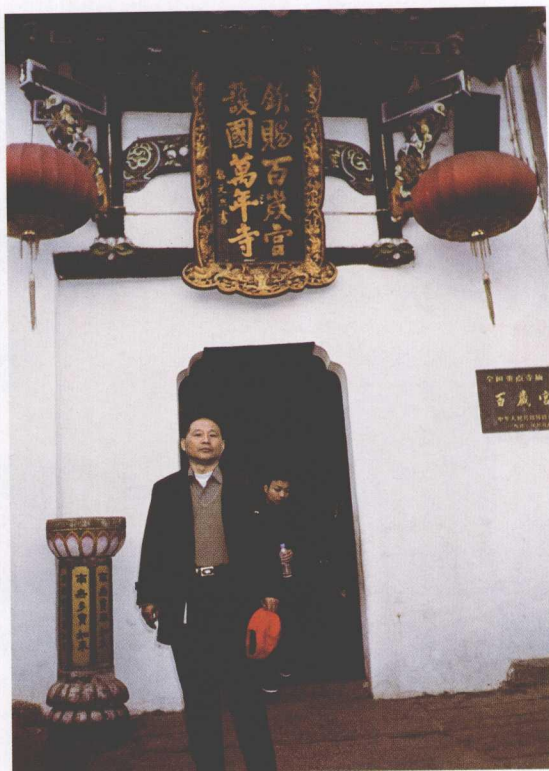
甲申年在九华山百岁宫前留影