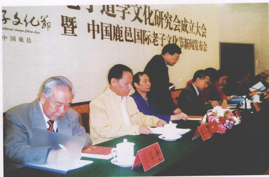
2008年3月28日在北京人民大会堂宣布全国老子道学文化研究会成立