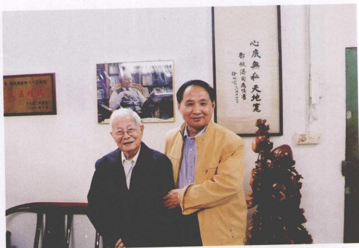
访广州名 医邓铁涛先生