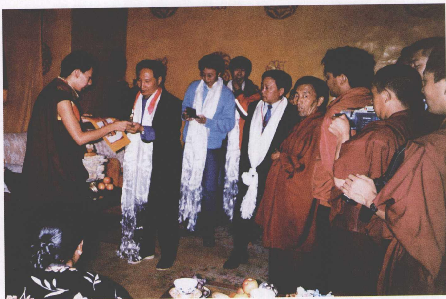
2004年在西藏日喀则喀什伦布寺参访11世班禅