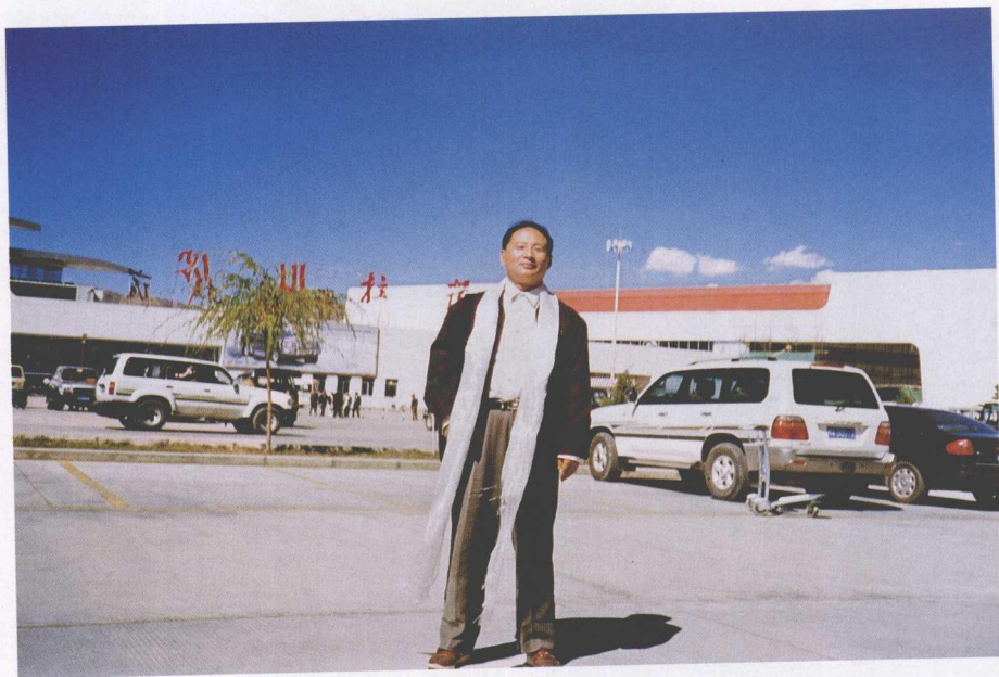
作者到西藏去参访