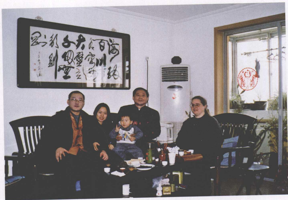
同加拿大、韩国的留学生在一起