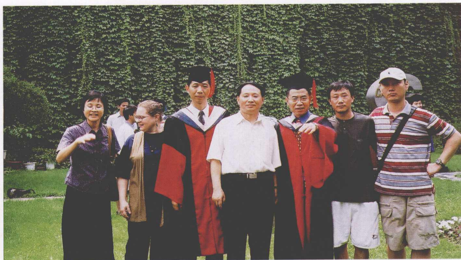
2002年与大陆、港台地区及日本、韩国、加拿大的博士生在一起