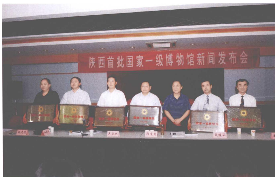
2008年5月18日我馆荣获国家首批一级博物馆称号。