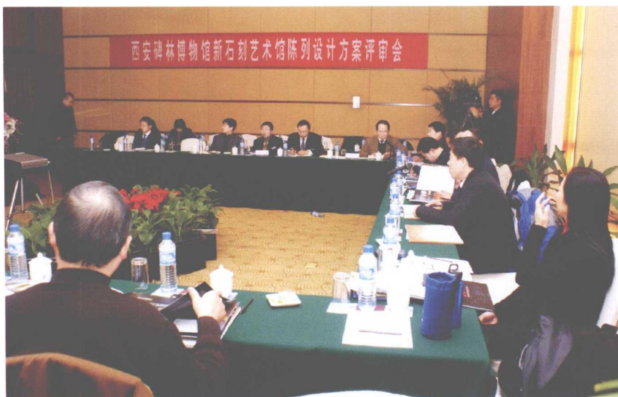
2008年12月26日 我馆举办新石刻艺术馆陈列设计方案评审会。