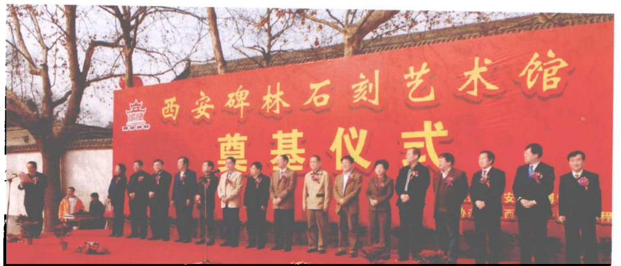
西安碑林博物馆新石刻艺术馆奠基仪式于2008年3月9日隆重举行。