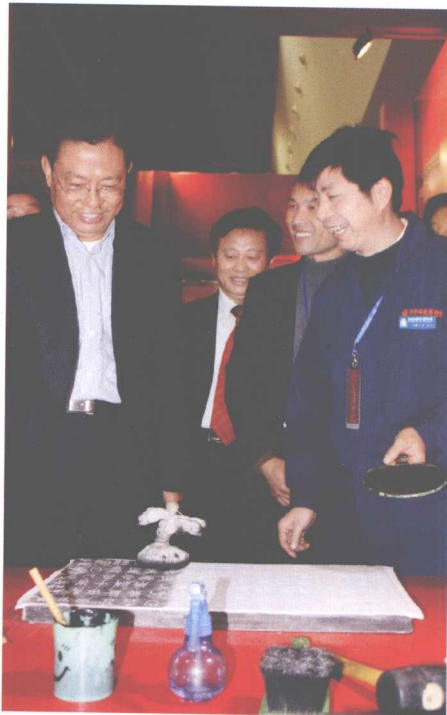
2008年11月2日，陕西省省委书记赵乐际在首届陕西旅游博览会上视察“西安碑林文化体验”活动。