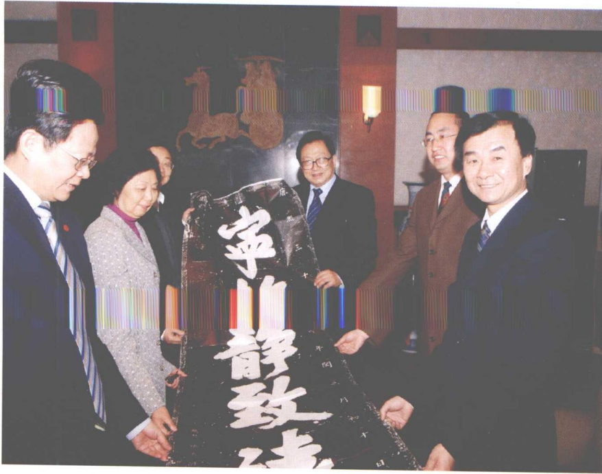
2008年4月5日全国人大副委员长华建敏来我馆指导工作。