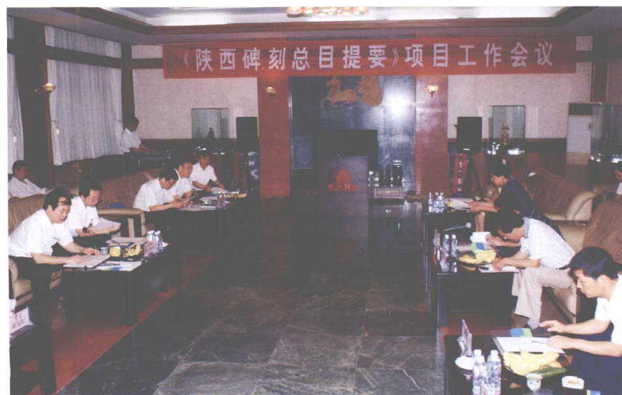
2008年5月29日陕西省文物局重点项目《陕西碑刻总目提要》工作会议在我馆召开。