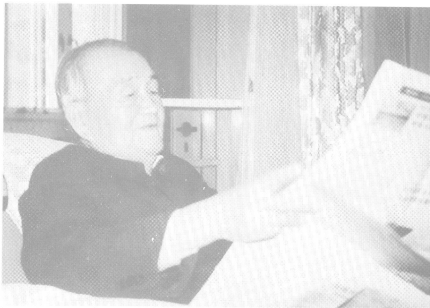
1992年3月胡乔木在上海瑞金宾馆。