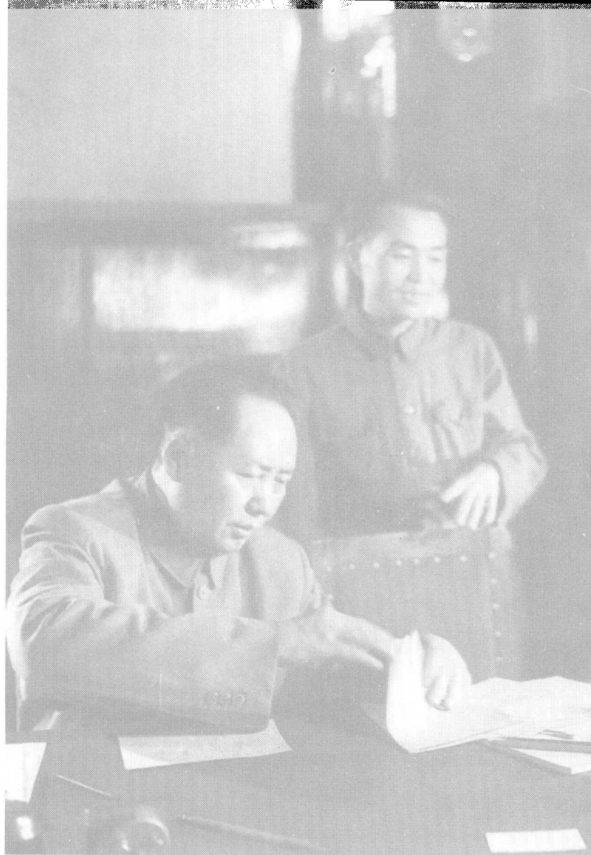
1950年6月29日毛泽东与胡乔木 在中央人民政府第八次会议上