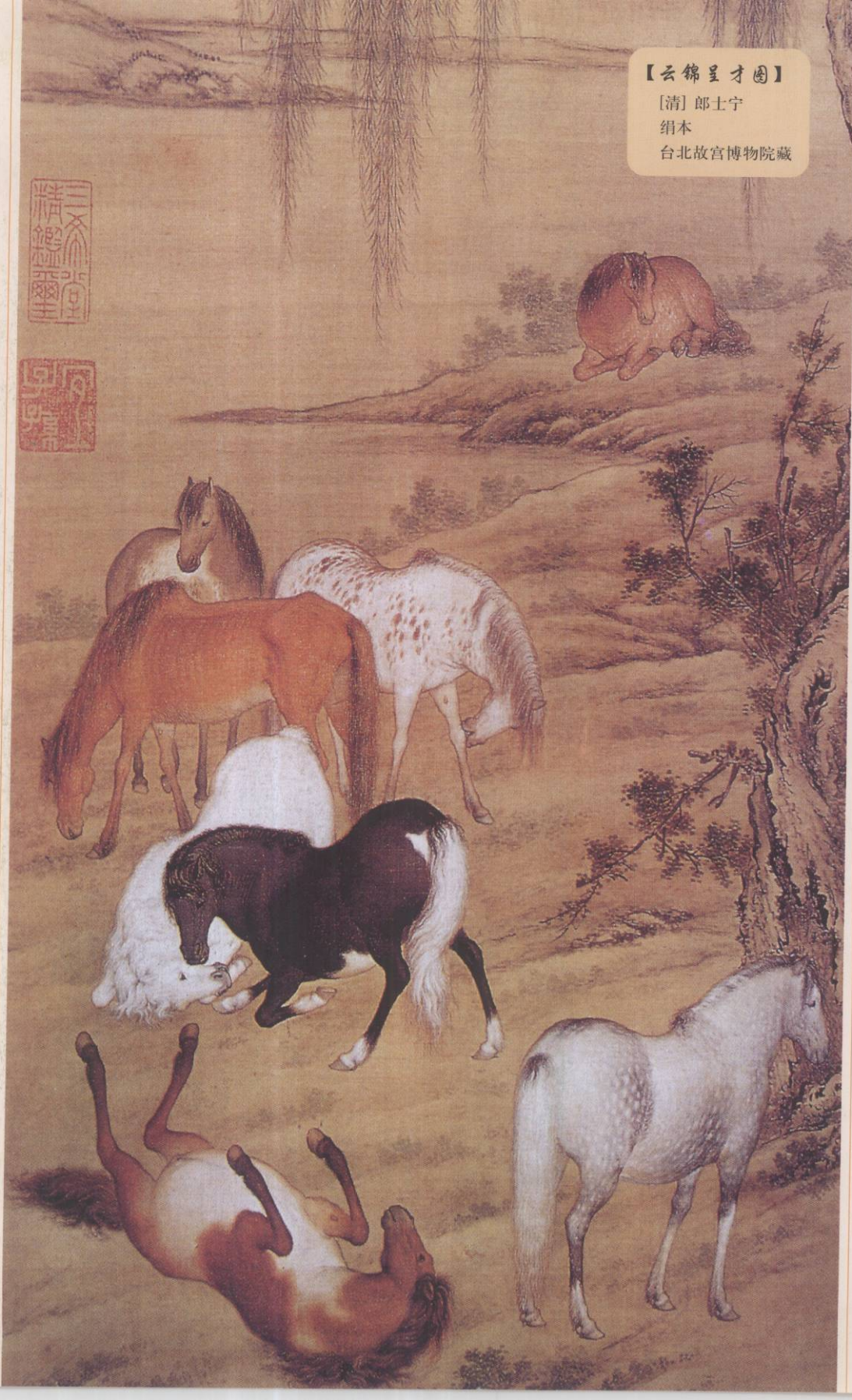
【云锦呈才图】 [清] 郎士宁 绢本 台北故宫博物院藏