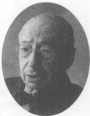
安德烈·科斯托拉尼： 一个真正的投机王者