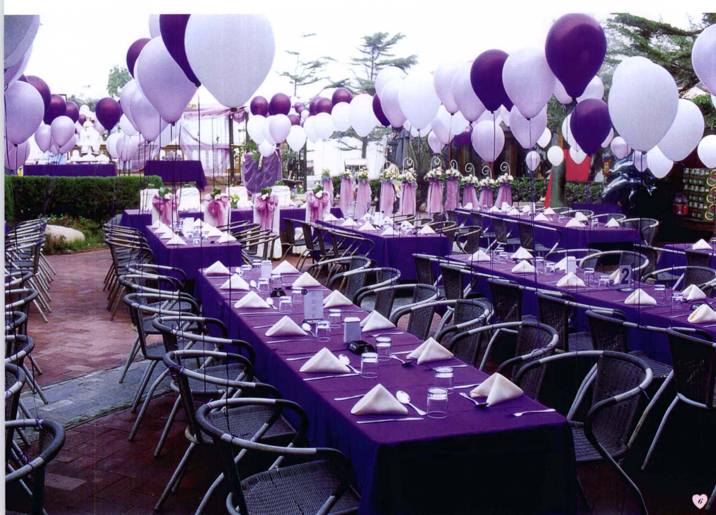
图6. 紫色和白色的气球是专门从韩国订制的，与晚宴餐桌的色彩浑然天成，充满浪漫激情的爱情之夜即将到来。