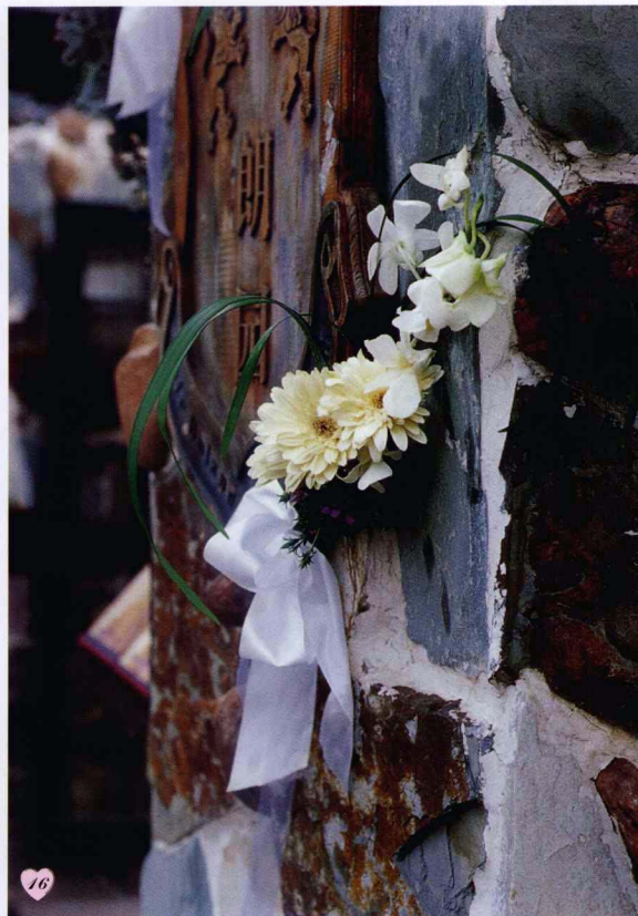
图14.15. 这是婚礼车队的首车,但这决不是一辆普通的摩托车,它在这对新人的恋爱岁月里曾扮演过重要的角色。于是乎,才有了今天的风光。有了花草的装点,它硬朗的外表之下添了几分柔情,相信它在今后的岁月里也会承载着主人的爱情一路奔驰,直到永远。 图16. 在有些怀旧感觉的门墙上随意点缀,告诉人们这里正在上演一段爱情盛典。

图17.18.19.20. 婚车。此款婚车结合陆虎本身的特点做了一点式设计,采用紫白色彩与主场氛围相吻合,剑叶和兰草为彪悍的陆虎增添了一些线条之美。