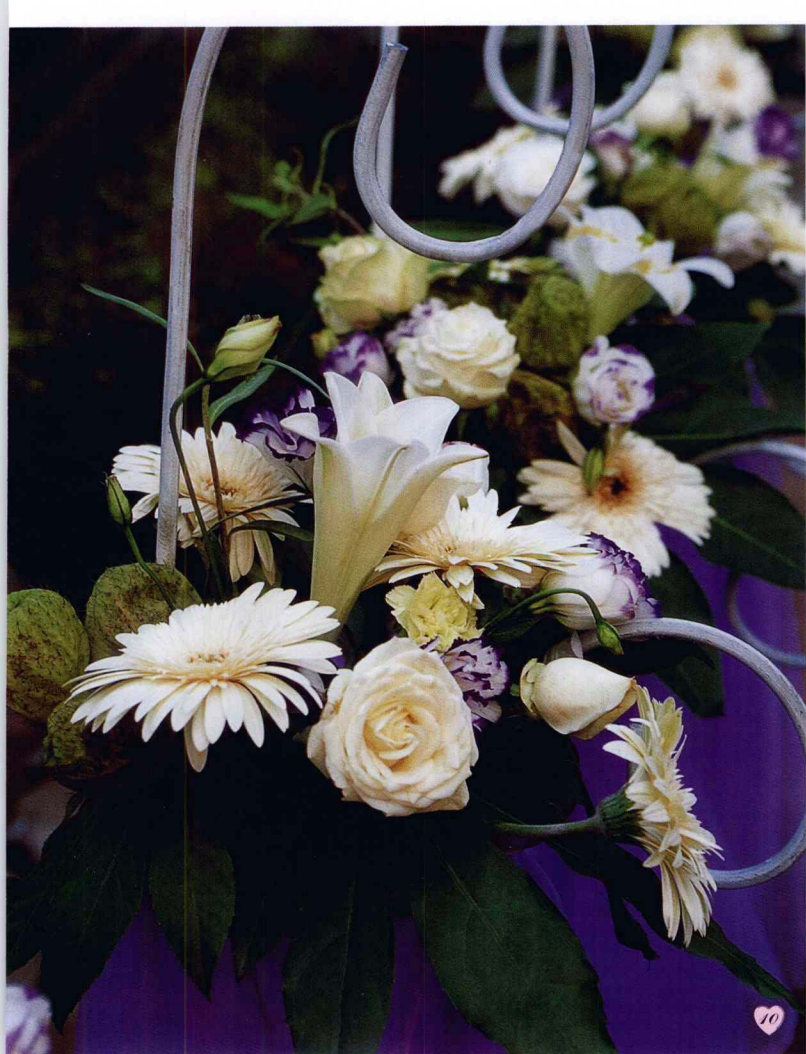
图 10.11. 花引。主要花材为百合、白玫瑰、白扶郎、绿色唐棉、紫色洋桔梗、八角金盘叶子，搭建了一条花香余韵的幸福之路，在神意的指引下，终会成就今生的爱恋。

图 12. 主桌椅背花。紫纱与餐台色彩相吻合，玫瑰般的爱情在巴西叶的映衬下蓬勃生长。