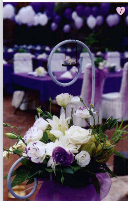
图7.8.9. 薄暮微临，庭院花艺里的点点烛光，营造的不仅仅是一种浪漫气氛，更将一份爱的情意传递到每个人的心上。