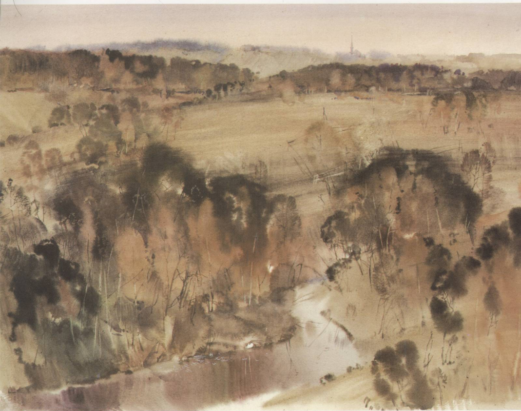
3. B. B. 科罗贝尼科夫 《风景写生》 水彩画 4 年级 1996 年 57.5×42