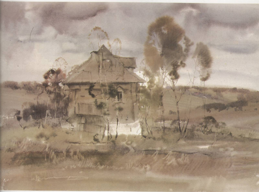
1. B. B. 科罗贝尼科夫 《林中小屋》 水彩画 4 年级 1996 年 59×42