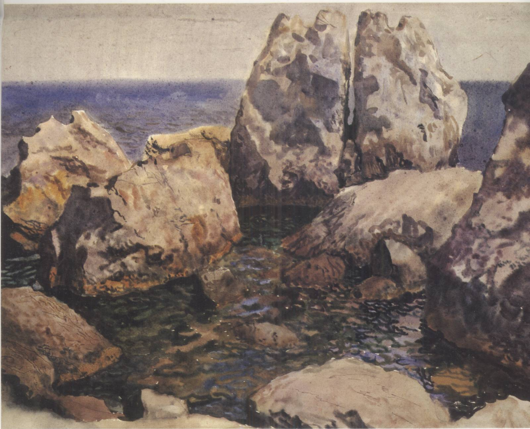
2. А. Я. Ломаяев 《阿卢普卡》 水彩画 2 年级 1994 年 55.5×41.5