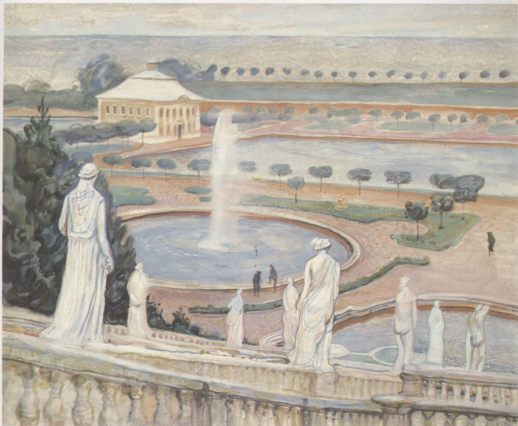
4. А. Я. Лома耶夫 《彼得宫》 水粉水彩画 3 年级 1995 年 59×48.5