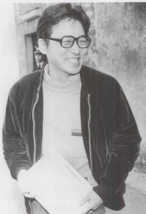
第二次政治犯出狱