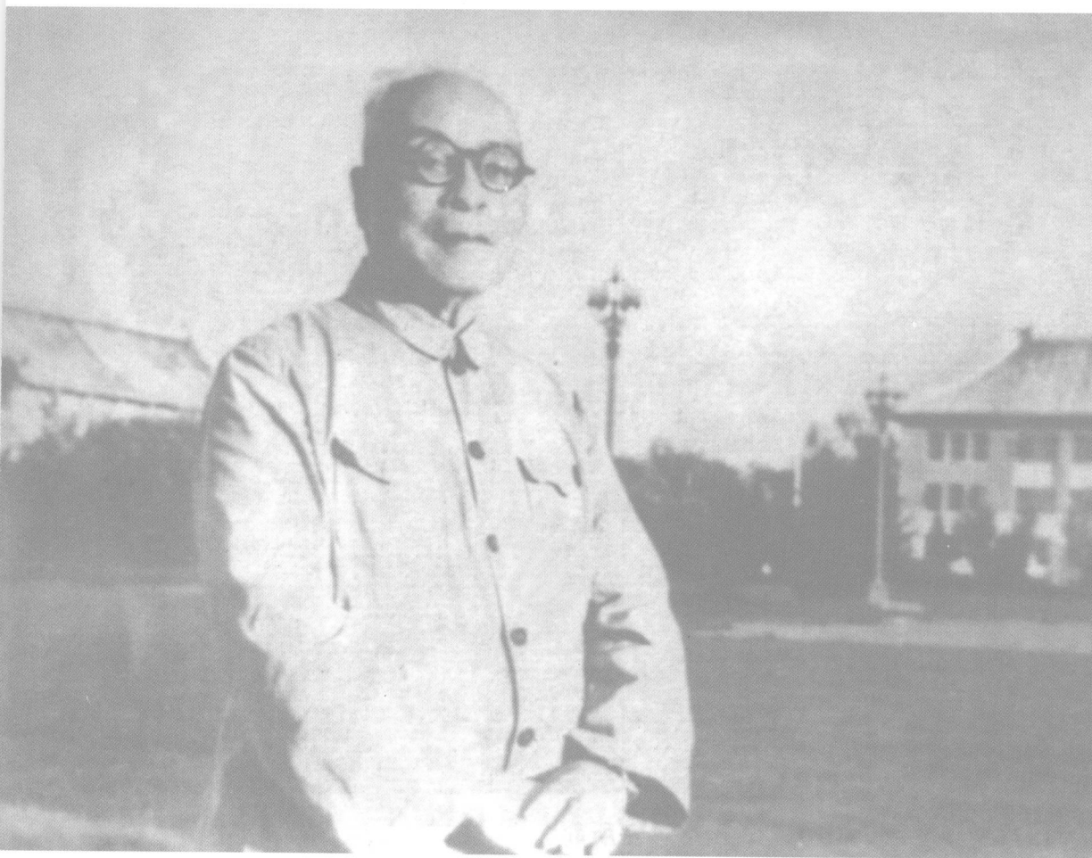
20 世纪 70 年代初,冯友兰在北大校园。