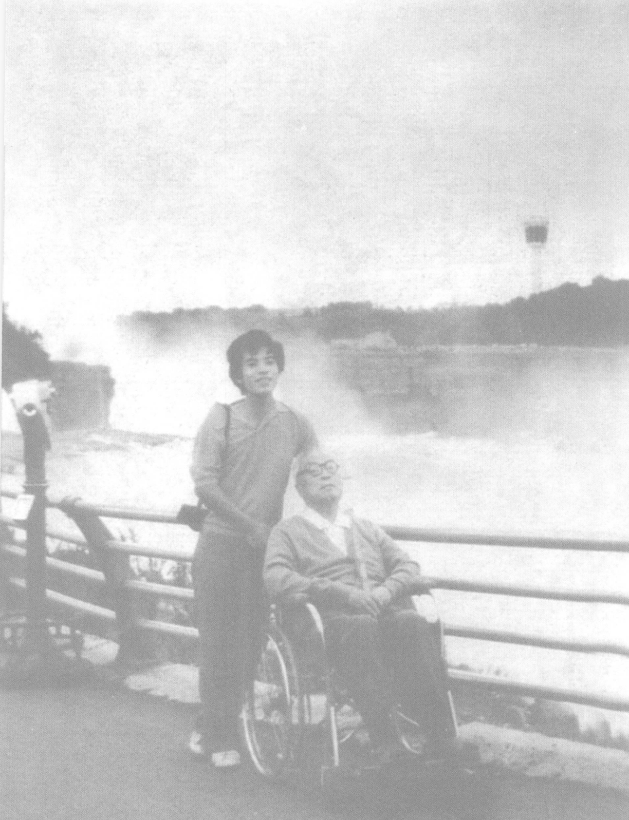
1982年,冯友兰与孙子冯岱在尼亚加拉大瀑布美国一侧。