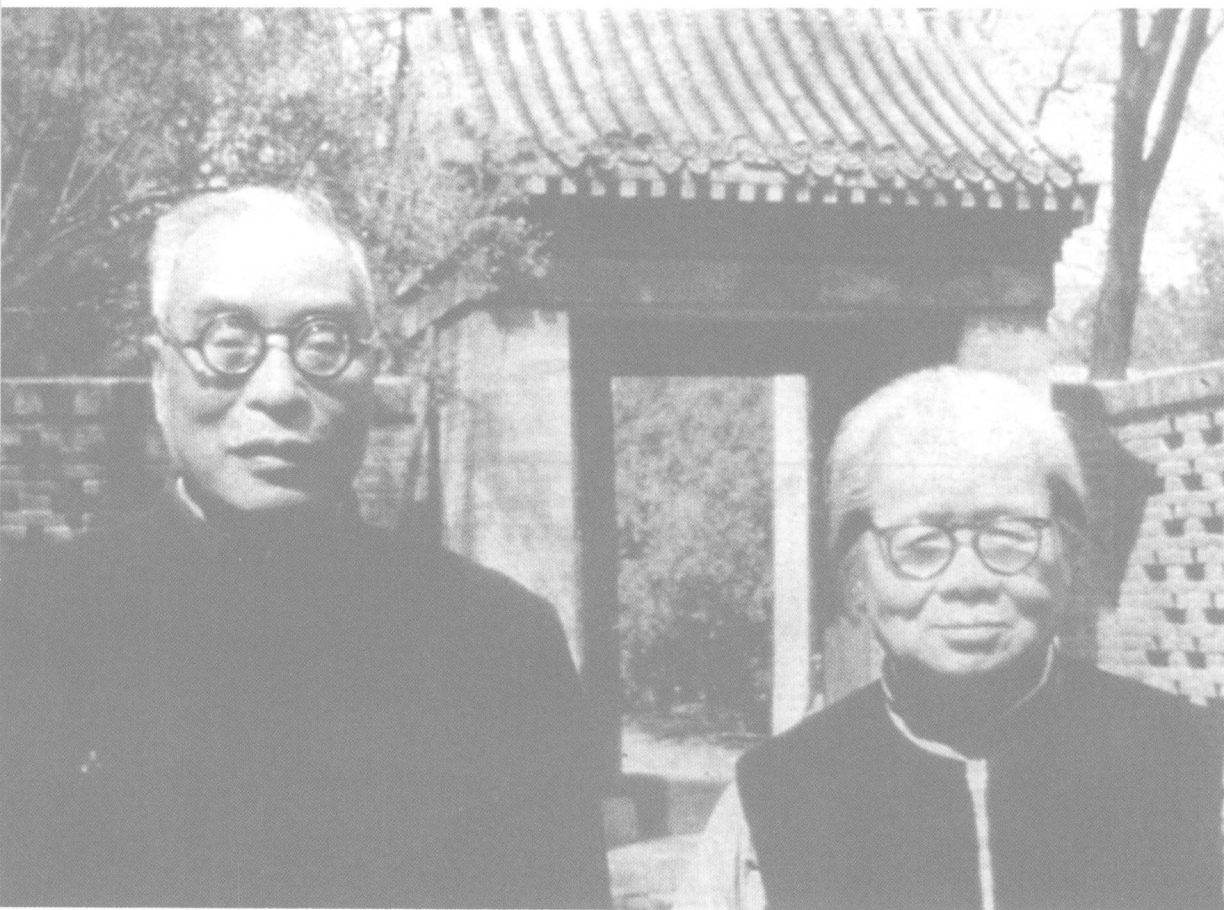
1973年，冯友兰夫妇在三松堂寓所前。