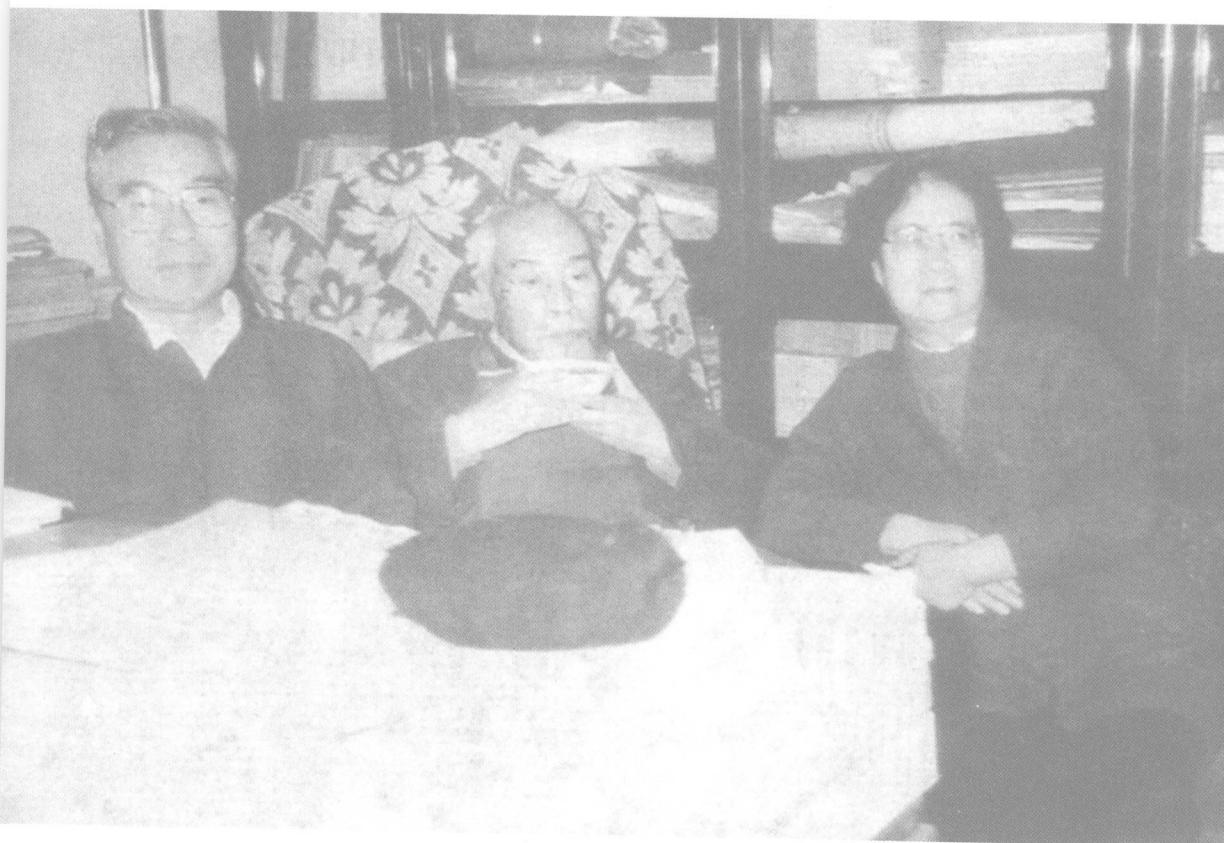
20 世纪80 年代中期,冯友兰与儿子钟辽和女儿宗璞在北京。