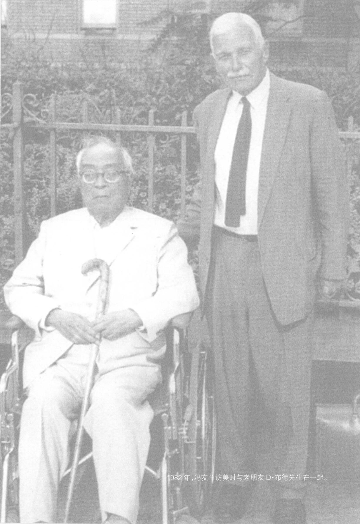
1982年,冯友兰访美时与老朋友D·布德先生在一起。