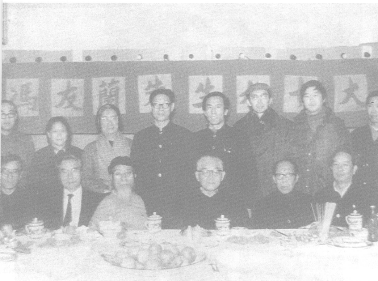
1985年,北京大学哲学系为冯友兰举行九十寿辰祝寿活动。前排左起第三人为冯友兰,第四人为张岱年。