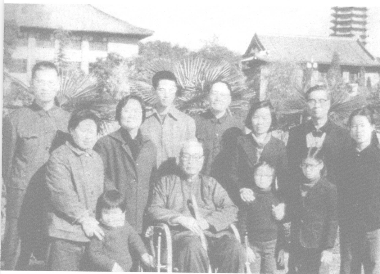
1977年,冯友兰在夫人去世后与家人合影。