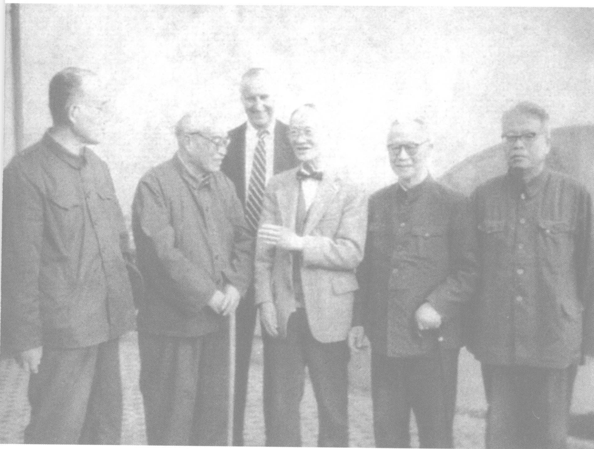
1981年10月，冯友兰在杭州参加“宋明理学讨论会”时留影。 左起为：张岱年、冯友兰、狄百瑞、陈荣捷、贺麟、石峻。