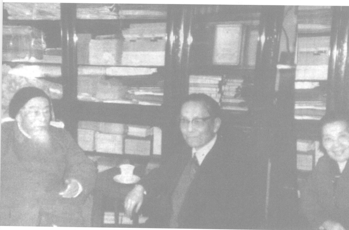
冯友兰与任继愈、冯钟芸(冯友兰侄女)夫妇在一起。