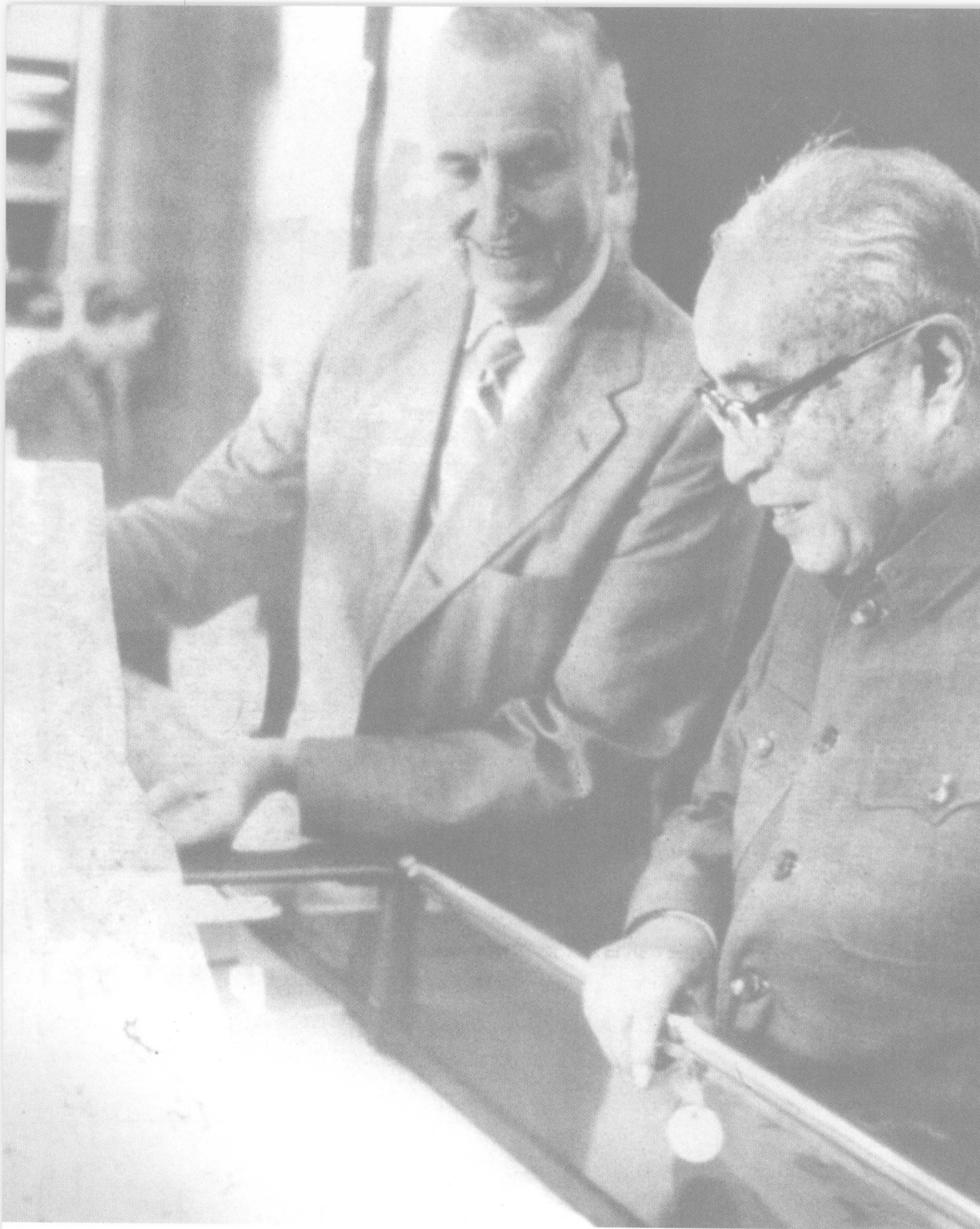
1982年，冯友兰访美时与友人、哥伦比亚大学终身教授狄百瑞在一起。