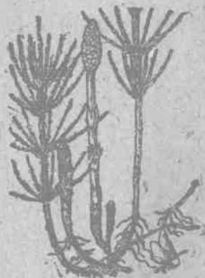
图1 問 荆

形态特征：营养莖与生孢子囊穗的莖絕不相同，营养莖在夏季生长，綠色，高1—2尺，徑1—2分，分枝輪生，有6—15条脊，气孔成2—4行的条带或分散，鞘筒疏松，长约2分，生孢子囊穗的莖在春季发出，白色，易凋落，鞘漏斗形，长4—5分，有棕色的齿，膜质。莖頂端的孢子囊穗有总梗，鈍头，长8—10寸。