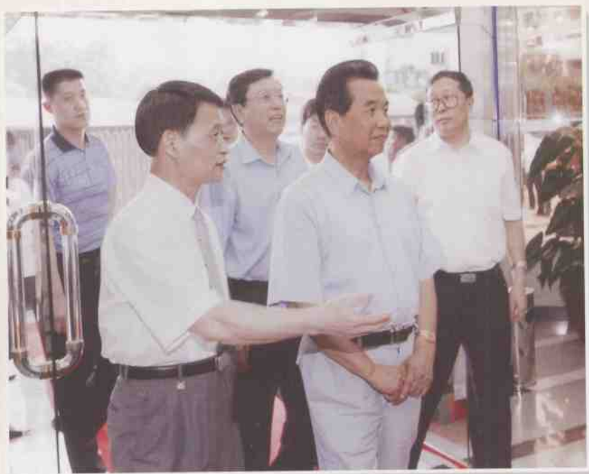
吴官正同志在省市领导陪同下步入深圳市政府采购中心服务大厅。