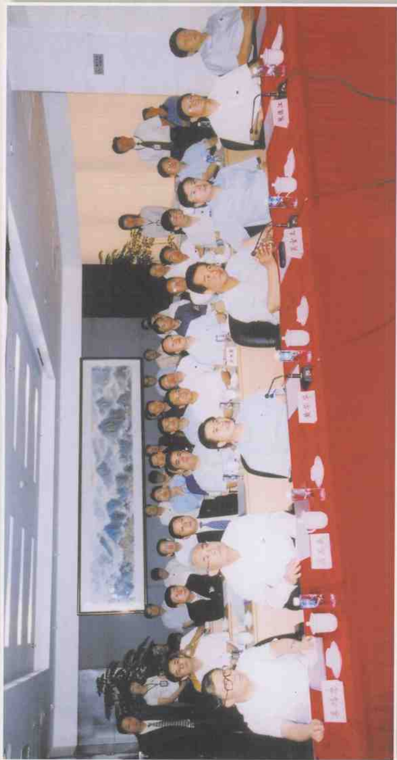
2005年5月20日，中共中央政治局常委、中央纪委书记吴官正(前排中)在中共中央政治局委员、广东省委书记张德江(前排右三)、省长黄华华(前排左三)、省委副书记、省党委副书记王华元(前排右一)、广东省委常委、深圳市委书记李鸿忠(前排左一)、市长许宗衡(二排左二)、市委副书记、市纪委书记谭国栋(三排左二)等领导同志陪同下亲临深圳市政府采购中心视察。