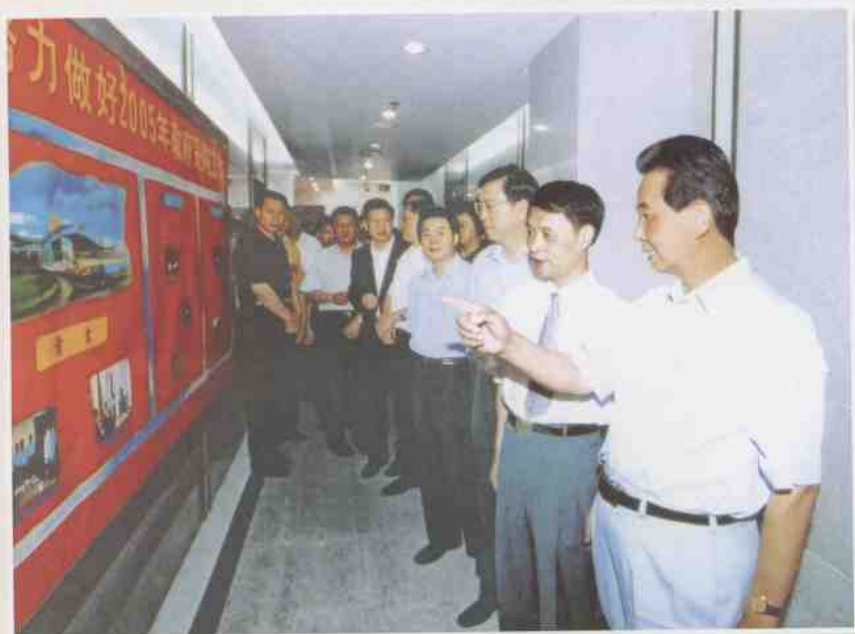
深圳市政府采购中心党组书记、主任李健成(前二)向吴官正同志介绍中心情况。