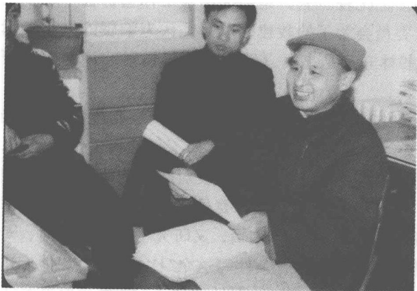
1982 年 1 月，主持创办《青年文摘》，图为创刊号审稿会。

我在中国青年出版社做过 30 年编辑，特别佩服社里的一位资深校对。我自认为是一个很认真、很细心的编辑，然而，我编发的书稿到了他的手里，总能挑出一些错误来。为什么那些从我眼皮底下溜走的错误，却逃不脱他的“火眼金睛”？直到退休我也没有解开这个谜。研究了十几年校对后，终于明白了个中的奥秘：校对的阅读与编辑的阅读，有着本质的区别，正是校对采用不同于编辑阅读的阅读方式，使他们能从密密麻麻的字里行间，敏锐地捕捉各种差错。当然，还有他们在长期校对实践中积累的经验，娴熟的校对操作技术，以及对文字使用出错规律的了然于心，在阅读过程中也发挥着特殊的作用。