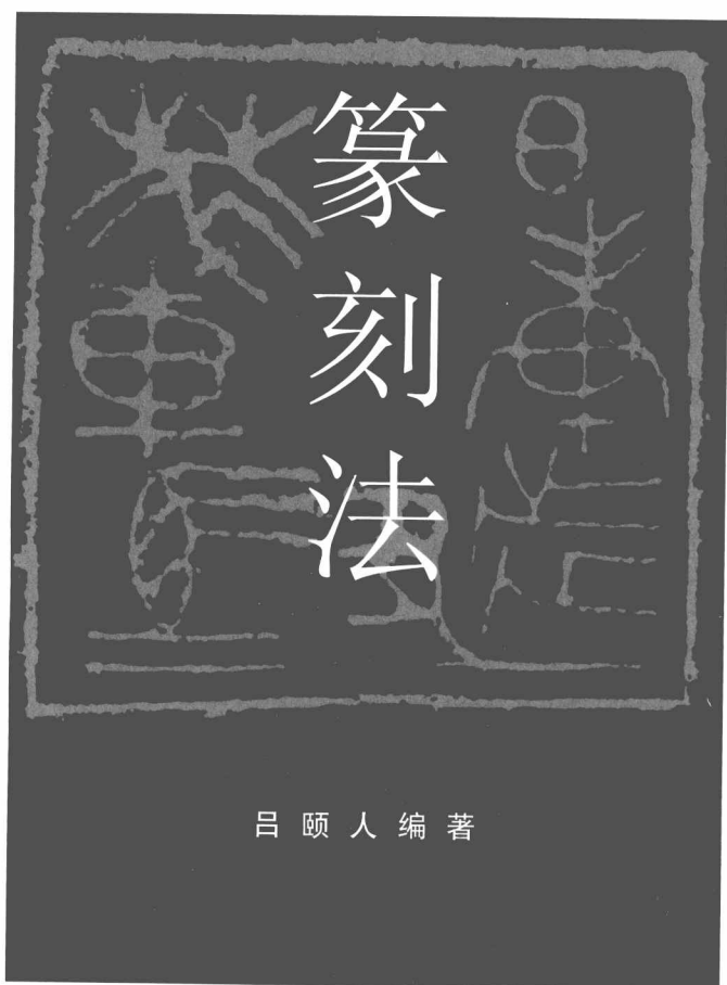
钱君匋先生设计的本书初版本封面