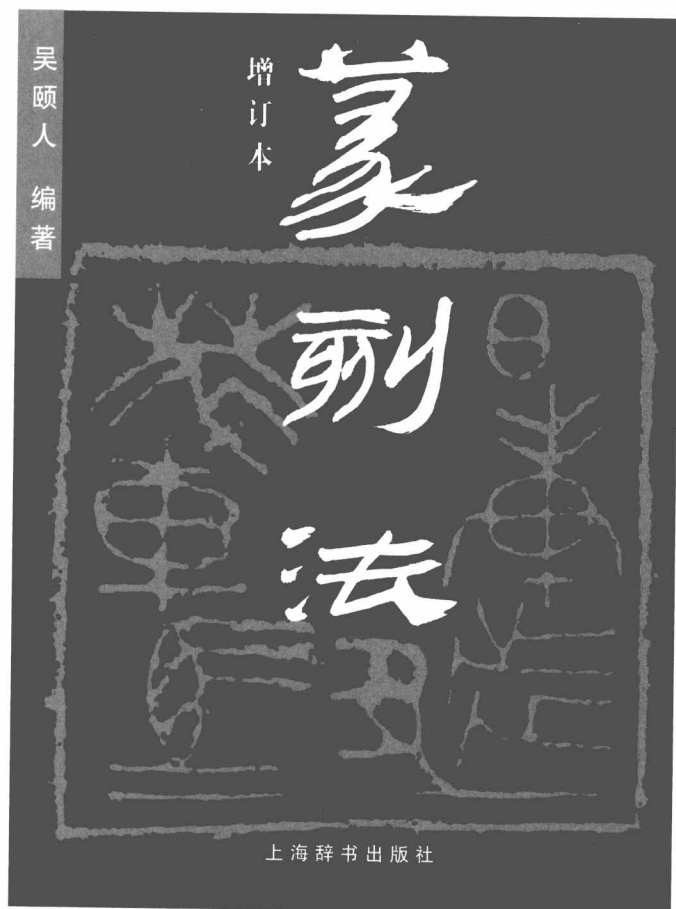
上海辞书出版社出版的增订本封面